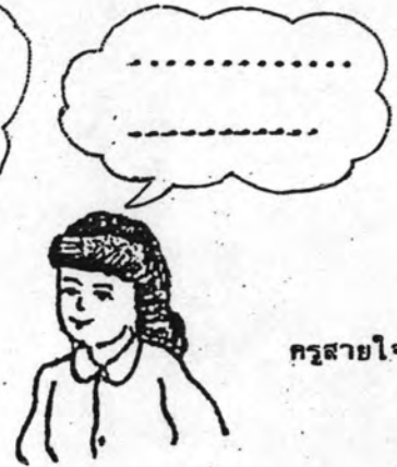
ครูสายใจ