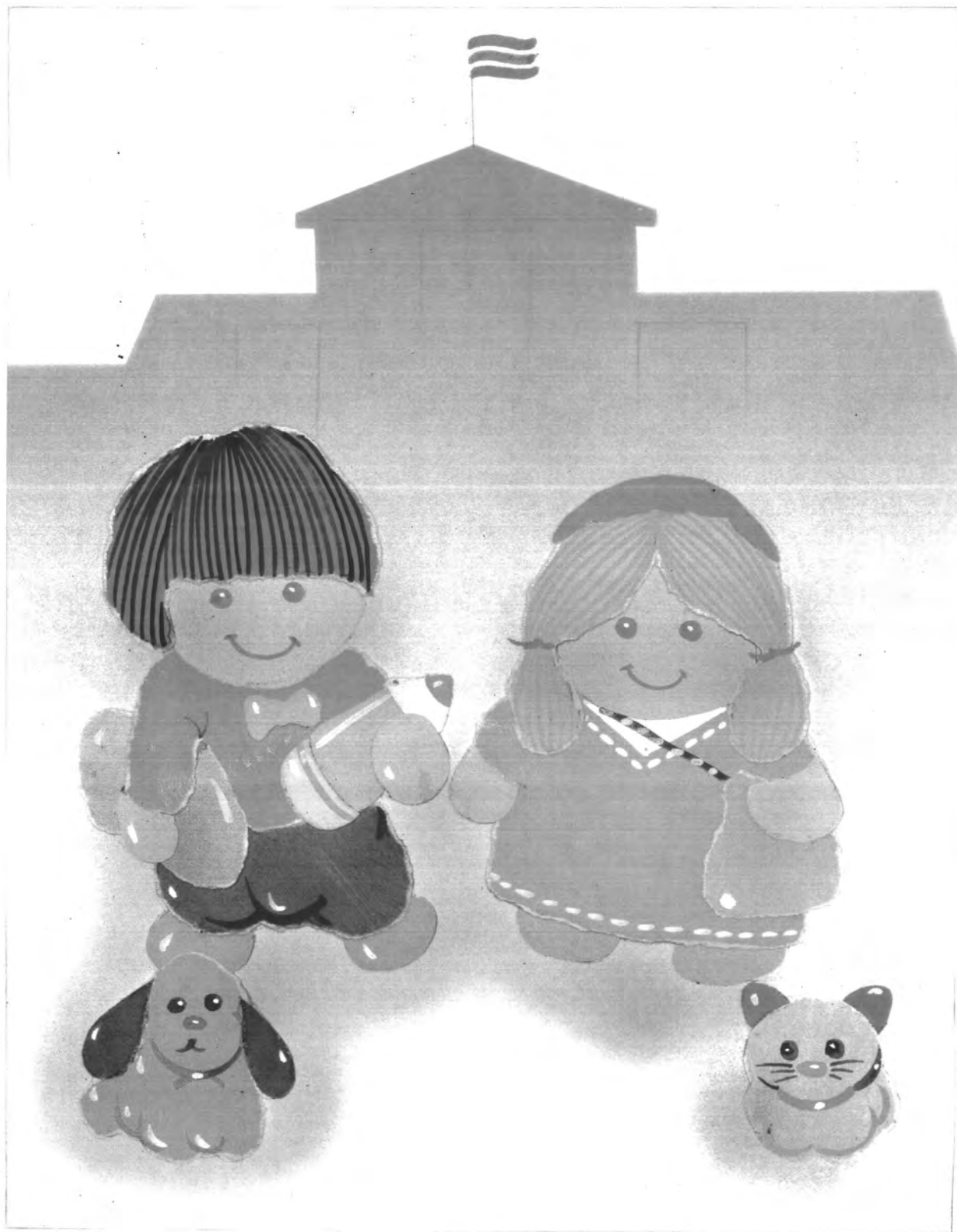
รูปแบบภาพจินตนาการ ใช้สีวรรณะอุ่น องค์ประกอบภาพแบบสมดุลย์ ใช้การปะติด