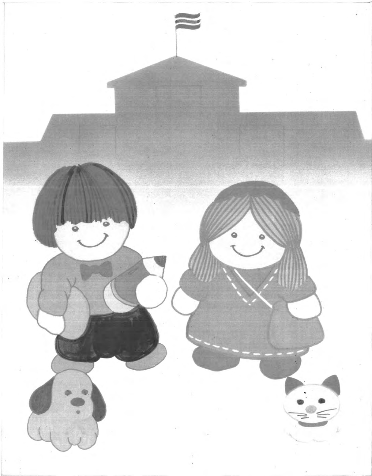
รูปแบบภาพจินตนาการ ใช้สีวรรณะอุ่น องค์ประกอบภาพแบบสมดุลย์ เขียนโดยผู้กัน