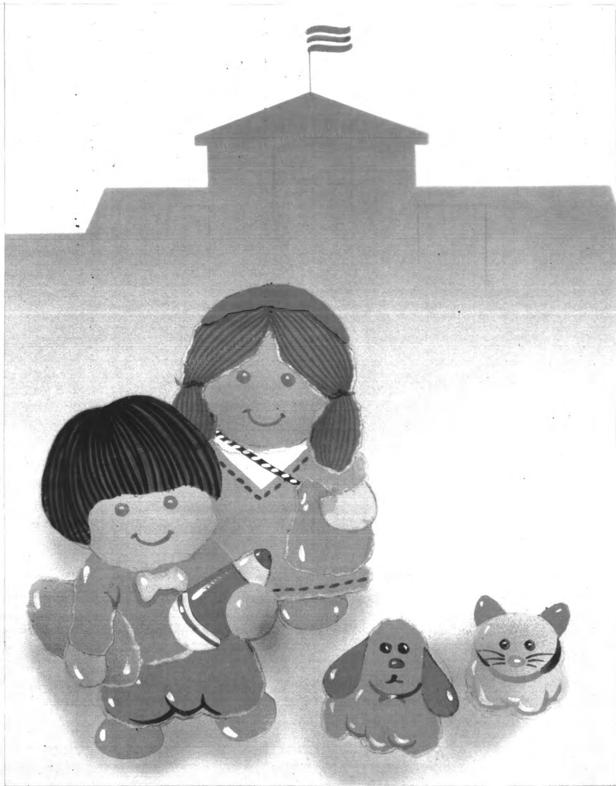
รูปแบบภาพจินตนาการ ใช้สีวรรณะอุ่น องค์ประกอบภาพแบบไม่สมดุลง่าย ใช้การปะติด