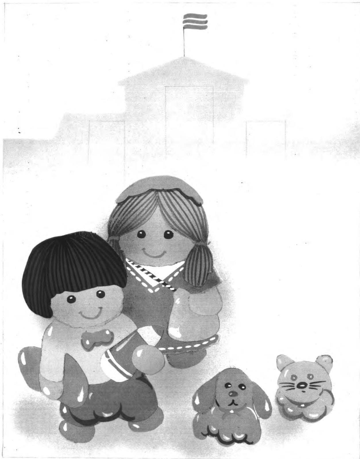
รูปแบบภาพจินตนาการ ใช้สีวรรณะเย็น องค์ประกอบภาพแบบไม่สมมูลย์ ใช้การปะติด