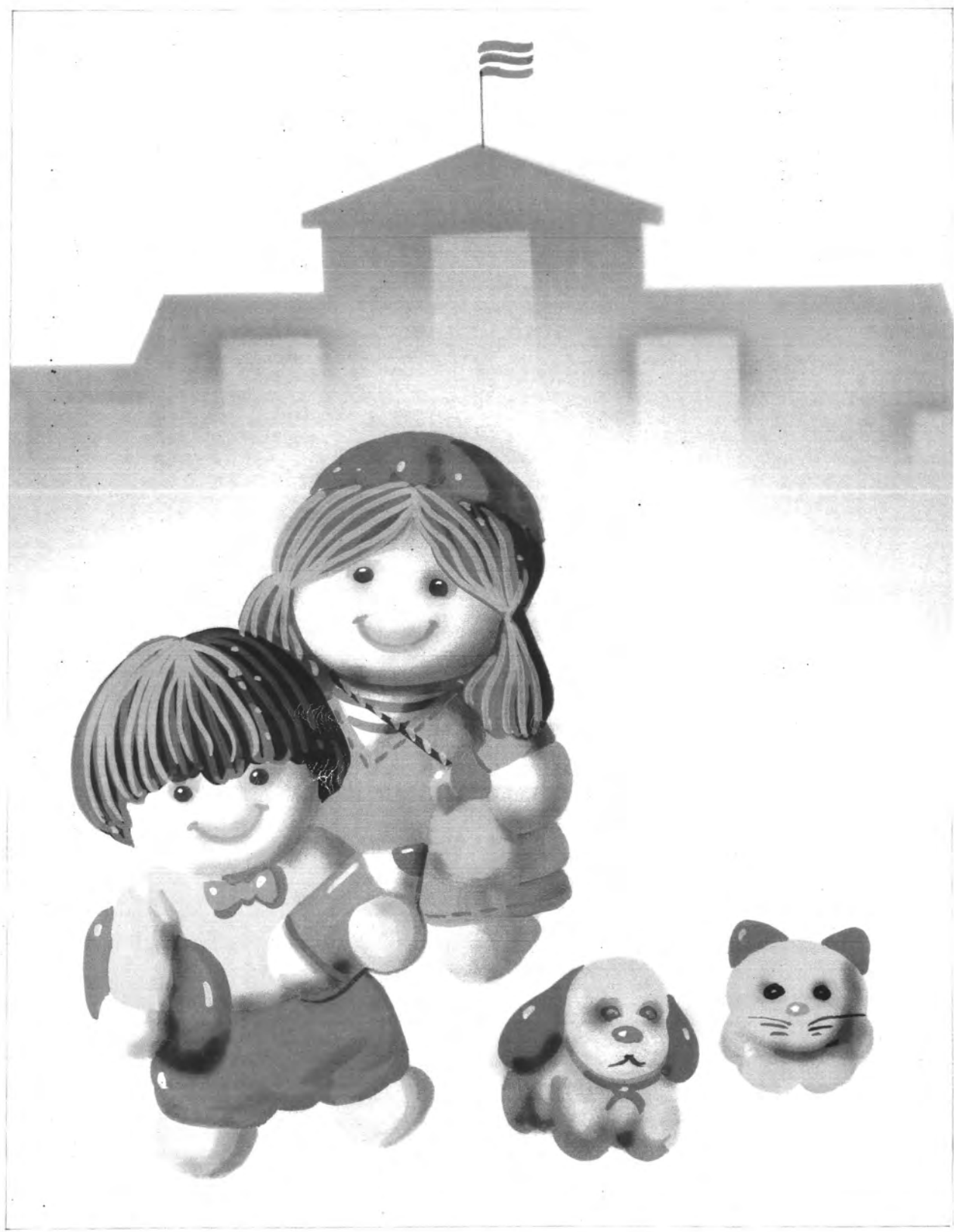
รูปแบบภาพเหมือนจริง ใช้สีวรรณะเย็น องค์ประกอบภาพแบบไม่สมดุลย์ ใช้เขียนโดยผู้กัน