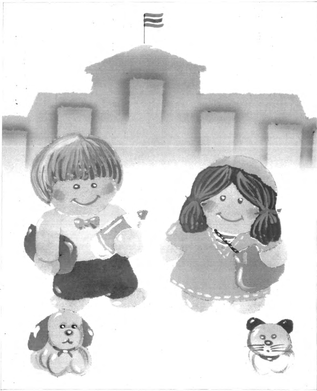
รูปแบบภาพเหมือนจริง ใช้สีวรรณะเย็น องค์ประกอบภาพแบบสมดุลย์ ใช้การปะติด