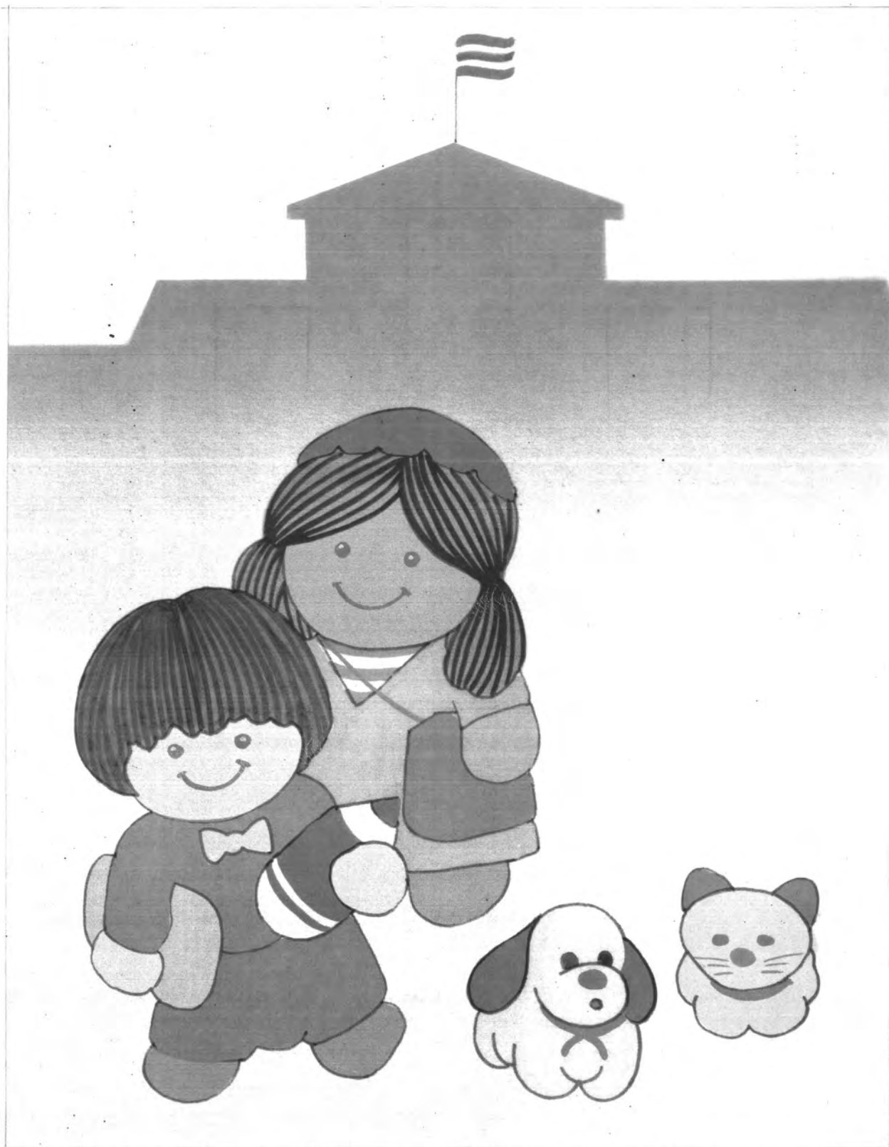
รูปแบบภาพจินตนาการ ใช้สีวรรณะอุ่น องค์ประกอบภาพแบบไม่สมดุลย์ เขียนโดยผู้กัน