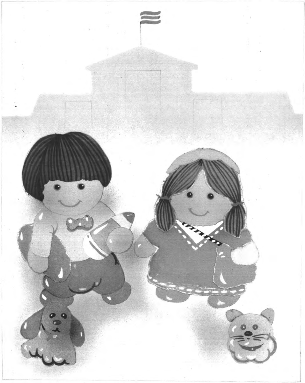
รูปแบบภาพจินตนาการ ใช้สีวรรณะเย็น องค์ประกอบภาพแบบสมดุลย์ ใช้การปะติด