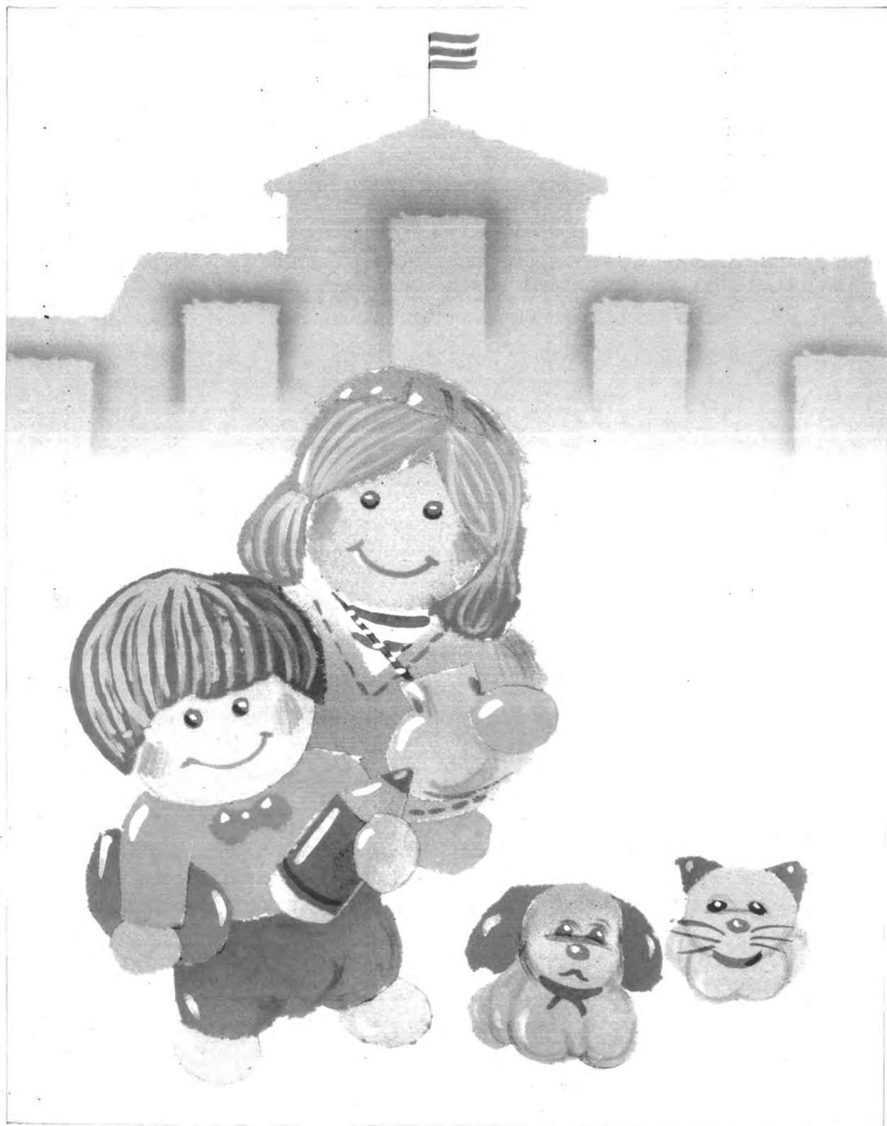
รูปแบบภาพเหมือนจริง ใช้สีวรรณะเย็น องค์ประกอบภาพแบบไม่สมดุลย์ ใช้การปะติด