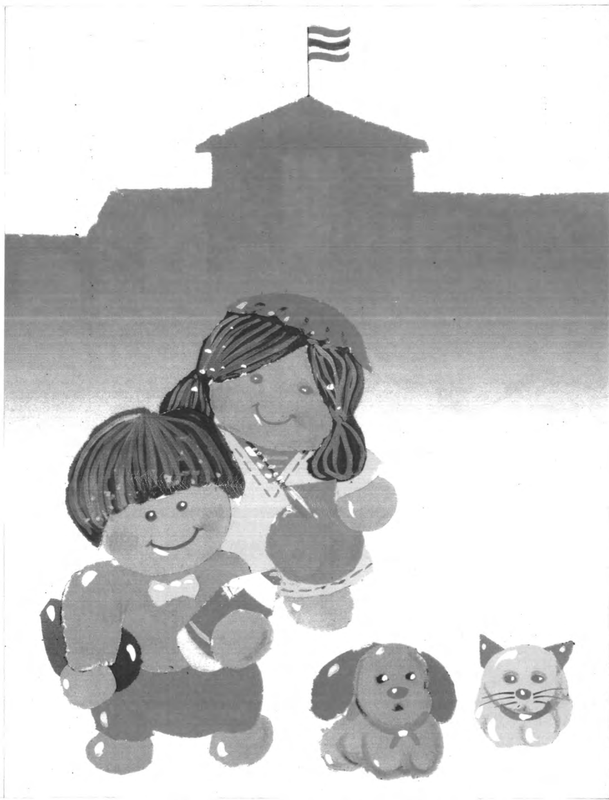
รูปแบบภาพเหมือนจริง ใช้สีวรรณะอุ่น องค์ประกอบภาพแบบไม่สมดุลย์ ใช้การปะติด