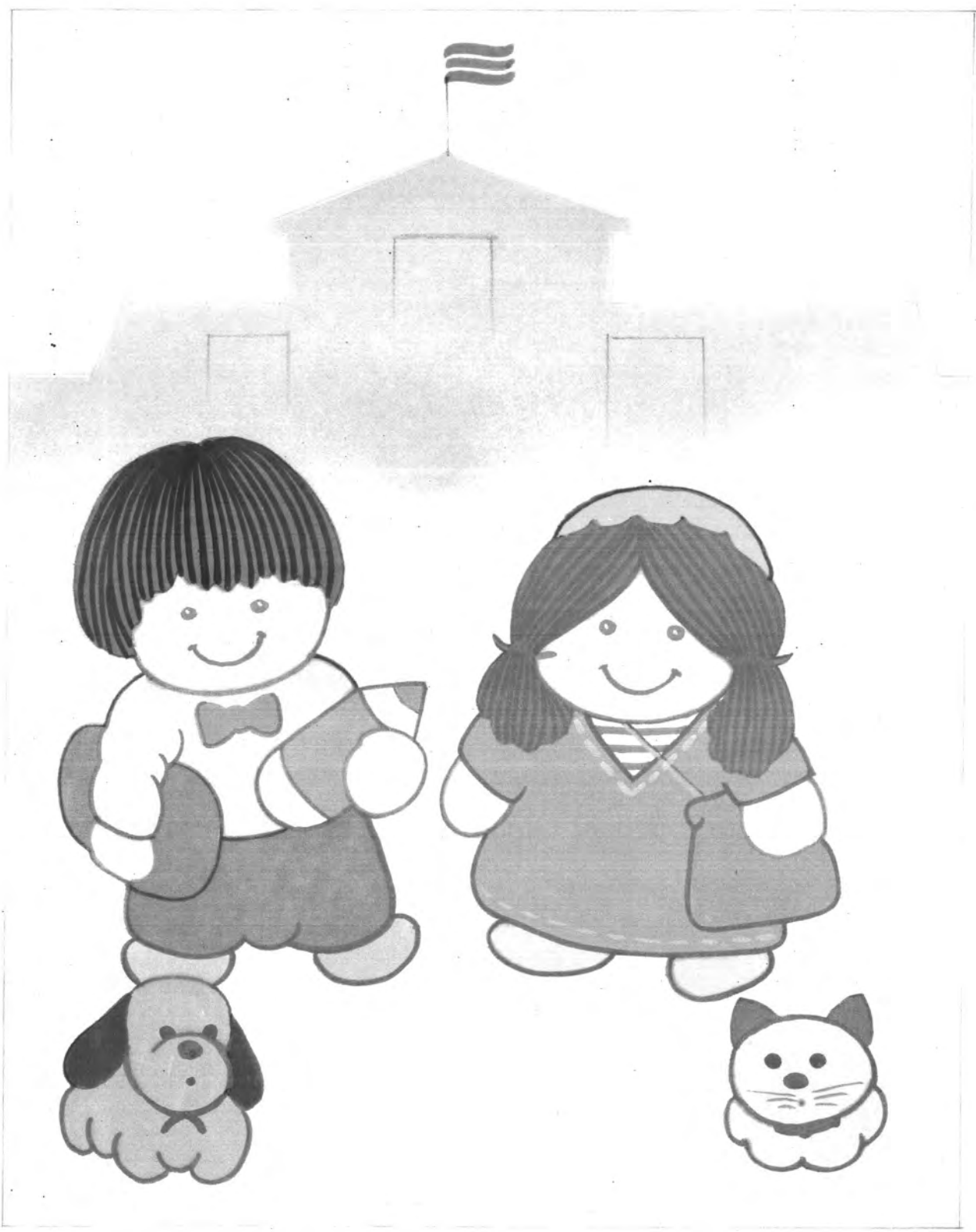
รูปแบบภาพจินตนาการ ใช้สีวรรณะเย็น องค์ประกอบภาพแบบสมดุลย์ เขียนโดยผู้กัน