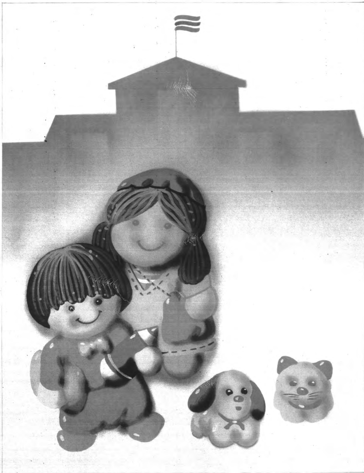
รูปแบบภาพเหมือนจริง ใช้สีวรรณะอุ่น องค์ประกอบภาพแบบไม่สมดุลย์ เขียนโดยผู้กัน