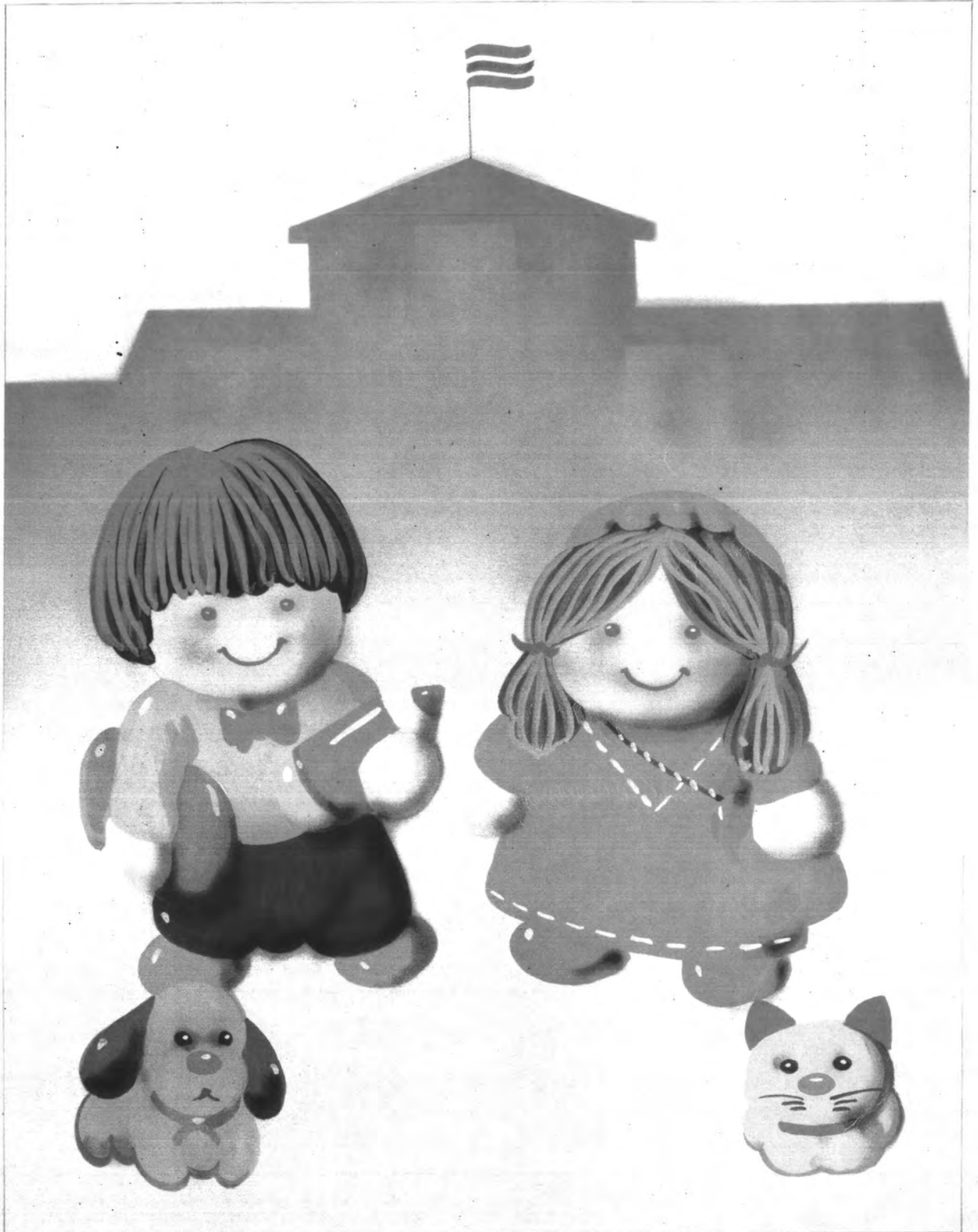
รูปแบบภาพเหมือนจริง ใช้สีวรรณะอุ่น องค์ประกอบภาพแบบสมดุลย์ เขียนโดยผู้กัน