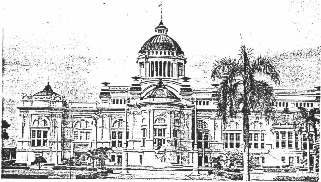
พระที่นั่งอนันตสมาคม

สถานที่ประชุมสภาผู้แทนราษฎรระหว่าง พ.ศ. 2475 - 2516