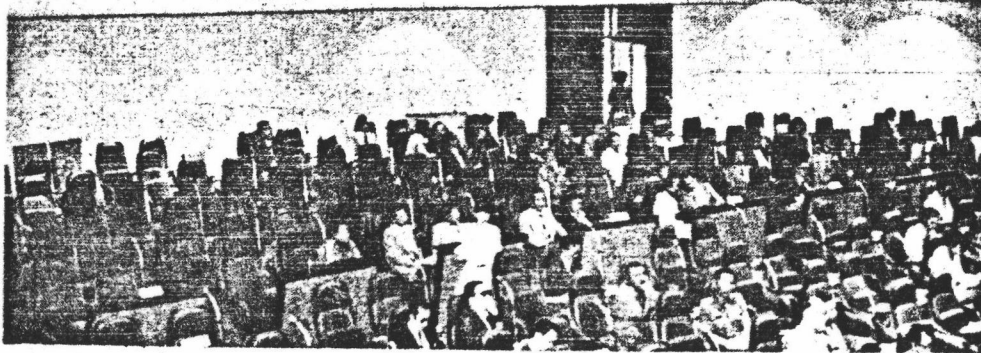
บริเวณห้องประชุมรัฐสภาด้านหลัง เห็นชนชั้นไปค้ำบนเป็นที่นั่งฟังการประชุมของประชาชนภายนอกซึ่งมีระเบียบกำหนดไว้ว่า ผู้ขอเข้าฟังการประชุมต้องเป็นผู้บรรลุนิติภาวะ (ยกเว้นนักเรียนมัธยมศึกษาที่มาเป็นคณะโดยมีอาจารย์ควบคุม) ต้องขออนุญาตล่วงหน้าโดยมีสมาชิกสภารับรอง ต้องไม่ชะโงกหน้าลงมาข้างล่าง ต้องไม่ส่งเสียงพูดคุยกันอีกทีและต้องไม่แสดงอาการเห็นด้วยหรือไม่เห็นด้วยกับการอภิปรายของสมาชิกที่นั่งฟังการประชุมของประชาชนทั่วไปซึ่งได้ประมาณ ๑๑๐ คน