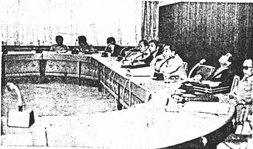
ภายในห้องประชุมกรรมการ ซึ่งอยู่บนชั้น ๑ ของตึกรัฐสภาใหม่ ห้องประชุมกรรมการนั้นมียุ่ ๕ ห้อง ตั้งแต่หมายเลข ๑ ถึงหมายเลข ๕

สถานที่ประชุมสภาผู้แทนราษฎรตั้งแต่ พ.ศ. 2517-ปัจจุบัน