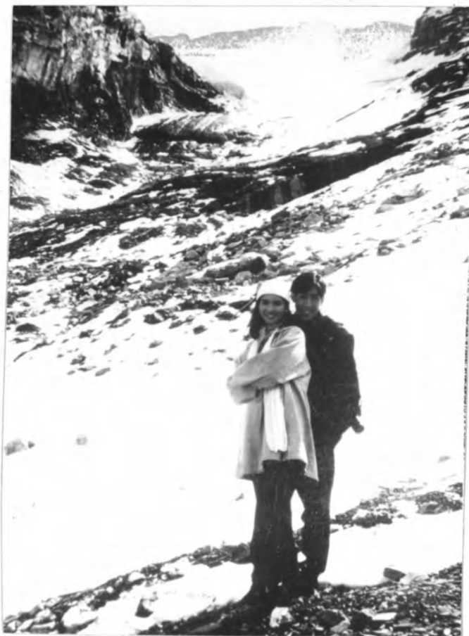
ภาพที่ 15 ถ่ายจากสถานที่จริงเทือกเขาทิวลิป สวิตเซอร์แลนด์ จากเรื่อง "ยามเมื่อลมพัดหวาน"

ในบางครั้งการถ่ายภาพจากสถานที่จริงนั้น เพื่อความสมจริงบางครั้งเทคนิคการถ่ายภาพของผู้ผลิตอาจจะนำกล้องผูกติดกับรถเพื่อจับภาพขณะที่ตัวละคร สนทนากันภายในรถ ซึ่งถ้าตามความเป็นจริงจะต้องสามารถเห็นภาพรอบข้างภายนอกได้ด้วย จึงจำเป็นต้องถ่ายโดยการติดกล้องไปข้างใดข้างหนึ่งแล้วถ่ายภาพออกมา (ดังภาพที่ 17) หรือกรณีที่ต้องได้ภาพที่ใกล้ชิดสมจริงมาก ๆ จะเกินความสามารถของอุปกรณ์ แล้วเช่น ขณะนักแสดงอยู่นั้นบางครั้ง ช่างกล้องก็ต้องลงไปถ่ายในน้ำด้วยก็มี (ดังภาพที่ 18)