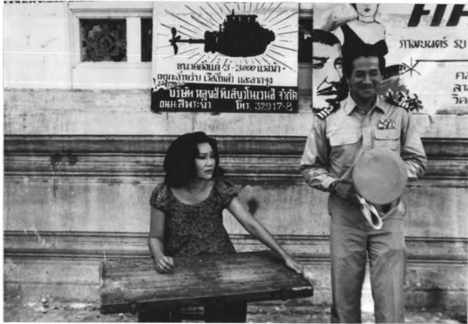
ภาพที่ 16 การถ่ายภาพบริเวณวัดและบอกถึงความเป็นอดีต ซึ่งจัดฉากโดยนางาอุบกรณ์สมัยนั้นมาประกอบด้านหลัง (ป้ายโฆษณา)