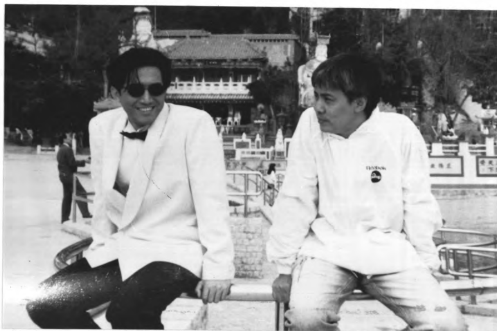
ภาพที่ 14 ถ่ายในสถานที่จริงในต่างประเทศถ่ายที่ฮ่องกง จากเรื่อง "น้ำตาหยดสุดท้าย"