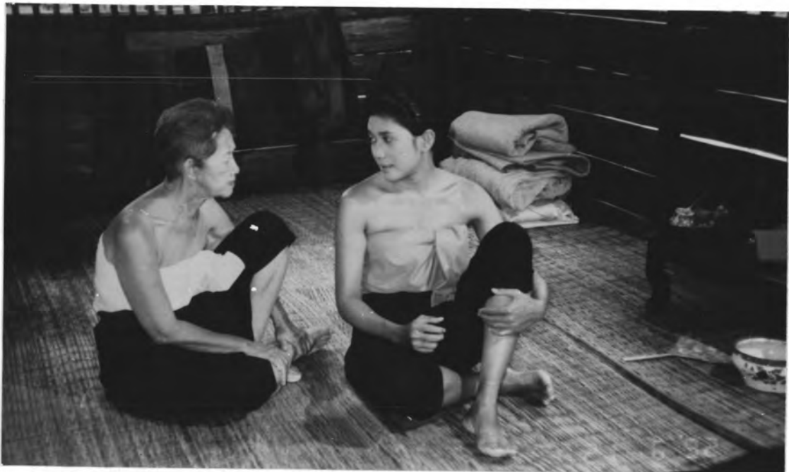
ภาพที่ 11 ฉากที่สร้างขึ้นในบริเวณโรงถ่าย ลาดหลุมแก้ว จากละครโทรทัศน์เรื่อง "นางทาส"