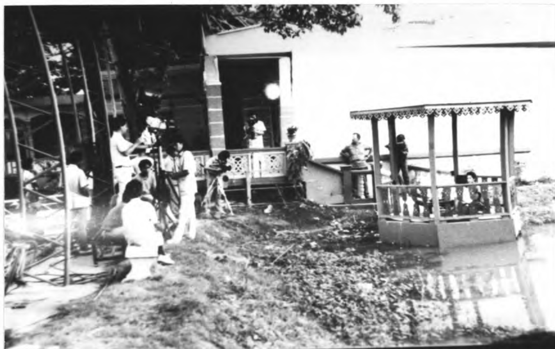
ภาพที่ 9 ฉากบริเวณพระราชวังที่สร้างอยู่บริเวณของสถานี จากละครโทรทัศน์เรื่อง "สี่แผ่นดิน"

... เนื่องจากละครเรื่องนางทาส เน้นละครที่เรียกที่ต้องใช้เวลาในการถ่ายทำมาก เป็นพิเศษเพื่อให้ภาพทุกภาพออกมาสมบูรณ์ในสายตาผู้ชมได้ฉากที่สมจริงสถานที่ถ่ายทำจึงปักหลัก อยู่ที่โรงถ่ายลาดหลุมแก้ว จังหวัดปทุมธานีมีการสร้างฉากทั้งหมดของเรื่องที่นี่ (สยาม สังวรินทร์. สัมภาษณ์, 8 เมษายน 2537.)