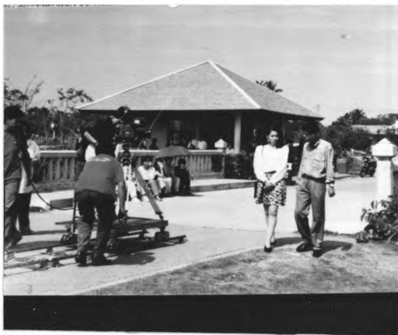
ภาพที่ 12 ถ่ายจากสถานที่จริงคือ สวนหลวง ร.9 เป็นฉากหนึ่งงาน "รักานรอยแค้น"

7.2 สถานที่จริง ในกรณีทำเนื้อเรื่องตัวละครจะต้องอยู่ในสถานที่ต่าง ๆ ในปัจจุบันนิยมใช้ถ่ายทำจากสถานที่จริงหรือใกล้เคียงเลยเพื่อความสะดวกต่อการถ่ายทำ และงบประมาณที่สร้างฉากที่เหมือนนั้นวัสดุและฝีมือของช่างนาฏการบางครั้งก็ลำบากต่อการจัดหา แต่การติดต่อจากสถานที่จริง แล้วเข้าไปถ่ายจะสะดวกกว่า เช่น โรงพยาบาล, วัด, โรงเรียน, ห้างสรรพสินค้า, โรงแรม ฯลฯ ทำให้ได้อารมณ์ในการชมมากกว่าหรืออย่างละครแบบนิทานพื้นบ้าน หรือละครจักร ๆ วงศ์ ๆ นั้นมักจะเลือกวัดสวย ๆ ถ่ายทำเป็นพระราชวังของพระเอกนางเอก เสียส่วนใหญ่ หรือบางครั้งถ้ามีความจำเป็นต้องกล่าวถึงเนื้อเรื่องในต่างจังหวัดต่างประเทศก็จะถ่ายทำกันในสถานที่จริง ๆ เลย มักจะไปสร้างฉากเหมือนในสมัยก่อนแล้ว ยิ่งสภาวะการแข่งขันในการผลิตละครด้วยแล้ว สถานที่ในการถ่ายทำก็เป็นปัจจัย สำคัญที่ผู้ผลิตจะคำนึงถึงอย่างมากแม้ปัจจัยด้านอื่น ๆ เช่น ละครเรื่องวันนี้ที่รอคอย, ละครเรื่องน้ำตาหยดสุดท้ายมีเนื้อเรื่องที่ย่องงกก็จะไปถ่ายที่ย่องงก ละครเรื่องยามเมื่อลมพัดหวานมีการถ่ายที่ยุโรปก็จะไปถ่ายที่ยุโรปจริง ๆ ละครเรื่องเจ้าจอมถ่ายที่อังกฤษ ถ้าไม่มีเนื้อเรื่องในต่างประเทศก็มักจะเก็บภาพสวนสาธารณะ โรงพยาบาล โรงแรมอยู่เสมอ ๆ เป็นต้น