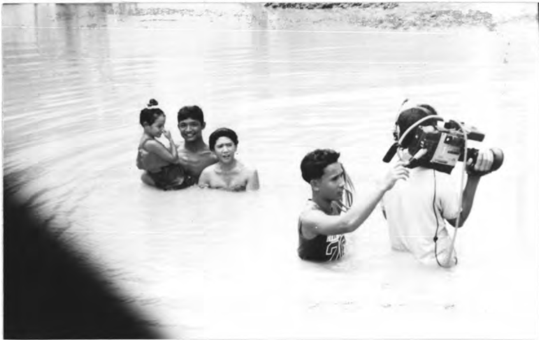
ภาพที่ 18 ภาพขณะถ่ายทำละครเรื่อง "นางทาส"

การสร้างฉากหรือการหาสถานที่จริงเพื่อการถ่ายทำนั้น จึงเป็นปัจจัยสำคัญในกระบวนการผลิตละครโทรทัศน์ เพราะจะเป็นส่วนทำให้ละครโทรทัศน์ที่สื่อออกมา เป็นภาพที่ชัดเจนและสมบูรณ์ที่สุด ว่าในขณะที่ผู้ชมกำลังรับชมอยู่นั้นตัวละครกำลังทำอะไรอยู่ที่ไหน เช่น กำลังสนทนาอยู่ในรถก็สามารถแทนสายตาด้วยภาพเคลื่อนไหว โดยการผูกกล้องไว้ข้างรถที่ตัวละครกำลังสนทนา ก็สามารถทำให้ผู้ชมมีความรู้สึกอยู่ในเหตุการณ์เดียวกับตัวละครหรือแม้แต่ฉากในน้ำ การถ่ายทำก็จำเป็นต้องไปถ่ายในน้ำด้วย หรือแม้แต่การที่ตัวละครนั้นมีกิจกรรมหรือใช้ชีวิตในต่างประเทศก็ต้องมีภาพต่างประเทศจริง ๆ เพื่อความสมจริงตามเนื้อเรื่อง จนบางครั้งกลายเป็นการแข่งขันทางธุรกิจอย่างหนึ่ง