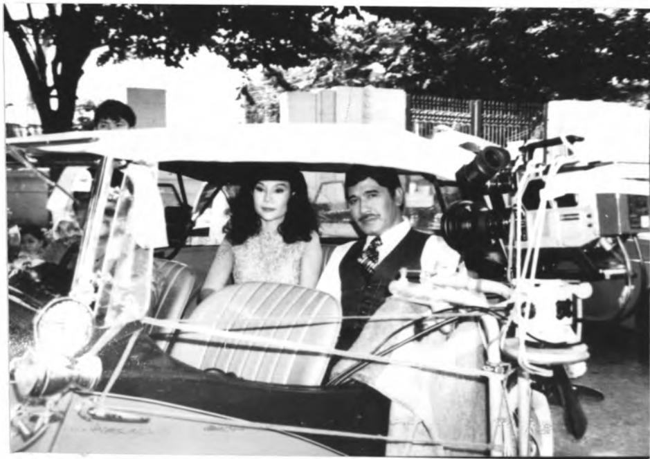
ภาพที่ 17 กล้องทางขวามือจะถ่ายภาพขณะรถแล่นทำให้ภาพสมจริงมากขึ้น "บัลลังก์เมฆ"