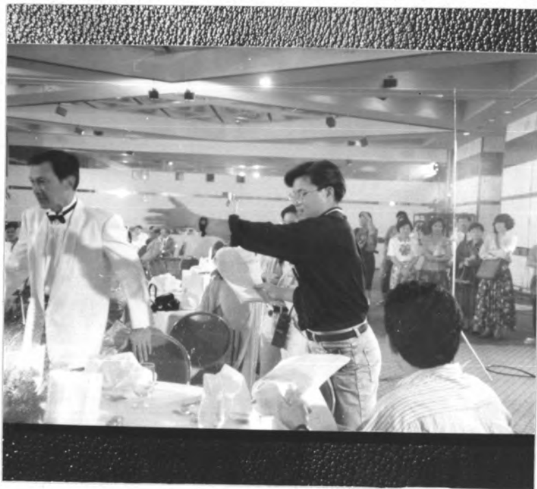
ภาพที่ 13 ฉากงานเลี้ยงในโรงแรมที่ถ่ายจากสถานที่จริง จากเรื่อง "รักในรอยแค้น"