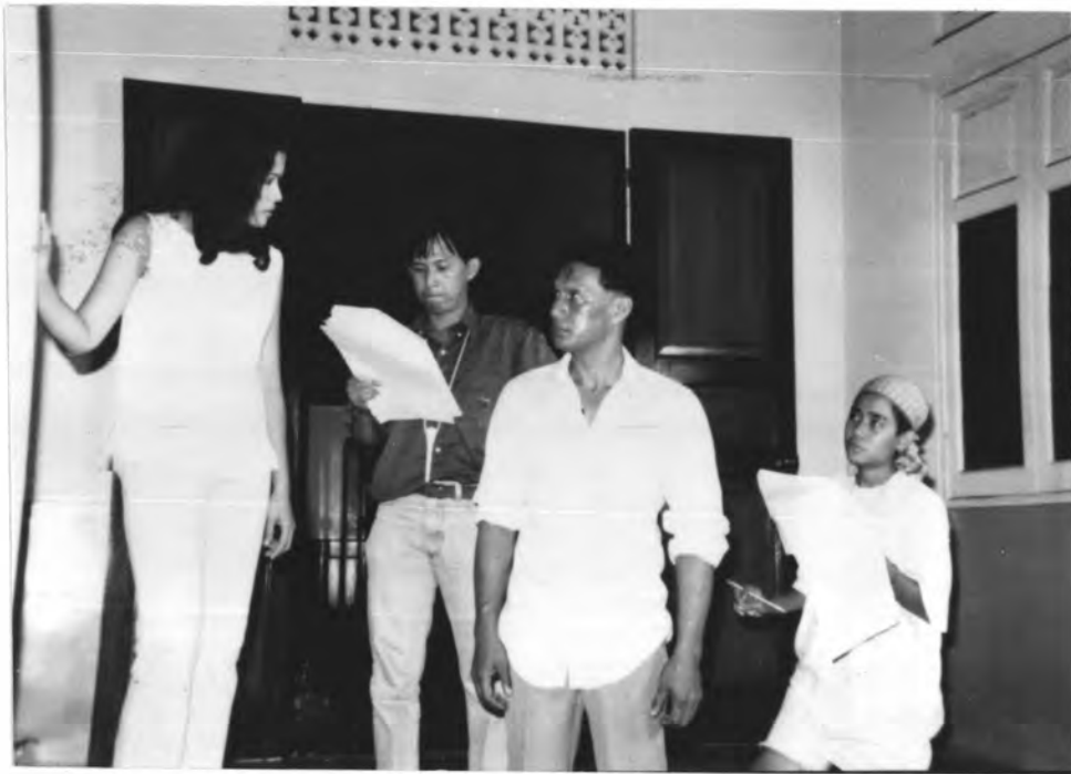
ภาพที่ 3 ผู้กำกับขณะซ้อมการแสดงและซ้อมคิว จากเรื่อง "บัลลังก์เมฆ"

กระบวนการผลิตละครโทรทัศน์นั้น จะประสบความสำเร็จก็ขึ้นอยู่กับขั้นตอนนี้เป็นสำคัญ เพราะละครโทรทัศน์นั้นเป็นเรื่องราวการดำเนินชีวิตของตัวละคร ดังนั้นผู้ที่ถ่ายทอดออกมา คือ ผู้แสดงนั้นจะต้องเป็นบุคคลมีความสามารถ และชำนาญในงานศิลปะการแสดงเป็นอย่างดี คือจะต้องสามารถถ่ายทอดออกมาให้สมจริงและเป็นธรรมชาติที่สุด แม้ว่าจะอยู่ในสถานการณ์ที่มีคนพลุกพล่านก็ตามจะต้องถ่ายทอดออกมาเหมือนกันตัวเองมีชีวิตความเป็นอยู่ของตัวละครเลยทีเดียว ซึ่งจะเป็นการประสานระหว่างผู้แสดงและทีมงานผู้ผลิต โดยเฉพาะผู้กำกับ ยิ่งถ้าละครเรื่องใดมีนักแสดงใหม่ ๆ นั้นหมายถึง ผู้กำกับแต่ละคนก็จะต้องมีวิธีการในการที่จะทำให้นักแสดงนี้แสดงออกมาให้ได้ดีที่สุด