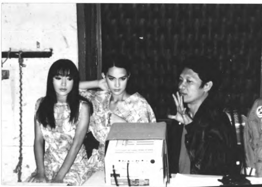
ภาพที่ 4 ภาพผู้กำกับกำลังอธิบายภาพที่เกิดขึ้นให้นักแสดงเข้าใจ ภาพจากเรื่อง "วังน้ำวน"

านสิ่งที่ขัด ๆ เงิน ๆ พอมันออกมาเป็นภาพแล้วมันฟ้อง โน้ตครั้งที่ผู้กำกับจะไปแสดงให้ดู วิธีนี้ไม่ค่อยใช้มันคนละคนกัน การถ่ายทอคมมันต้องมาจากตัวเขา แต่วิธีการเป็นของเราที่จะดึงเอาความสามารถของเขาออกมา ถ้าไม่รีบจนเกินไบนัก เราก็จะยอมเสียเวลาให้นักแสดงเขาดูสิ่งที่เขาถ่ายทอออกไปแล้วก็ค่อย ๆ แก่เขาทีละจุดมันจึงจะได้ผล (ทองขาว ทวีปรังษิณกุล. สัมภาษณ์, 13 กันยายน 2536)