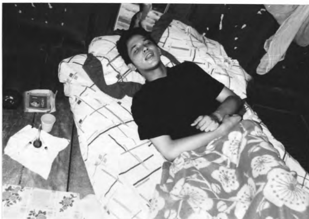
ภาพที่ 5 จากมุมล่างซ้ายแสดงให้เห็นถึงอุปกรณ์ (เซ็นเซอร์ติดยา) ซึ่งอาจทำให้สื่อไปในทางที่แนะ จึงมักจะมีภาพมาบังหรือใช้เทคนิคทำภาพให้ เห็นในส่วนนั้นไม่ชัดเจน

...กรณีที่ กว. เซ็นเซอร์ (Censor) บทบางตอนบางครั้งที่ว่า คนทำเขาก็มีเหตุ และผลในตัวของมันแข็งเชื่อว่าผู้ชมต้องแยกได้ เช่น บทติดยาของของนักแสดง บางครั้งอาจทำให้ ความคาดหวังบางอย่างสูญหายไป เช่น เราต้องการสื่อให้ผู้ชมที่เป็นผู้ปกครอง หรือเยาวชนรู้ว่าการคบเพื่อนหรือการทำให้ความอบอุ่นกับครอบครัวเป็นจุดทำให้เด็กติดยา ซึ่งจะเป็นเหตุมาก่อนว่า สาเหตุของการติดยาเป็นมาอย่างไร แล้วภาพของการติดยานั้นมันทรมานไม่มีความสุข ในแง่ของความสมจริงก็น่าจะเสนอออกมา ฟังว่ามันน่าจะเป็นความรู้ให้พ่อแม่ผู้ปกครองตลอดจนเยาวชนตระหนักในข้อดีมากกว่าจะไปทดลองทำเพื่อความเจ็บปวดทรมานนะ (รัชบุ บุญดวง. สัมภาษณ์, 21 สิงหาคม 2536)