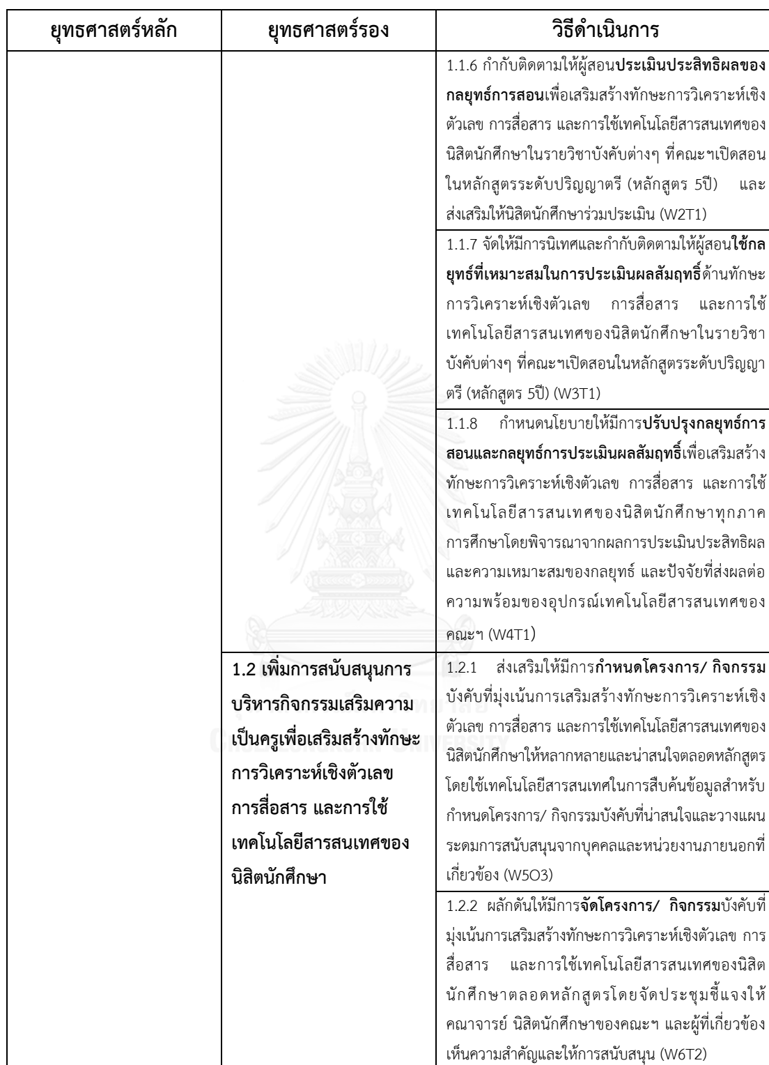
ตารางที่ 42 (ต่อ)