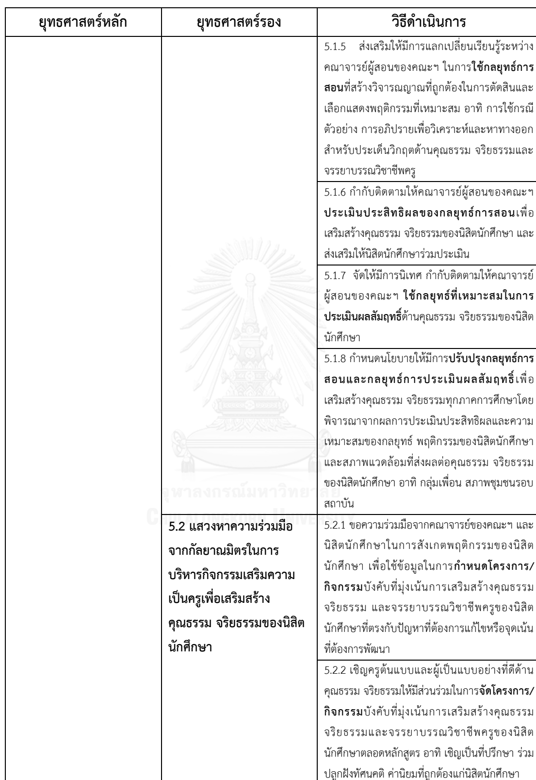
ตารางที่ 44 (ต่อ)