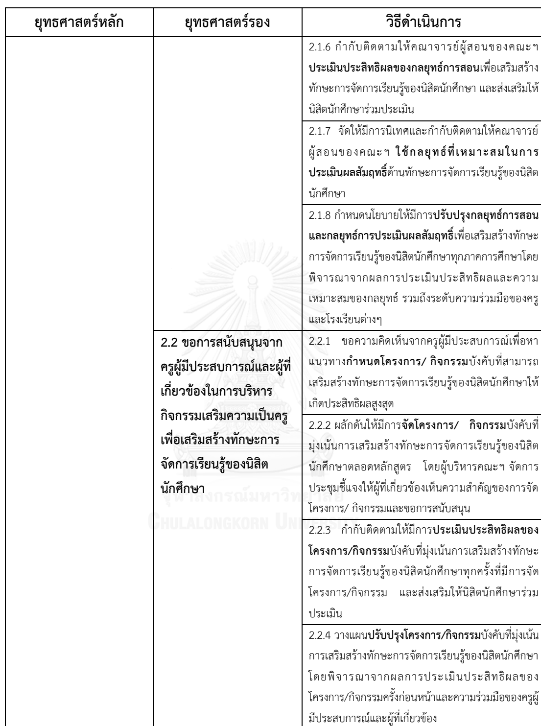
ตารางที่ 44 (ต่อ)