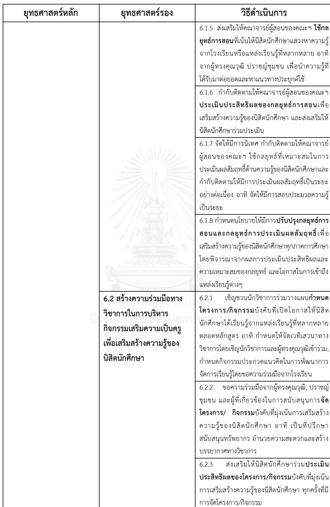
ตารางที่ 44 (ต่อ)