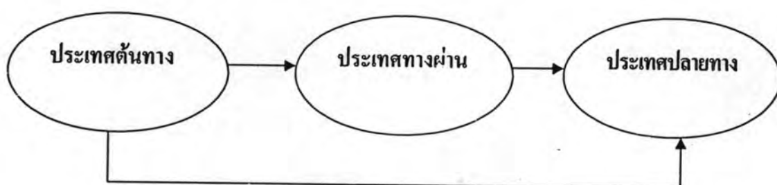
รูปที่ 1 ภาพแสดงความหมายของประเทศต้นทาง ประเทศทางผ่าน และประเทศปลายทาง

ประเทศต้นทาง คือ ประเทศที่เป็นแหล่งที่มาของผู้ที่ตกเป็นเหยื่อของขบวนการค้ามนุษย์