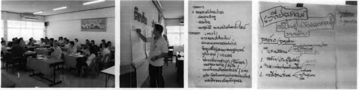
การมีส่วนร่วมของชุมชน โดยการจัดเวทีประชาคมของกลุ่มผู้นำชุมชนและเทศบาลตำบลกระดังงา