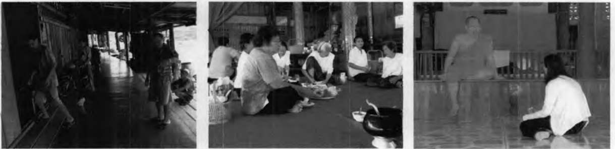
ร่วมปรึกษาหารือกับประชากรในท้องถิ่นในกลุ่มต่างๆ