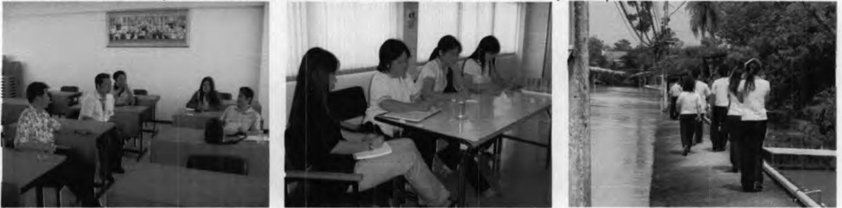
ร่วมปรึกษาหารือกับหน่วยงานท้องถิ่น เทศบาลตำบลกระดังงา และร่วมสำรวจพื้นที่บริเวณบางน้อยนอก