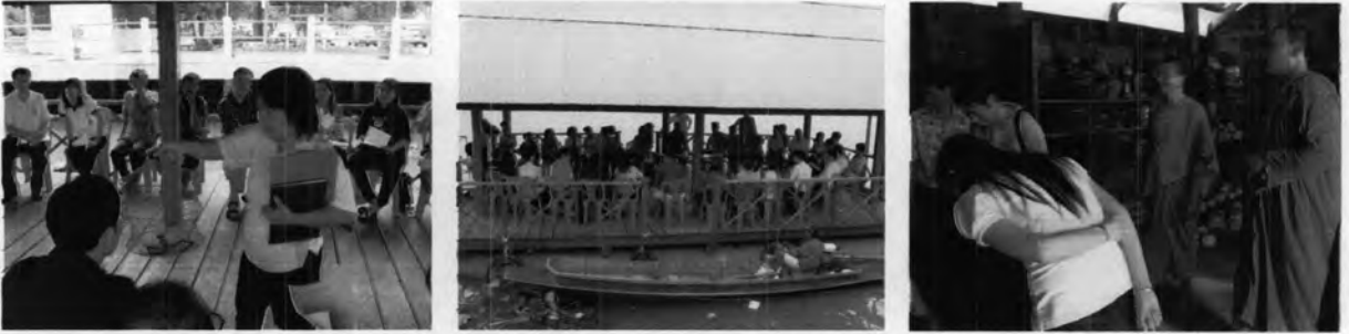
การมีส่วนร่วมของชุมชน โดยการจัดเวทีประชาคมของประชาชนในท้องถิ่นกลุ่มต่างๆและเทศบาลตำบลกระดังงา