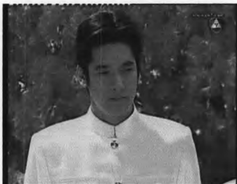
ภาพที่ 7.19 แสดงจากที่ผู้เขียนบทกำหนดให้ท่านเจ้าคุณมองเย็น

-การแสดงออกของท่านเจ้าคุณเมื่อพบกับเย็นครั้งแรกที่ถูกพ่อแม่นำมาขาย ซึ่งผู้เขียนบทกำหนดให้นำเสนอภาพที่ท่านเจ้าคุณมองเย็นเป็นภาพช้า และเขียนกำหนดตัวละครว่า "สีหน้าเจ้าคุณมีแววเหมือนจะพอใจแวบหนึ่ง" ซึ่งแสดงได้ดังภาพที่ 7.19