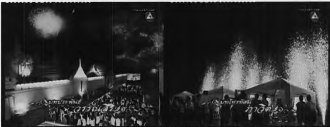
ภาพที่ 7.28 แสดงจากเปิดเรื่อง

จากการศึกษาพบว่าผู้เขียนบทมีการใช้รหัสเชิงสุนทรียะ(Aesthetic code) มาเข้ารหัสเพื่อช่วยในการนำเสนอเรื่องราวให้เกิดความสนุกสนาน มีสีสัน ตรงตามอารมณ์ของโทนเรื่อง ซึ่งจากการศึกษาตัวบทละครโทรทัศน์พบว่า ผู้เขียนบทมีสไตล์การเขียน-การดำเนินเรื่องค่อนข้างเร็ว และสามารถนำเสนอเนื้อหาในประเด็นต่างๆ ได้อย่างน่าสนใจ ยกตัวอย่างเช่น จากเปิดเรื่อง ดังแสดงในภาพที่ 7.28