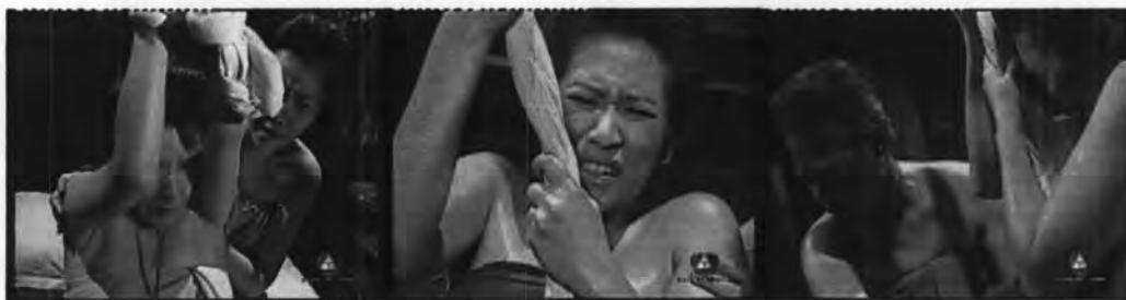
ภาพที่ 7.14 แสดงการคลอคลุกโดยหมอต้าแย