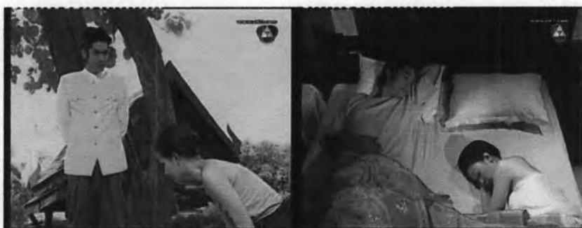
ภาพที่ 7.24 การแสดงออกของเย็นต่อพระยาสิทธิ์โยธิน

สำหรับการแสดงออกของเย็นต่อพระยาสิทธิ์โยธินนั้น จะเป็นการแสดงออกของเย็นในฐานะเมียบ่าว คำพูดและการแสดงออกต่างๆ แสดงให้เห็นถึงความเจ็บมเนื้อเจ็บตัว และจงรักภักดีต่อเจ้านาย เช่น เย็นจะนอนต่ำกว่าพระยาสิทธิ์โยธินเสมอ และเมื่อท่านเจ้าคุณจะไปไหน เย็นทำความเคารพโดยการก้มกราบทุกครั้ง ซึ่งแสดงดังภาพ 7.24