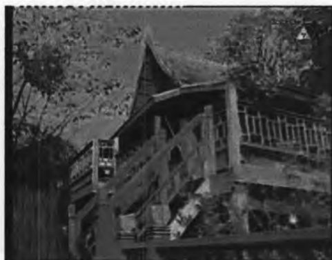
ภาพที่ 7.9 แสดงจากเรือนบุญมี

บทละครตอนที่ 2 ได้นำเสนอเรื่องราวที่สาตีไปรับบุญมีมาอยู่ที่บ้าน และได้กำหนดให้สาตีพาบุญมีไปที่ “เรือนเล็ก หรือน่าจะเรียกว่าห้องเล็กๆ มากกว่า (อยู่เยื้องๆ เรือนสาตี)” ซึ่งเรือนนี้มีขนาดเล็กกว่าเรือนของสาตี แสดงถึงฐานะความเป็นอยู่ของเจ้าของเรือน คือ บุญมี ว่าอยู่ต่ำกว่าสาตี ซึ่งทำให้บุญมีไม่พอใจ และตัดสินใจหาเรื่องย้ายไปอยู่กับสาตีเพื่อความเท่าเทียม