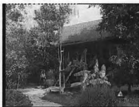
ภาพที่ 7.10 แสดงจากบ้านเย็น

เย็นเป็นคนบ้านนอก เป็นลูกชานาที่ยากจน จึงอาศัยอยู่ในกระท่อมเก่าๆ หลังเล็ก ซึ่งเย็นและคนในครอบครัวล้วนมีวิถีการดำเนินชีวิตแบบคนต่างจังหวัด คือ ทำนา ใช้ชีวิตอยู่กับธรรมชาติ ดังแสดงในภาพ 7.11