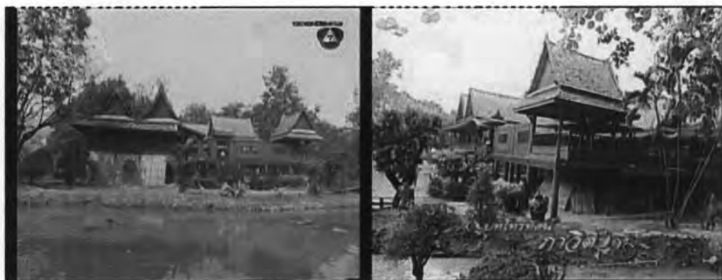
ภาพที่ 7.1 แสดงเรือนของคุณหญิงแย้ม

-บ้านเรือนไทยของคุณหญิงแย้ม ดังแสดงในภาพ 7.1