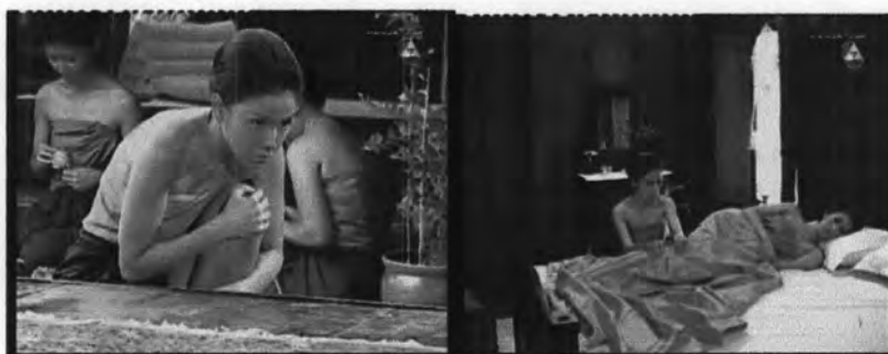
ภาพที่ 7.23 การแสดงออกของเย็นเมื่อเป็นทาส

สำหรับการแสดงออกของเย็นต่อพระยาสิทธิ์โยธินนั้น จะเป็นการแสดงออกของเย็นในฐานะเมียบ่าว คำพูดและการแสดงออกต่างๆ แสดงให้เห็นถึงความเจ็บมเนื้อเจ็บตัว และจงรักภักดีต่อเจ้านาย เช่น เย็นจะนอนต่ำกว่าพระยาสิทธิ์โยธินเสมอ และเมื่อท่านเจ้าคุณจะไปไหน เย็นทำความเคารพโดยการก้มกราบทุกครั้ง ซึ่งแสดงดังภาพ 7.24