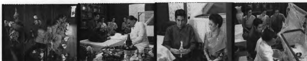
ภาพที่ 7.16 ธีทำขวัญเดือนให้กับหนูแดง

-พิธีทำขวัญเดือนให้กับหนูแดง ดังภาพที่ 7.16