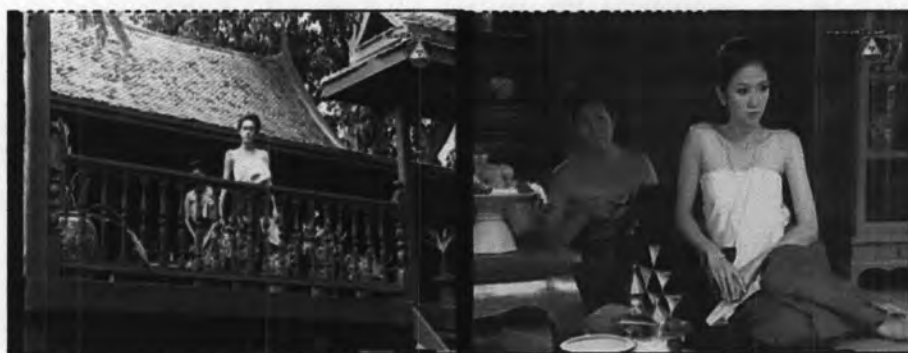
ภาพที่ 7.7 แสดงจากเรือนสาลี

สาลีเป็นชนชั้นเจ้านายที่มีปาวไพร่คอยดูแล บ้านของสาลีเป็นเรือนไทยที่มีขนาดเล็กกว่าเรือนหมู่ของคุณหญิงยิ้ม แสดงถึงฐานะของสาลีที่ด้อยกว่าคุณหญิงยิ้มได้เป็นอย่างดี ซึ่งสาลีนั้นไม่พอใจในฐานะตนเอง ต้องการมีชีวิตความเป็นอยู่ที่ปราณีตเทียบเท่าแยม เห็นได้ชัดจากฉากที่สาลีหงุดหงิดใจ โวยวายที่ปาวไพร่ไม่ได้แกะสลักผัก, ผลไม้มาให้ตน ดังแสดงได้ดังภาพที่ 7.8