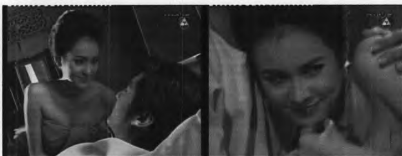
ภาพที่ 7.25 แสดงการแสดงออกของบุญมี

ผู้เขียนบทใช้ Representational code มาเข้ารหัสเพื่อนำเสนอตัวละคร“บุญมี” ให้เป็นผู้หญิงที่มีจริตจก้าน ชอบชอกแซกสอดรู้เรื่องชาวบ้าน การแสดงออกต่างๆของบุญมีทั้งเรื่องจึงมักจะเกี่ยวกับการพูดให้ร้ายตัวละครอื่น ซึ่งลักษณะท่าทางของบุญมี แสดงได้ดังภาพ 7.25