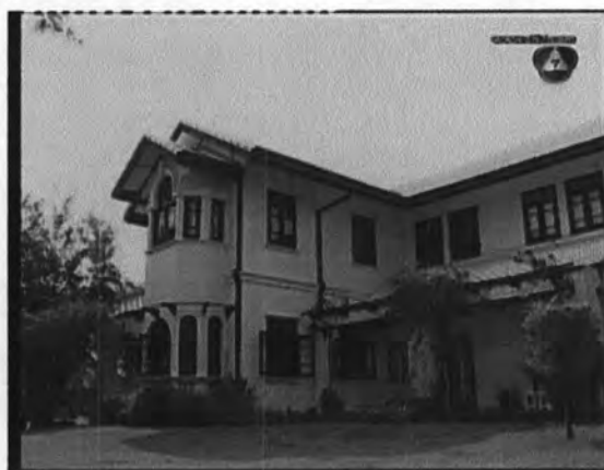
ภาพที่ 7.5 แสดงจากบ้านของคุณหญิงยิ้ม

ผู้เขียนบทได้กำหนดให้บ้านของคุณหญิงยิ้ม เป็นตึกปูน สร้างขึ้นตามแบบบ้านของตะวันตกเพื่อให้เหมาะสมกับการเป็นคนสมัยใหม่ เปิดรับความเจริญจากชาติตะวันตกของคุณหญิงยิ้ม และพระยาอภัยภทรณฤทธิ์ที่เป็นเจ้าของบ้าน โดยขนาดของบ้านที่ใหญ่โต และมีบริเวณโดยรอบสามารถแสดงถึงความมีฐานะของเจ้าของบ้าน ดังนั้น วิถีชีวิตของตัวละครชนชั้นเจ้านายที่ปรากฏในบ้านจึงเป็นวิถีชีวิตของชนชั้นสูง ซึ่งแน่นอนว่าต้องมีความสมัยใหม่แฝงอยู่ด้วยเช่นกัน ซึ่งกิจกรรม,วิถีการดำเนินชีวิตของตัวละคร สามารถประมวลได้ดังภาพต่างๆเหล่านี้