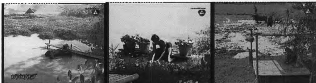
ภาพที่ 7.11 แสดงวิถีชีวิตคนต่างจังหวัด

จะเห็นได้ว่า ฉากต่างๆที่ปรากฏในเรื่อง สามารถแสดงถึงวัฒนธรรมในการดำรงชีวิต วิถีชีวิตของผู้คนในสมัยนั้นได้เป็นอย่างดี สามารถทำให้ผู้ชมเชื่อได้ว่ากำลังนำเสนอเรื่องราวชีวิตผู้คนในสมัยก่อน นอกจากนี้ ผู้เขียนบทยังมีการใช้รหัสวัฒนธรรมมากำหนดเรื่องทัศนคติ,ความเชื่อ ให้กับตัวละคร ไม่ว่าจะเป็นความเชื่อเรื่องการบูชาคุณหมอตำแย , การเสี่ยงทายก่อนคลอด, ความเชื่อเรื่องคำสาบาน รวมถึงใช้รหัสวัฒนธรรมนี้มากำหนดการนำเสนอพิธีกรรมต่างๆ ที่ปรากฏในเรื่อง ได้แก่