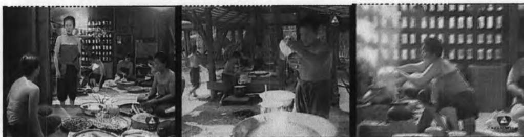
ภาพที่ 7.4 แสดงกิจกรรมของบ่าวไพร่ในโรงครัว