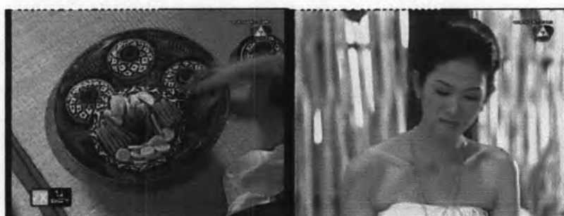
ภาพที่ 7.8 แสดงภาพผักที่ไม่ได้แกะสลักที่ทำให้สาลีหงุดหงิดใจ

สาลีเป็นชนชั้นเจ้านายที่มีปาวไพร่คอยดูแล บ้านของสาลีเป็นเรือนไทยที่มีขนาดเล็กกว่าเรือนหมู่ของคุณหญิงยิ้ม แสดงถึงฐานะของสาลีที่ด้อยกว่าคุณหญิงยิ้มได้เป็นอย่างดี ซึ่งสาลีนั้นไม่พอใจในฐานะตนเอง ต้องการมีชีวิตความเป็นอยู่ที่ปราณีตเทียบเท่าแยม เห็นได้ชัดจากฉากที่สาลีหงุดหงิดใจ โวยวายที่ปาวไพร่ไม่ได้แกะสลักผัก, ผลไม้มาให้ตน ดังแสดงได้ดังภาพที่ 7.8