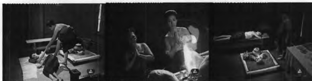
ภาพที่ 7.15 แสดงพิธีอยู่ไฟหลังคลอด

-พิธีทำขวัญเดือนให้กับหนูแดง ดังภาพที่ 7.16