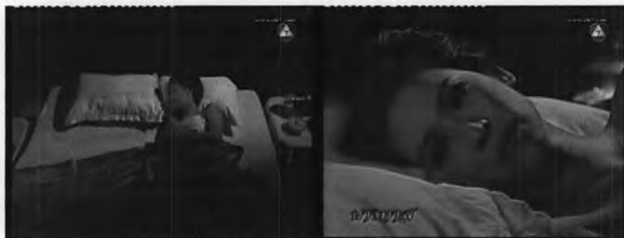
ภาพที่ 7.27 แสดงอารมณ์เศร้าของแย้ม

- ฉากที่นำเสนอแย้มนอกร้องให้เพียงลำพัง เพื่อหมายถึง แย้มเศร้าใจที่ท่านเจ้าคุณไม่ได้อยู่เคียงข้าง เป็นความทุกข์ใจของภรรยาหลวงที่ไม่สามารถบอกใครได้ ดังภาพ 7.27