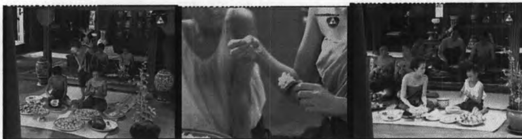
ภาพที่ 7.3 แสดงกิจกรรมของบ่าวไพร่บนเรือน