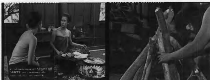
ภาพที่ 7.13 แสดงพิธีการเตรียมการก่อนคลอดลูก

-พิธีการเตรียมการก่อนคลอดลูก ดังแสดงในภาพ 7.13