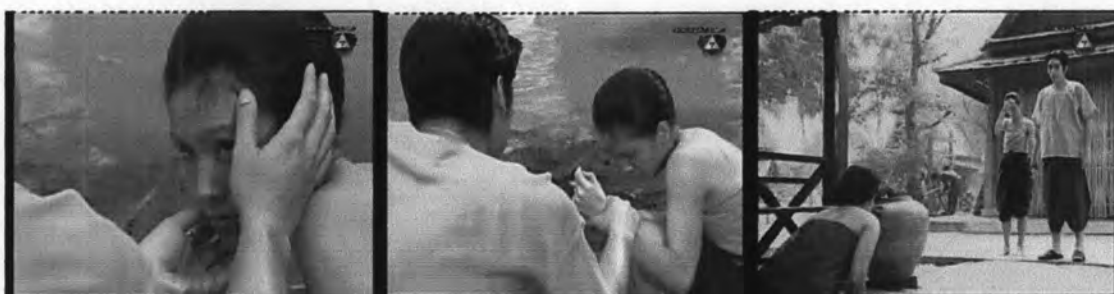
ภาพที่ 7.20 แสดงความเป็นคนเจ้าชู้ของท่านเจ้าคุณต่อเย็น

-ท่านเจ้าคุณแสดงออกถึงความเจ้าชู้จากการถูกเนื้อต้องตัวเย็น และได้จูบพาเย็นไปส่งยายฟักเมื่อครั้งเย็นหัวแตก แสดงได้ดังภาพ 7.20