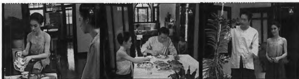
ภาพที่ 7.6 แสดงวิถีการดำเนินชีวิตของบุคคลในบ้าน

จะเห็นได้ว่า ผู้เขียนบทกำหนดให้ตัวละครที่เปิดรับวัฒนธรรมตะวันตกอย่าง คุณหญิงยิ้มและพระยาอภัยรณฤทธิ์มีการดำเนินชีวิตในรูปแบบสมัยใหม่ คือ นั่งโต๊ะรับประทานอาหาร, ใช้ช้อน-ส้อม และมีความสนใจในการปลูกกล้วยไม้สายพันธุ์ฝรั่ง ถือว่ามีการใช้รหัสวัฒนธรรมมากำหนดวิถีชีวิตความเป็นอยู่ของตัวละครอย่างเหมาะสม