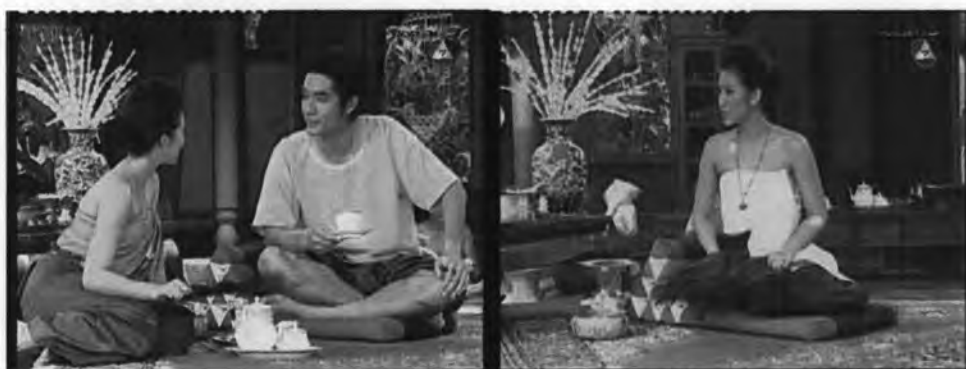
ภาพที่ 7.2 แสดงวิถีความเป็นอยู่ของคนชั้นเจ้านาย

บ้านทรงไทยของแย้ม ถือว่าเข้ากับยุคสมัยของเนื้อเรื่อง จะเห็นได้ว่า เรือนของคุณหญิงแย้มมีลักษณะเป็นบ้านทรงไทยขนาดใหญ่ เป็นเรือนหมู่ สื่อความหมายได้ว่าเป็นที่อยู่อาศัยของคนมีฐานะ มีวิถีชีวิตความเป็นอยู่อย่างชนชั้นสูง การดำเนินชีวิตของตัวละครก็ต้องเป็นอย่างชนชั้นสูงด้วยเช่นกัน ซึ่งผู้เขียนบทก็ได้เขียนบทละครให้แย้มเป็นชนชั้นเจ้านาย มีป่าวไพร่บริวารแวดล้อมมากมาย , มีวัฒนธรรมการกินอยู่แบบชนชั้นสูง อาหารการกินปราณีต , มีทาสคอยรับใช้ , กิจกรรมที่เกิดขึ้นในบ้านนี้ก็มักจะเป็นกิจกรรมของผู้ดี ต้องใช้ความละเอียดปราณีตสูง อย่างการร้อยมาลัย , แกะสลักผักผลไม้ เจ้าของบ้านมีอำนาจในการสั่งคนใช้ให้ทำสิ่งที่ตนต้องการ ซึ่งแสดงได้ดังภาพต่างๆ ดังนี้