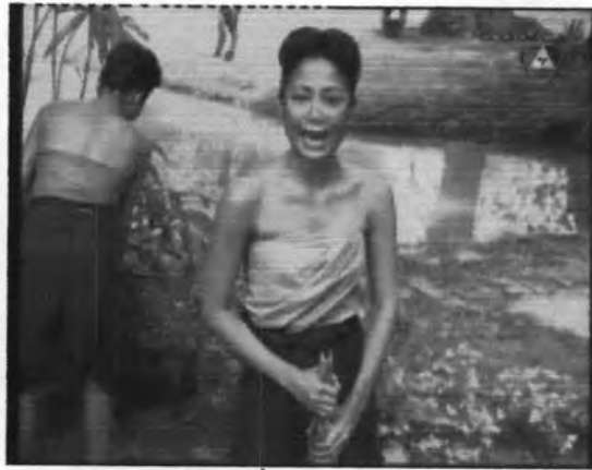
ภาพที่ 5.12 ตัวละครม้วน