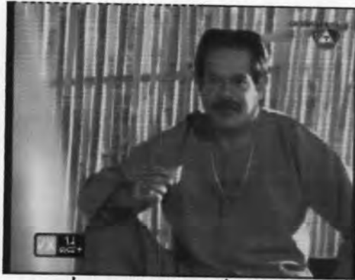
ภาพที่ 5.16 ตัวละครเจมีนไวยวรรณา

ตัวละครนี้มีปรากฏไม่มาก จึงไม่ปรากฏชื่อนักแสดง ซึ่งนักแสดงที่มารับบทมีลักษณะท่าทาง ดังภาพที่ 5.16