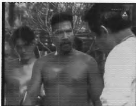
ภาพที่ 5.30 ตัวละครสม

ตัวละครนี้ถือเป็นตัวละครประกอบ จึงไม่ปรากฏชื่อนักแสดง ซึ่งภาพที่ 5.30 แสดงถึงลักษณะหน้าตาของนักแสดงที่รับบท สม