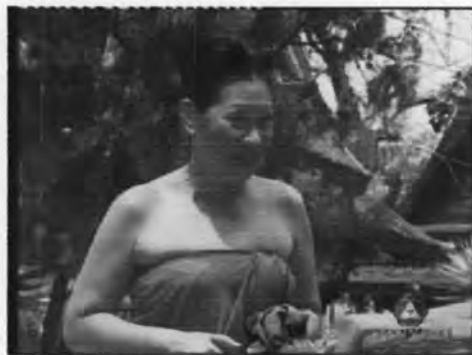
ภาพที่ 5.23 แสดงตัวละครยายผาด

ตัวละครนี้ถือเป็นตัวละครประกอบ จึงไม่ปรากฏชื่อนักแสดง แต่ปรากฏนักแสดง ดังภาพที่ 5.23