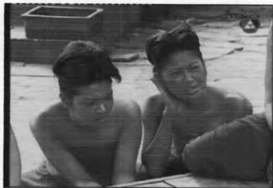
ภาพที่ 5.13 ตัวละครม้วนและพิศ

เป็นเพียงตัวประกอบในเรื่องจึงไม่ปรากฏชื่อนักแสดง ซึ่งภาพตัวละครม้วน และพิศ แสดงในภาพที่ 5.13