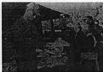
ภาพที่ ๔.๑: การเสด็จ เยี่ยมราษฎรชาวเขา ๖๙

อาจเข้าใจนัยที่เกี่ยวข้องกับการต่อต้านคอมมิวนิสต์ของการเสด็จ พื้นที่ชาวเขาได้มากขึ้น หากพิจารณาสัญลักษณ์บางอย่างที่ปรากฏในการเสด็จ แต่ละครั้ง