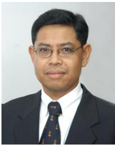
ศ.ดร.จรัส สุวรรณมาลา