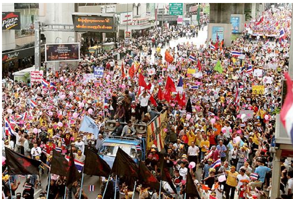
ภาพที่ 1 จุฬาร่วมกู้ชาติ นำขบวนชุดชมพูสมทบกลุ่มพันธมิตรฯ

การเคลื่อนไหวครั้งที่สองที่จุฬาลงกรณ์มหาวิทยาลัยกลับมาเคลื่อนไหวทางการเมืองอีกครั้ง พัฒนาการก่อนหน้านี้การเคลื่อนไหวของเครือข่ายจุฬาฯ แยกไปหลังรัฐประหาร 2549 ไม่มีกิจกรรมใด แต่ก็ยังคงติดต่อสื่อสารกันผ่านกรู๊ปอีเมล เครือข่ายจุฬาฯ กลับมาเคลื่อนไหวอีกครั้งในช่วงปี 2552 – 2553 11 ในช่วงการชุมนุมของคนเสื้อแดงบริเวณราชดำเนิน แต่การเคลื่อนไหวครั้งนี้อาจารย์ตุลย์ซึ่งเป็นส่วนหนึ่งของกลุ่มจุฬาฯ เชิดชูคุณธรรมได้แยกออกมาเคลื่อนไหวในนามกลุ่มคนเสื้อหลากสี และกลุ่มศิษย์เก่าจุฬาฯ เริ่มมีการนัดประชุมศิษย์เก่าที่สนใจในทางการเมืองมาพบเพื่อวางแผนในการเคลื่อนไหว โดยตัดสินใจจะใส่เสื้อชมพูเป็นสัญลักษณ์ในการเคลื่อนไหว โดยนัดกันที่บริเวณพระบรมรูป 2 รัชกาล แต่นายจตุพร พรหมพันธุ์แกนนำคนเสื้อแดงประกาศบนเวทีถึงการพยายามเคลื่อนไหวของคนจุฬาฯ ทำให้การเคลื่อนไหวที่วางแผนไว้ถูกทำนอกรบตีและนายกสภามหาวิทยาลัยขอให้เลื่อนกิจกรรมออกไปก่อน (ตุลย์ สิทธิสมวงศ์, 2560: สัมภาษณ์) ซึ่งภายหลังอธิการบดีจุฬาลงกรณ์มหาวิทยาลัย ศ.นพ.ภิรมย์ กมลรัตนกุล ประกาศหยุดวันที่ 1 – 4 เมษายน 2553 (คมชัดลึก, 2549: ออนไลน์) เนื่องจากสถานการณ์ที่อาจกระทบต่อความปลอดภัยของนิสิต บุคลากร ตลอดจนทรัพย์สินของทางราชการ ในช่วงเวลาดังกล่าวกลุ่มจุฬาฯจึงเลื่อนมาเคลื่อนไหวในช่วงที่จุฬาฯ ปิดทำการ (จ่อโลก เศรษฐกิจ, 2549: ออนไลน์) แต่ก็มีแกนนำบางท่านที่แยกตัวอยู่ฝั่งตรงข้ามกับเครือข่ายจุฬาฯ เนื่องจากไม่เห็นด้วยกับรัฐประหาร เช่น รศ.ดร.สุดา รังกุพันธุ์