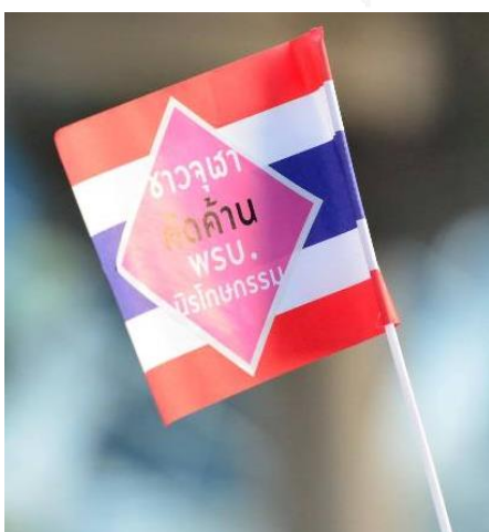
ภาพที่ 2 สติ๊กเกอร์ ชาวจุฬาฯ คัดค้าน พ.ร.บ. นิรโทษกรรม

กิจกรรมแรกของจุฬาประชาคมคือ การทำสติ๊กเกอร์ “ชาวจุฬาฯ คัดค้าน พ.ร.บ. นิรโทษกรรม” และป้ายผ้าที่ใช้ร่วมเดินขบวนของจุฬาฯ ครั้งแรก ในวันที่ 5 พฤศจิกายน 2556 เพื่อแสดงเจตนารมณ์คัดค้าน พ.ร.บ. นิรโทษกรรม