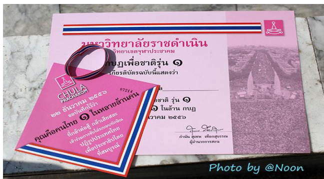
ภาพที่ 3 เกียรติบัตรและสติ๊กเกอร์กลุ่มจุฬาประชาคม

กิจกรรมหลังจากการแสดงเชิงสัญลักษณ์ในวันที่ 5 พฤศจิกายน 2556 ก็จะเป็นกิจกรรมที่ระดมทุนทรัพย์สินสนับสนุนการเคลื่อนไหวของกลุ่มเคลื่อนไหวหลักก็คือ กลุ่ม กปปส. ในวันที่ 22 ธันวาคม 2556 บริเวณหน้าหอศิลป์ กรุงเทพฯ ได้มีการออก “เกียรติบัตรกฎเพื่อชาติรุ่น 1” และ “สติ๊กเกอร์คุณคือคนไทย 1 ในหลายล้านคน” จำหน่ายคู่กันในราคาชุดละ 20 บาทพร้อมสายรัดสีธงชาติ ยอดขายเพียงวันเดียวคือ 4 แสนบาท