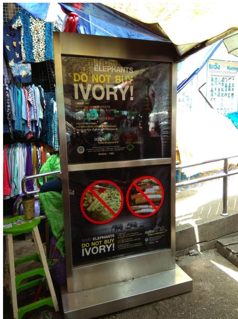
รูปภาพที่ 5 ป้ายประชาสัมพันธ์การให้ความรู้เกี่ยวกับการอนุรักษ์และลดการบริโภคงาช้าง ณ สุขา แห่งที่ 2 ตลาดนัดสวนจตุจักร กรุงเทพฯ