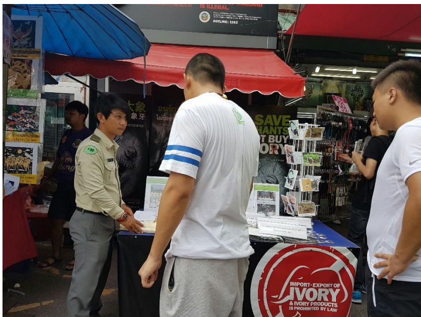
รูปภาพที่ 2 การประชาสัมพันธ์เกี่ยวกับการควบคุมการค้างาช้างในประเทศไทย เมื่อวันอาทิตย์ที่ 12 มิถุนายน 2559 ด่านตรวจสัตว์ป่าลาดกระบัง จัดนิทรรศการที่ตลาดนัดจตุจักร กรุงเทพฯ ให้ความรู้เกี่ยวกับการควบคุมการค้างาช้าง ภายในประเทศและรณรงค์ไม่ให้นักท่องเที่ยวชาวต่างชาติซื้องาช้างจากประเทศไทย 129