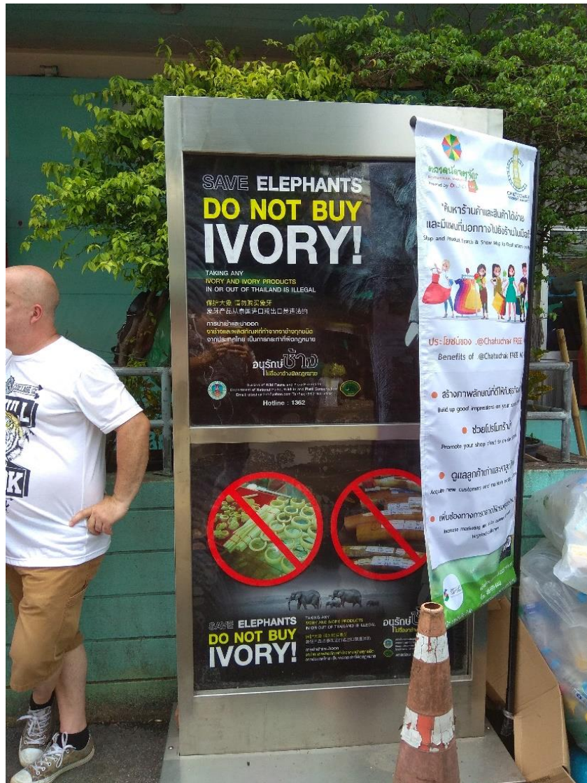
รูปภาพที่ 4 ป้ายประชาสัมพันธ์การให้ความรู้เกี่ยวกับการอนุรักษ์และลดการบริโภคงาช้าง ณ สุขา แห่งที่ 1 ตลาดนัดสวนจตุจักร กรุงเทพฯ