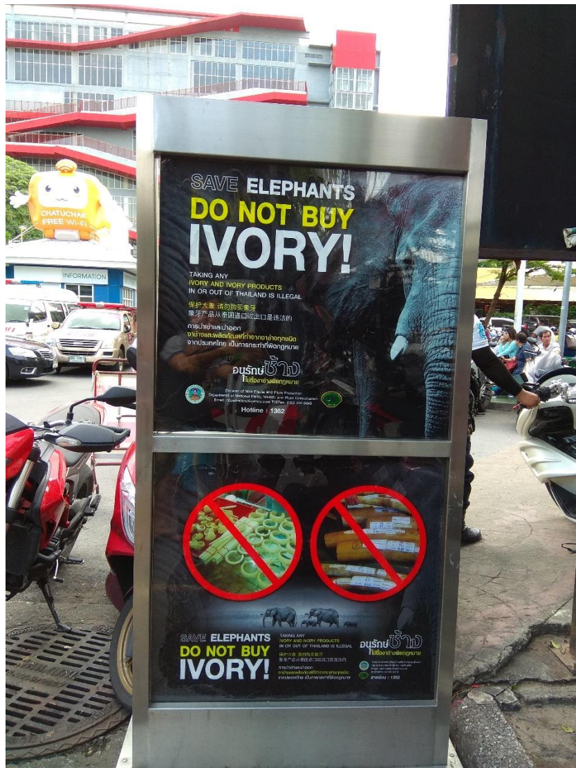
รูปภาพที่ 6 ป้ายประชาสัมพันธ์การให้ความรู้เกี่ยวกับการอนุรักษ์และลดการบริโภคงาช้าง ณ จุดนัดพบ ตลาดนัดสวนจตุจักร กรุงเทพฯ