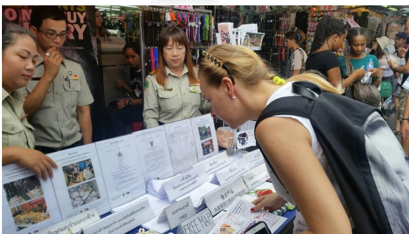
รูปภาพที่ 3 การประชาสัมพันธ์เกี่ยวกับการควบคุมการค้างาช้างในประเทศไทย เมื่อวันอาทิตย์ที่ 10 กรกฎาคม 2559 ด่านตรวจสัตว์ป่าลาดกระบัง จัดนิทรรศการที่ตลาดนัดจตุจักร กรุงเทพฯ ให้ความรู้เกี่ยวกับการควบคุมการค้างาช้าง ภายในประเทศและรณรงค์ไม่ให้นักท่องเที่ยวชาวต่างชาติซื้องาช้างจากประเทศไทย 130