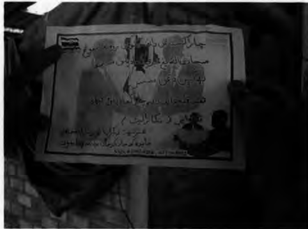
รูปที่ 15 ใบปลิวของ กอ.สสส.จขต. ขอความร่วมมือจาก ชาวบ้านต้นหยงลิมอไม่ให้เชื่อคำยุยงของผู้ไม่หวังดี

ลาเต๊ะ กาลิง ผู้ใหญ่บ้านหมู่ 7 ต.ต้นหยงลิมอ กล่าวว่า (สัมภาษณ์ 30 กรกฎาคม 2549) ทุกวันนี้ชาวบ้านต้องรอให้สว่างก่อนจึงจะกล้าออกไปกรีดยาง และเคยมีบางรายออกไปแล้วเจอबीดฤทธิ์ ซือมาแย มาแย แขนงไว้ที่ต้นยาง ก็ไม่กล้าไปอีกเลย ชาวบ้านคนอื่นๆที่ทราบเรื่องก็ไม่กล้าออกไปด้วยเหมือนกัน เพราะไม่รู้ว่าหากฝ่าฝืนแล้วจะเกิดอะไรขึ้น