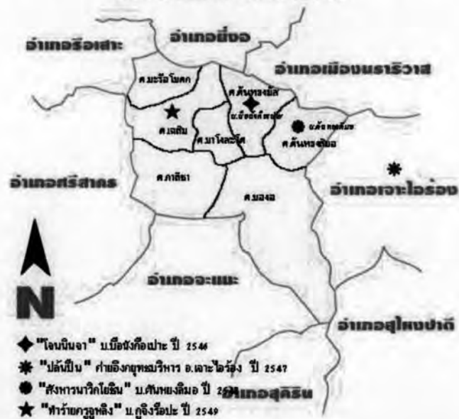
รูปที่ 11 แผนที่แสดงจุดเกิดเหตุรุนแรงใน อ.ระแงะและ อ.เจาะไอร้อง จ.นราธิวาส

อย่างไรก็ตาม จากการเข้าไปเก็บข้อมูลในพื้นที่และพูดคุยกับชาวบ้านทั้งแบบทางการและไม่เป็นทางการ พบว่า เส้นทางของการปฏิบัติการข่าวสารในลักษณะของข่าวลือเรื่องใจโรนินจาจะมีการก่อตัวขึ้นอย่างช้าๆก่อนที่จะเข้ามาในหมู่บ้านบือรังทือ และมักจะเกิดขึ้นที่หมู่บ้านรอบนอกและจังหวัดใกล้เคียงเป็นเวลานานประมาณ 2-3 เดือนแล้วจึงแพร่กระจายเข้ามา ชาวบ้านจะรับฟัง