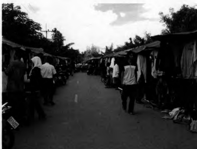
รูปที่ 13 ตลาดนัดใน 3 จังหวัดชายแดนภาคใต้

4.2.2 ร้านน้ำชา-หมู่บ้านใกล้เคียงแหล่งปล่อยข่าวสารในลักษณะของข่าวลือ ทหารกราดยิงร้านน้ำชาและข่าวห้ามกรีดยางที่หมู่บ้านตันหยงลิมอ