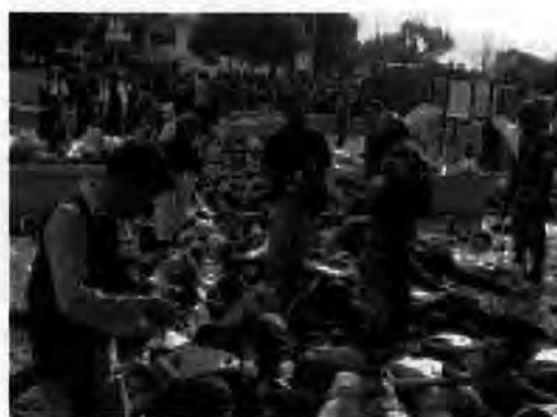
รูปที่ 17 การสลายการชุมนุมที่ อ.ตากใบ จ.นราธิวาส

ส่วนความผิดปกติที่เกิดขึ้นในช่วงที่มีการเจรจาต่อรองเพื่อนำทหารนาวิกโยธินทั้งสองนาย ออกจากหมู่บ้าน ในทัศนะของเจ้าหน้าที่รัฐไม่ว่าจะเป็นทหาร ตำรวจ หรือเจ้าหน้าที่ฝ่ายปกครองที่ ได้รับมอบหมายให้เข้าไปควบคุมสถานการณ์ในวันนั้นมีความเห็นตรงกันว่า น่าจะมีการเตรียมการ เพื่อสร้างสถานการณ์รอไว้แล้ว เนื่องจากชาวบ้านในหมู่บ้านกำลังมีอารมณ์โกรธแค้น โดย”คน นอก”หมู่บ้านที่เข้ามาได้อาศัยช่วงจังหวะนี้ทำการปลุกปั่นยั่วยุ ควบคู่กับ”คนใน”บางส่วนที่มี เป้าหมายในแนวทางเดียวกัน โดยที่ตัวแทนเจ้าหน้าที่รัฐที่เข้าไปเจรจาต่อรองไม่ว่าจะเป็น พล.ต. พิเศษ สุวิชัยจร รองแม่ทัพภาคที่ 4 นายนักมุคติน อูมา อดีตส.ส.ในพื้นที่ นายนิพนธ์ นราพิทักษ์กุล ปลัดจังหวัดนราธิวาส และนายขวัญชาติ วงศ์ศุภรานนท์ นายอำเภอกระแจะ ที่ได้รับอนุญาตจาก ชาวบ้านให้เข้าไปร่วมสังเกตการณ์ไม่สามารถสั่งการหรือเตรียมแผนการป้องกันได้เลย เพราะฝ่าย แนวร่วมใช้ยุทธวิธีปลุกปั่น สร้างข่าวลือตลอดเวลาที่มีการต่อรองเจรจา ทั้งยังใช้กลุ่มผู้หญิงและ เด็กเป็นกันชนเพื่อกดดันการทำงานของเจ้าหน้าที่รัฐ