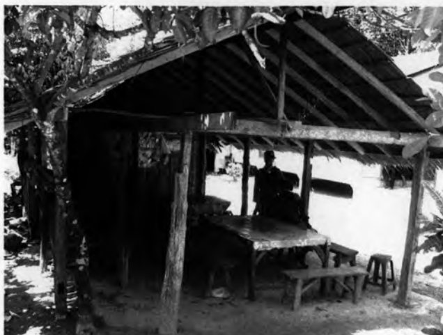
รูปที่ 12 ร้านน้ำชา บ้านตันหยงลิมอ

มาจากคำบอกเล่าของเพื่อนบ้าน ญาติ ในตลาด ร้านน้ำชาและร้านขายของชำ ซึ่งลักษณะการพูดคุยจะอยู่ในรูปของการสอบถาม ว่า “ได้ยินข่าวนี้บ้างหรือเปล่า เขาถือกันว่า...เขาว่ากันว่า”