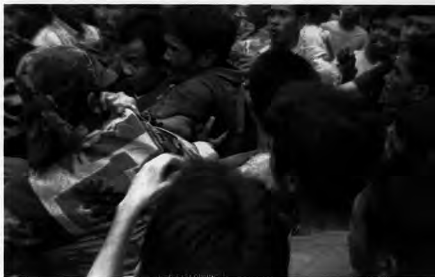
รูปที่ 9 เหตุการณ์ฝูงชนเดินทางมาชุมนุมที่บ้านปือนั่งกือเปาะ

4.1.2 กรณีศึกษาที่ 2 การปฏิบัติการข่าวสารในลักษณะของข่าวลือจับคนร้ายยิงชาวบ้าน- “ทหารบุก”ที่ตันหยงลิมอ