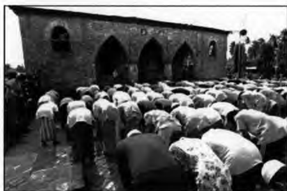
รูปที่ 16 มัสยิดกรือเซะ อ.เมือง จ.ปัตตานี

ความซับซ้อนของเหตุการณ์สังหารนาวิกโยธินทั้งสองนายไม่ได้มีเพียง กระบวนการปล่อยข่าวลือเพื่อทำร้ายมุ่งหวังเจ้าหน้าที่เท่านั้น การปล่อยข่าวลือว่ากองกำลังลับ ที่เข้ามากราดยิงร้านน้ำชาเป็นฝีมือของทหารยังเป็นปัจจัยสำคัญที่ทำให้ชาวบ้านที่มีอารมณ์โกรธ เกลียดเจ้าหน้าที่เป็นทุนเดิมอยู่แล้วเกิดความรู้สึกต่อต้านและต้องการใช้ความรุนแรงตอบโต้ ทั้งนี้ ข้อมูลการเสียชีวิตของชาวบ้านตันหยงลิมอจากการเข้าร่วมชุมนุมที่หน้าสภ.ตากใบเมื่อปี 2547 พบว่ามีจำนวน 3 ราย ตามบันทึกของสภ.ตากใบระบุว่า เป็นบุคคลสูญหาย