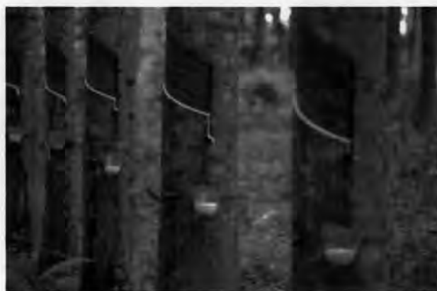
รูปที่ 14 สวนยางพาราสถานที่ที่มีการนำสัญลักษณ์แทนความตาย "บือฤห์ ซือมาแย มายะ" มาแขวนเพื่อข่มขู่ชาวบ้าน

อันที่จริงการเกิดข่าวสารในลักษณะข่าวลือตามหมู่บ้านต่างๆ ในเขตหมู่บ้านชาวไทยมุสลิมนั้นไม่ได้มีลักษณะที่แตกต่างกันมากนัก ขึ้นอยู่กับบริบทของสถานการณ์ในขณะนั้นๆ มากกว่า โดยเฉพาะช่วงที่มีการจับตัวสองนาวิกโยธินเป็นตัวประกันที่บ้านต้นหยงลิมอ ต.ต้นหยงลิมอ หมู่ 7 ซึ่งจากการเข้าไปเก็บข้อมูลพบว่า ในวันเกิดเหตุมีกระบวนการปฏิบัติการข่าวโดยการใช้อาวุธลือใน 2 ช่วงเวลาด้วยกัน คือ ใช้วิธีการสื่อสารในลักษณะปากต่อปากเพื่อสร้างความสับสนในช่วงวันเกิดเหตุ และหลังจากปัญหายุติแล้วประมาณสองเดือนได้มีการนำใบปลิวไปทิ้งไว้ตามสถานที่ต่างๆ โดยใบปลิวจะมีการเขียนข้อความเป็นภาษาไทย และเป็นภาษามลายูห้ามชาวบ้านให้ความร่วมมือกับเจ้าหน้าที่รัฐ และการไม่รับรองความปลอดภัยของผู้ที่เข้าไปเป็นลูกจ้างรัฐตามโครงการจ้างงาน รวมทั้งการใช้สิ่งของเป็นสัญลักษณ์แทนความตายข่มขู่ซึ่งชาวไทยมุสลิมเรียกว่า "บือฤห์ ซือมาแย มายะ" ซึ่งประกอบด้วย ข้าวสาร 1 ลิตร ไข่ไก่ 1 ฟอง ผ้าขาว 1 ผืน เงินจำนวน 20 บาท ซึ่งมักจะใช้ในการประกอบพิธีละหมาดศพแขวนไว้ที่ต้นยางเป็นการข่มขู่ชาวบ้านส่วนใหญ่จึงไม่มีใครกล้าฝ่าฝืนเนื่องจากกลัวอันตรายที่มองไม่เห็น