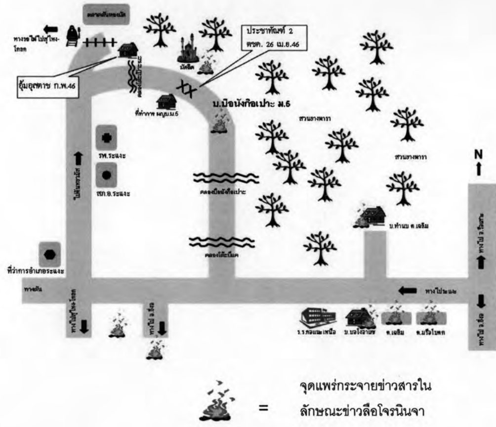
รูปที่ 8 แผนที่แสดงจุดแพร่กระจายข่าวสารในลักษณะของข่าวลือกับจุดเกิดเหตุรวมประชากรที่ต.ต.ร.ว.จ. 2 นายที่บ้านบือนังกือเปาะ

เพราะกลัวโจรนินจาจะมาขโมยข้าวของ ทำร้าย หรือจุดผู้หญิงเหมือนที่มีข่าวลือจากหมู่บ้านอื่นๆชาวบ้านทุกคนครบถ้วนเหมือนกันหมด พบกันก็จะคุยถึงแต่เรื่องโจรนินจา"ชาวบ้านบือนังกือเปาะซึ่งเป็นเจ้าหน้าที่ฝ่ายสัตวบาลปศุสัตว์ จ.นราธิวาส กล่าว (สัมภาษณ์ 6 สิงหาคม 2549)