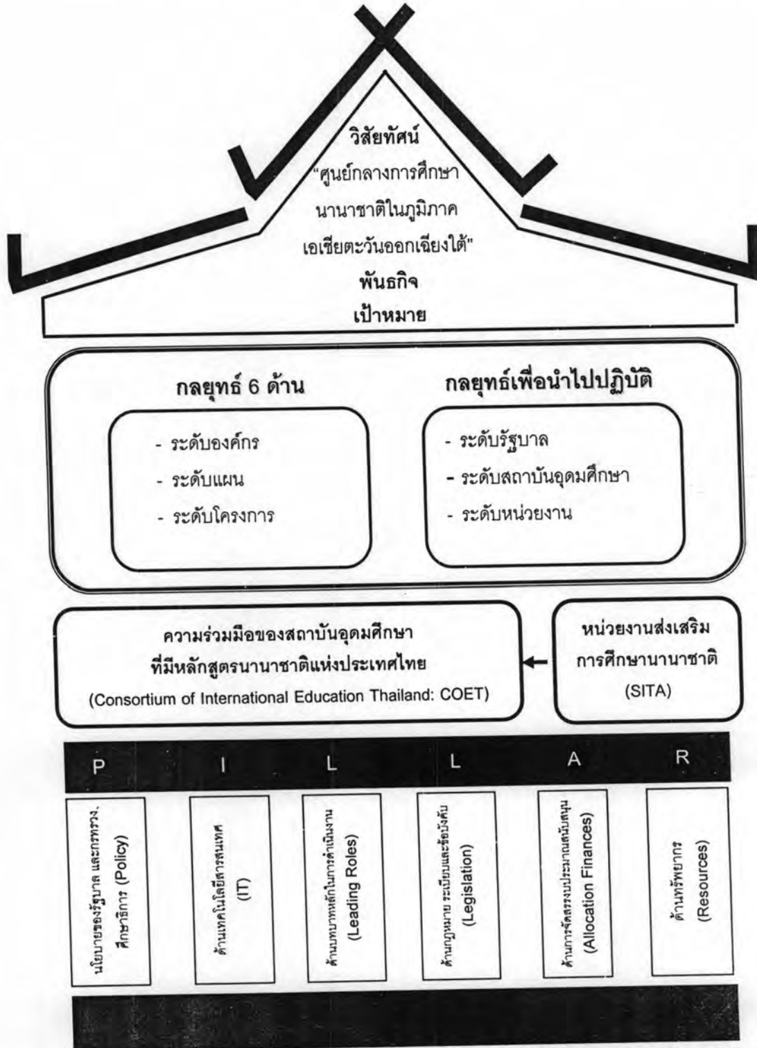
แผนภาพที่ 14 : ภาพรวมรูปแบบและกลยุทธ์การส่งเสริมให้ประเทศไทยเป็นศูนย์กลางการศึกษานานาชาติ ในภูมิภาคเอเชียตะวันออกเฉียงใต้

เมื่อนำองค์ประกอบที่สำคัญ 2 ด้านมาบูรณาการแล้ว จะได้ภาพรวมดังต่อไปนี้