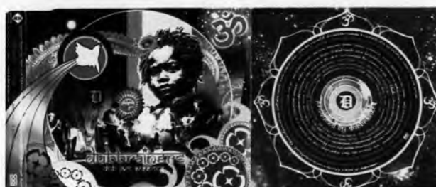
รูปภาพที่ 8.2 ภาพปกในของอัลบั้ม Ticket to the moon ของศิลปิน วรรณณา วีรยวรรณ