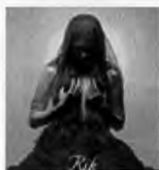
อัลบั้ม ปฐม (พ.ศ.2542) สังกัด เบเกอร์มิวสิก