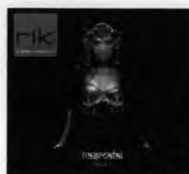
อัลบั้ม Rasmalai Chapter 1 (พ.ศ.2548) สังกัด หัวลำโพงริคติม