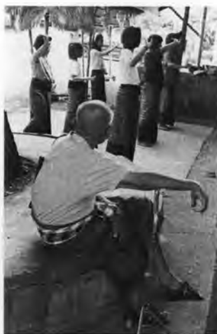
ภาพที่ 24 เยาวชนวัฒนธรรมไท-ยวนกำลังฝึกซ้อมการฟ้อนรำ

เห็นได้ว่าการจัดตั้งกลุ่มวัฒนธรรมไท-ยวนไม่เพียงแต่เป็นการอนุรักษ์วัฒนธรรมไท-ยวน เท่านั้น แต่ยังเป็นการส่งเสริมให้เยาวชนใช้เวลาว่างให้เป็นประโยชน์ โดยทางกลุ่มจะทำการฝึกซ้อม เยาวชนในช่วงเย็นของทุกวันเมื่อปิดเทอม แต่ถ้าเปิดเทอมจะซ้อมในวันเสาร์-อาทิตย์ ซึ่งวิธีการฝึกซ้อม นั้นในช่วงแรกจะให้ผู้ใหญ่เป็นผู้ถ่ายทอด ครั้นเมื่อเยาวชนมีความชำนาญแล้วจึงส่งต่อความรู้ด้วย วิธีการพี่สอนน้อง หรือเพื่อนสอนเพื่อน และหากได้งบประมาณจากหน่วยงานภายนอก อาทิ องค์การ บริหารส่วนตำบล องค์การบริหารส่วนจังหวัด สำนักงานวัฒนธรรม ก็จะมีการพาเยาวชนไปแลกเปลี่ยนวัฒนธรรมหรือศึกษาดูงานนอกสถานที่