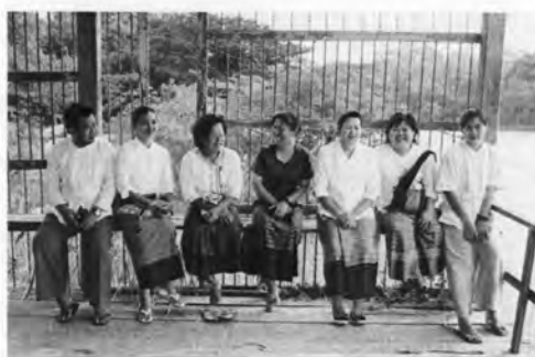
ภาพที่ 21 การแต่งกายของชาวไทย-ยวนในวันงานพิธีสืบชะตาแม่น้ำ ปี พ.ศ. 2551

ขณะที่ผู้วิจัยลงพื้นที่เก็บข้อมูล ผู้วิจัยพบว่าในวันปกติยังคงมีหญิงชราชาวไทย-ยวนนั่งขึ้นลายขวางกับเสื่อคอกกลมผ่าหน้า ส่วนคนวัยอื่นๆ ในชุมชนแต่งกายอย่างปัจจุบันคือเสื้อยืดและกางเกงหรือกระโปรง แต่หากมีงานประเพณีในชุมชน เช่น งานสืบชะตาแม่น้ำ คนในชุมชนบางส่วนก็จะแต่งกายแบบไทย-ยวน โดยพบว่าผู้หญิงวัยกลางคนขึ้นไปจะนั่งขึ้นสวมเสื่อคอกกลมผ่าหน้าติดกระดุมหรือผูกเชือก แขนสั้นหรือแขนยาว อันเป็นการแต่งกายตามปกติของชาวไทย-ยวนสมัยก่อน ส่วนวัยรุ่นทั้งหญิงและชายจะสวมเสื้อคอกกลมผ่าหน้าแขนสั้น นุ่งสะดอ (กางเกงของภาคเหนือ) ส่วนผู้ชายพบว่าแต่งกายอย่างปัจจุบัน