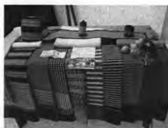
ภาพที่ 22-23 สตรีทอผ้าบ้านต้นตาลและสินค้าของกลุ่มทอผ้าบ้านต้นตาล