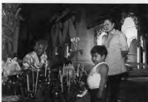
ภาพที่ 25 คนในชุมชนเชื้อ-ชายกระทงที่ทำจากวัสดุธรรมชาติ

ในขณะที่เดียวกันมัททายกก็บอกกล่าวเชิญชวนผ่านทางเครื่องกระจายเสียงให้ชาวบ้านมาร่วม ลอยกระทง พร้อมทั้งบอกเวลานัดหมายให้เข้าร่วมพิธีในโบสถ์ คือเวลาประมาณ 19.30 น. และสำหรับ เหตุผลที่มัททายกกล่าวเชิญชวนให้มาร่วมลอยกระทงนั้น ผู้วิจัยสรุปได้ ดังนี้