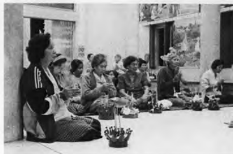
ภาพที่ 26-27 คนในชุมชนพึ่งเทศน์ก่อนนำกระทงไปลอย

หลังจากจบกัณฑ์เทศน์ พระสงฆ์กล่าวให้พรญาติโยม ประธานถวายกัณฑ์เทศน์แต่พระสงฆ์ จากนั้นพระสงฆ์กล่าวนำคาถาบูชากระทง โดยให้ผู้เข้าร่วมในพิธีหันหน้าไปทางแม่น้ำ หลังจากเสร็จสิ้นพิธีกรรมในโบสถ์แล้ว ชาวบ้านร่วมกันเดินนำกระทงไปลอยที่ทำนน้ำเป็นทิวแถว