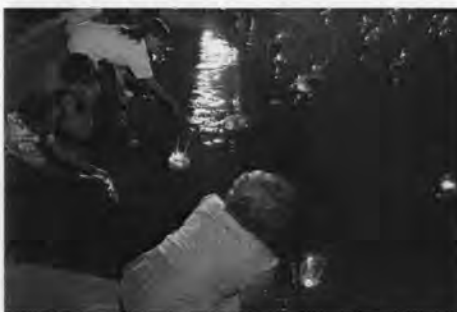
ภาพที่ 29 บรรยากาศการลอยกระทง ณ ริมน้ำป่าสักบ้านต้นตาล

นอกจากนี้ผู้วิจัยยังพบว่า ประเพณีลอยกระทง ไม่เพียงแต่เป็นกุศโลบายในการรักษาสิ่งแวดล้อมเท่านั้น แต่ยังเป็นการรักษาประเพณี วิถีชีวิตพื้นบ้าน โดยมุ่งเน้นในเรื่องพระพุทธศาสนาให้คงอยู่สืบไป รวมถึงการสร้างสายสัมพันธ์ภายในครอบครัว เช่น การพากันมาลอยกระทงพร้อมหน้าพร้อมตาทั้งครอบครัว แม่สอนลูกจตุรูบเทียน และความสัมพันธ์ระหว่างเพื่อนบ้านที่มีการพูดคุยทักทายหยอกเย้ากัน ซึ่งสิ่งเหล่านี้เป็นภาพที่ปรากฏในระหว่างการลอยกระทงที่ทำน้าบ้านต้นตาล ที่ผู้วิจัยได้พบเห็นในคืนวันพระจันทร์เต็มดวง