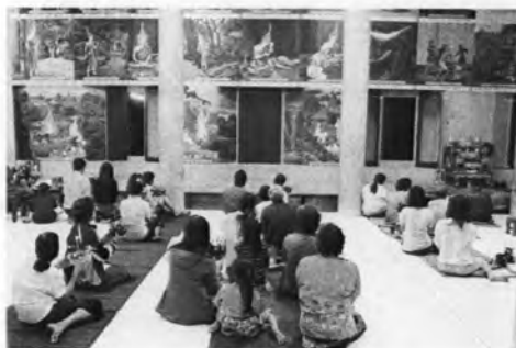
ภาพที่ 28 บูชากระทงโดยหันหน้าไปทางแม่น้ำป่าสัก

หลังจากจบกัณฑ์เทศน์ พระสงฆ์กล่าวให้พรญาติโยม ประธานถวายกัณฑ์เทศน์แต่พระสงฆ์ จากนั้นพระสงฆ์กล่าวนำคาถาบูชากระทง โดยให้ผู้เข้าร่วมในพิธีหันหน้าไปทางแม่น้ำ หลังจากเสร็จสิ้นพิธีกรรมในโบสถ์แล้ว ชาวบ้านร่วมกันเดินนำกระทงไปลอยที่ทำนน้ำเป็นทิวแถว