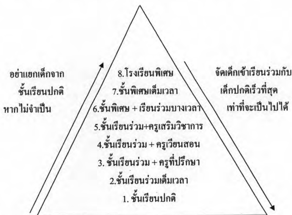
แผนภาพที่ 1 รูปแบบการจัดการศึกษาสำหรับเด็กที่มีความต้องการพิเศษ

ที่มา: Reynolds & Birch, 1977 อ้างถึงใน ผดุง อารยะวิญญู, 2533: 191