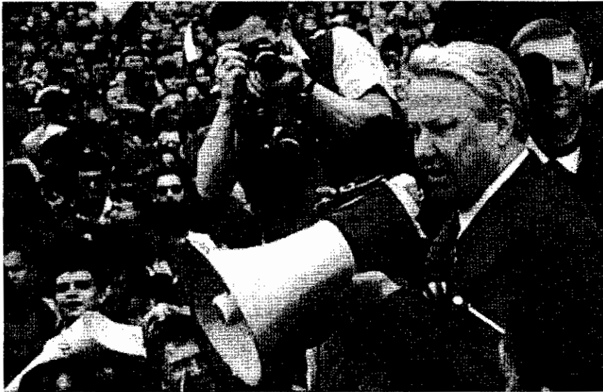
บอริส เยลต์ซิน ปราศรัยต่อประชาชนในการดำรงรัฐประหารเมื่อเดือนสิงหาคม ค.ศ.๑๙๙๑

ในยุโรปตะวันออก ในเดือนมิถุนายน ค.ศ.๑๙๙๐ ฮังการีถอนตัวจากกลุ่ม วอร์ซอ ต่อมาเมื่อถึงเดือนกันยายน เยอรมนีตะวันออกถอนตัวจากกลุ่ม วอร์ซอ จากนั้น ในเดือนกุมภาพันธ์ ค.ศ.๑๙๙๑ สมาชิกที่เหลือตัดสินใจ ยุบกลุ่มวอร์ซอ ซึ่งถือว่าเป็นการยุติสงครามเย็นอย่างเป็นทางการ