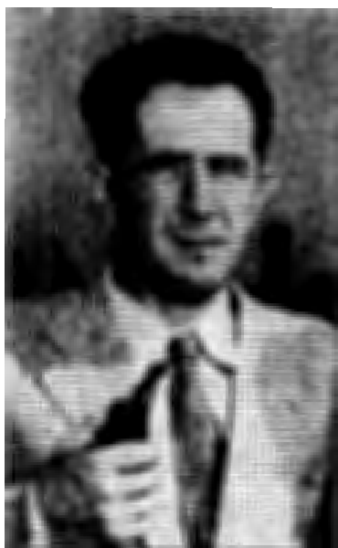
มิโลวาน จิลาส

ถึงแก่กรรมแล้ว ก็มีความเป็นไปได้ที่จะมีการเปลี่ยนแปลง จึงก่อให้เกิดความไม่พอใจสั่งสมมากยิ่งขึ้น ความล้มเหลวทางเศรษฐกิจ ยิ่งทำให้เกิดความเสื่อมในทางการเมือง เพราะรัฐเป็นผู้วางแผนเศรษฐกิจ ความผิดพลาดที่เกิดขึ้นจึงต้องอยู่ในความรับผิดชอบของรัฐยิ่งกว่ารัฐบาลตะวันตก