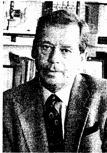
วาสลาฟ ฮาเวล

เมื่อกำแพงเบอร์ลินสลายลงแล้ว นักศึกษาเชโกสโลวาเกียจึงเริ่มการประท้วง ในกรุงปรากในวันที่ ๑๗ พฤศจิกายน