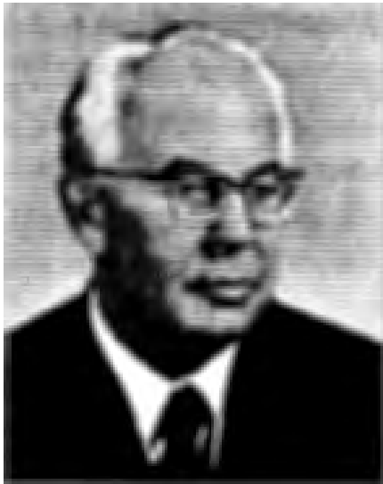
กุสตาฟ ซูซาค