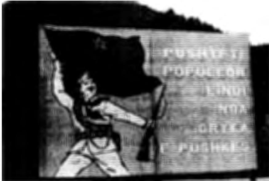
ป้ายโฆษณาให้เห็นถึงชัยชนะของสังคมนิยมอัลบาเนีย

แต่ทว่าในทศวรรษที่ ๑๙๖๐ ระบบสังคมนิยมเริ่มประสบปัญหาเมื่อสังคมเมืองพัฒนามากขึ้น การผลิตนอกภาคเกษตรขยายตัว แต่ผลผลิตเกษตรเริ่มขาดแคลนและกระทบต่อสินค้าด้านอาหาร และการวางแผนเศรษฐกิจส่วนกลางเมื่อดำเนินไปหลายปี ก็มักไม่สอดคล้องกับทิศทางพัฒนาเศรษฐกิจ และก่อให้เกิดการตกแต่งตัวเลขเพื่อให้เป็นไปตามแผน