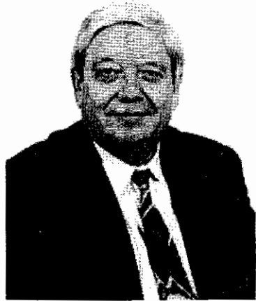
อิมเร พอชกอช

ปราบปรามหรือเผชิญหน้าฝ่ายค้าน แต่ต้องปฏิรูปภายในโดยเปิดให้มีเสรีภาพและใช้ขันติธรรมกับฝ่ายค้านมากขึ้น คล้ายกับนโยบายกลาสโนสต์ของกอร์บาเชฟ การผลักดันของกลุ่มปฏิรูป ทำให้พรรคคอมมิวนิสต์ฮังการีมีนโยบายยืดหยุ่นอะลุ่มอล่วย อย่างมากต่อการเคลื่อนไหวของกลุ่มฝ่ายค้าน