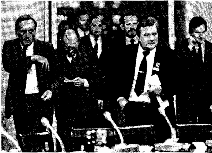
ภาพการประชุมโต๊ะกลมระหว่างรัฐบาลและฝ่ายสหภาพโปแลนด์

ในเดือนธันวาคม ค.ศ.๑๙๘๕ สภาผู้แทนของโปแลนด์ได้รับรองนโยบายของรัฐบาลที่จะเปลี่ยนระบบเศรษฐกิจจากการวางแผน ไปสู่ระบบตลาดเสรี มีการแก้ไขรัฐธรรมนูญ ให้ตัดมาตราที่ว่าด้วยบทบาทนำของพรรคคอมมิวนิสต์ออก นอกจากนี้คือเปลี่ยนชื่อประเทศเป็น 'สาธารณรัฐโปแลนด์' พรรคเอกภาพกรรมกร (พรรคคอมมิวนิสต์) ยุบตัวเองลงในเดือนมกราคม ค.ศ.๑๙๙๐ และมีการตั้งพรรคใหม่ขึ้นแทน คือ พรรคสังคมนิยมประชาธิปไตยโปแลนด์