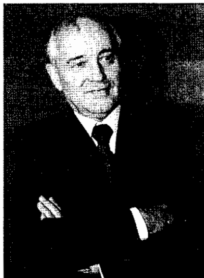
มีคาอิล กอร์บาชอฟ ผู้นำโซเวียตยุคใหม่ เสนอแนวทางปฏิรูป

สำหรับในประเทศอื่นๆ กลุ่มฝ่ายค้านได้พัฒนาขึ้นเช่นกัน โดยเฉพาะในกลุ่มของนักศึกษา ปัญญาชน ขบวนการกรรมกร กลุ่มศาสนา และแม้กระทั่งประชาชนทั่วไป ความไม่พอใจในระบบรัฐของคอมมิวนิสต์ ยังเห็นได้จากการเกิดขึ้นของนิทานเสียดสีจำนวนมากที่เล่ากันอย่างแพร่หลายในหมู่ประชาชน ซึ่งเสียดสีพรรค ผู้นำพรรคและนโยบาย ฯลฯ การพัฒนาของกระแสฝ่ายค้านเหล่านี้ ได้รับผลสะท้อนมากขึ้นหลัง ค.ศ.๑๙๘๕ เมื่อมีคาอิล กอร์บาชอฟ (Mikhail Gorbachev, ๑๙๓๑-) ขึ้นรับตำแหน่งเลขาธิการพรรคคอมมิวนิสต์สหภาพโซเวียต แล้วปรับนโยบายอย่างมากด้วยการปฏิรูปเปเรสตรอยกา (Perestroika) หมายถึง การปฏิวัติโครงสร้าง และกลาสนอสต์ (glasnost) ซึ่งหมายถึง นโยบายเปิดกว้างทางความคิด เพื่อให้มีประชาธิปไตยมากขึ้น การปฏิรูปเหล่านี้ ได้นำมาซึ่งการเปลี่ยนแปลงระบอบเศรษฐกิจ การเมืองครั้งใหญ่ในสหภาพโซเวียต