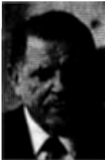
วลาดีมีร์ เมเชียร์

ได้เปิดการเจรจากันเพื่อจะหาทางแก้ไขรัฐธรรมนูญเพื่อรักษาสหพันธรัฐ แต่ไม่อาจตกลงกันในขั้นหลักการได้ ในวันที่ ๑๗ กรกฎาคม ค.ศ.๑๙๙๒ รัฐสภาแห่งรัฐสโลวาเกียก็ลงมติให้สโลวาเกียเป็นประเทศเอกราช มตินี้ได้รับการรับรองในรัฐสภาแห่งสหพันธ์โดยมีการออกกฎหมายแบ่งแยกประเทศ ให้ทั้งสองประเทศใช้ระบบเงินตราเดียวกันไปจนกว่าแต่ละประเทศจะสถาปนาระบบการเงินอิสระ ให้สองประเทศใช้ระบบสหภาพสกุลการร่วมกัน ให้มีการแบ่งแยกกองทัพประจำการ วันที่ ๑ มกราคม ค.ศ.๑๙๙๓ สาธารณรัฐสโลวาเกียแยกจากสาธารณรัฐเช็กอย่างเป็นทางการ เมเชียร์รับตำแหน่งประธานาธิบดีของสโลวาเกีย ประเทศเชโกสโลวาเกียจึงสลายลง หลังจากที่ดำรงอยู่ได้ ๓๕ ปี และการแยกประเทศนี้จะถูกเรียกอย่างไม่เป็นทางการว่า ‘การหย่าขาดแบบกำมะหยี่’ (Velvet Divorce) คือ แยกกันอย่างเป็นมิตรไม่มีความรุนแรง