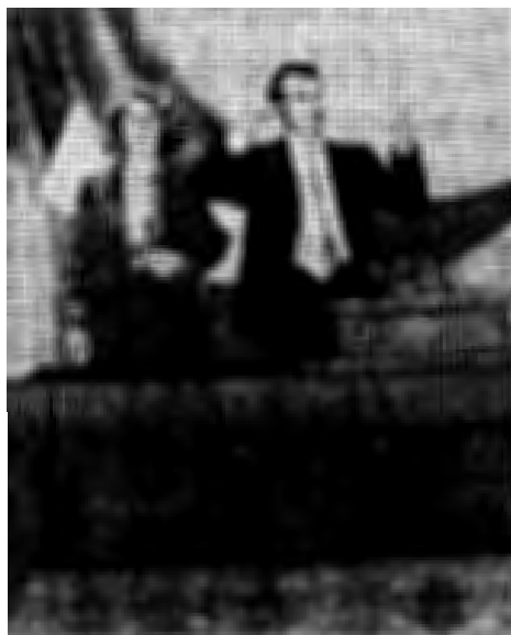
ภาพจิตรกรรมโมฆณาของผู้นำโรมาเนีย

๒. เป็นไปโดยการ สลายจากเบื้องบนลงสู่ล่าง (Top-down) คือกรณีของ พรรคคอมมิวนิสต์ฮังการี ที่ ลดอำนาจของตน และเปิดทาง