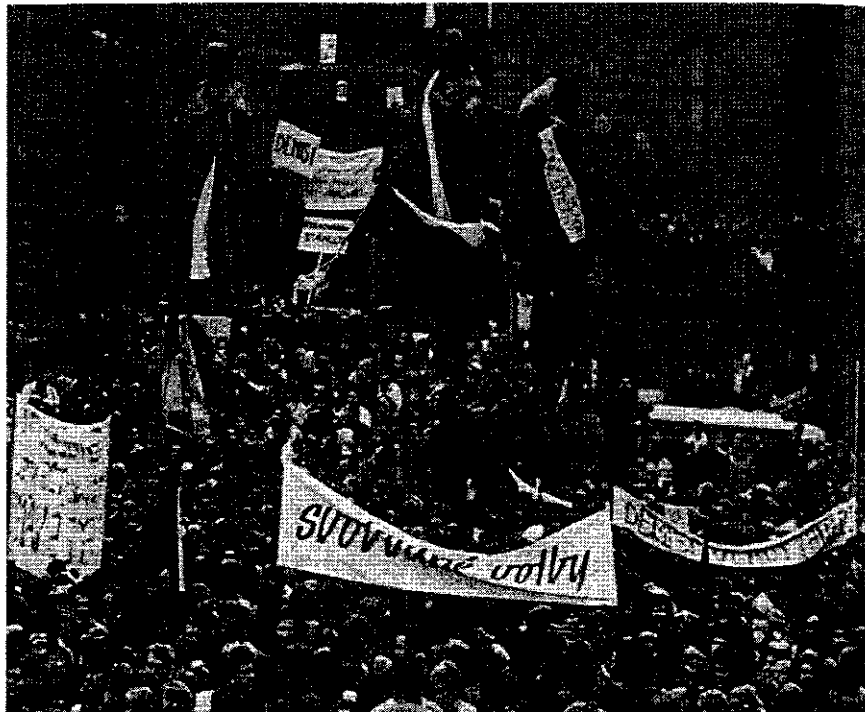
การปฏิวัติกำมะหยี่ในเชโกสโลวาเกียวันที่ ๒๘ พฤศจิกายน ค.ศ.๑๙๘๙

เมื่อเข้ารับตำแหน่ง ชาลฟาก็ลาออกจากสมาชิกพรรค และตั้งรัฐบาลสายกลางที่ไม่มีสมาชิกพรรคคอมมิวนิสต์เลย ในที่สุดฮุซาคก็ถูกบีบให้ลาออกจากตำแหน่งประธานาธิบดี และคูบเชกได้เข้ารับตำแหน่งประธานสภา หลังจากนั้น ในวันที่ ๓๐ ธันวาคม รัฐสภาเชโกสโลวาเกียก็ได้เลือก วาสลาฟ ฮาวล ให้ดำรงตำแหน่งประธานาธิบดี ซึ่งนับเป็นจุดสิ้นสุดแห่งการปกครองระบอบคอมมิวนิสต์