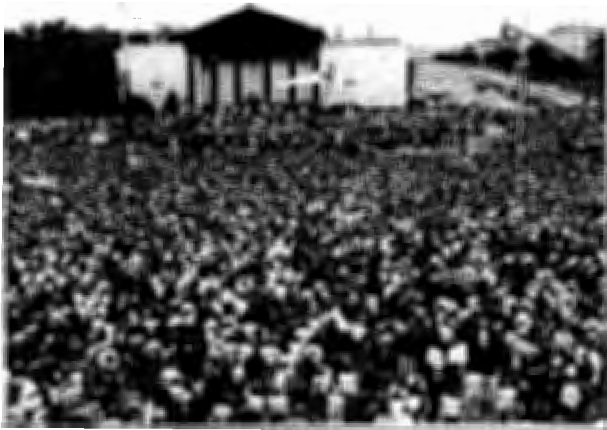
พิธีศพอิมเร นอย ๑๖ มิถุนายน ค.ศ.๑๙๘๕

ฮังการีก็ประชุมสมัชชาพรรคครั้งที่ ๑๔ และเป็นครั้งสุดท้าย เพราะได้ผ่านมติล้มเลิกพรรคคอมมิวนิสต์ เปลี่ยนเป็นพรรคสังคมนิยมฮังการี พร้อมทั้งประกาศเลิกใช้ลัทธิเลนิน หันมาใช้แนวทางสังคมนิยมประชาธิปไตย เรสเซอ เนียสได้รับเลือกเป็นประธานพรรค จากนั้น พรรคก็ได้เสนอญัตติเข้าสู่รัฐสภา รับรองระบอบการเมืองพหุพรรคอย่างเป็นทางการ ในวันที่ ๒๓ ตุลาคม ค.ศ.๑๙๘๙ ฮังการีจึงประกาศเป็น 'สาธารณรัฐ' แทนที่เดิมที่ชื่อว่า 'สาธารณรัฐประชาชน'