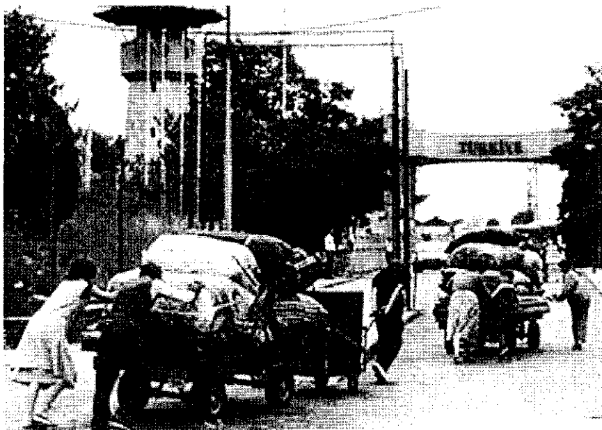
ชาวบัลแกเรียเชื้อสายเติร์กจำนวนมากอพยพหนีการปราบปรามเมื่อ ค.ศ.๑๘๘๕

ในเดือนพฤษภาคม ค.ศ. ๑๘๘๕ ประชาชนเชื้อสายเติร์กเดินขบวนเรียกร้องสิทธิและคัดค้านนโยบายกีดกันชาติ ชิฟคอฟสั่งให้กองทหาร