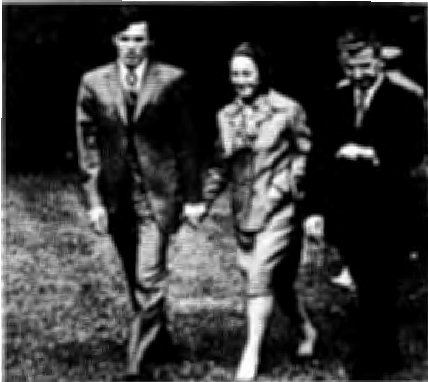
นิคู เซาเซสคู พร้อมกับ เอเลนา ผู้มารดา และ นิโคไล ผู้เป็นบิดา

สร้างทำเนียบแห่งสาธารณรัฐ และการสร้างสนามบินที่ทันสมัยเพื่อเป็นที่ เชิดหน้าชูตาของประเทศ การดำเนินการเหล่านี้ แม้ว่าจะช่วยเชิดชู ภาพลักษณ์ของผู้ทำให้สูงเด่น แต่กลับทำให้โรมาเนียกลายเป็นประเทศมี หนี้สินมากประเทศหนึ่ง จนในที่สุดองค์การกองทุนการเงินระหว่าง ประเทศ (ไอเอ็มเอฟ) ได้ขอให้โรมาเนียปรับปรุงเงื่อนไขทางการเงิน ใน ค.ศ.๑๙๘๒ เซาเซสคูไม่ยอมรับ และได้ตัดสินใจดำเนินนโยบาย อย่างหนึ่งซึ่งจะทำให้เขาเสื่อมความนิยมจากประชาชนลงไป นั่นคือ การตัดสินใจยุติการกู้เงิน และจะใช้หนี้ต่างประเทศคืนทั้งหมด โดยใช้ นโยบายรัดเข็มขัดภายในประเทศอย่างเข้มงวด ทำให้ประชาชนต้อง ทำงานหนัก แต่ลำบากยากจนอย่างมาก ต้องปันส่วนทุกอย่าง ปันส่วน อาหาร เครื่องนุ่งห่ม จำกัดพลังงานที่ใช้ในฤดูหนาว เพื่อรวบรวมมูลค่า