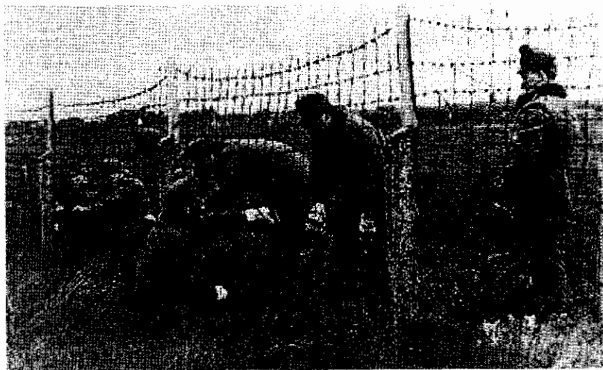
รัฐบาลฮังการีได้สั่งให้ตัดรั้วลวดหนามด้านที่ติดต่อกับออสเตรีย พฤษภาคม ค.ศ.๑๙๘๕

ในเดือนพฤษภาคม ค.ศ.๑๙๘๕ มีการเลือกตั้งซ่อม พรรคคอมมิวนิสต์ได้รับชัยชนะเหมือนที่ผ่านมา แต่ฝ่ายค้านได้เดินขบวนครั้งใหญ่ที่เมืองไลพ์ซิกเป็นครั้งแรก เพื่อแสดงความไม่พอใจการทุจริตเลือกตั้ง แต่รัฐบาลสามารถควบคุมสถานการณ์ได้ ปรากฏว่าการเปลี่ยนแปลงในฮังการีก็ส่งผลต่อเยอรมนีตะวันออกด้วย เนื่องจากรัฐบาลฮังการีได้สั่งให้ตัดรั้วลวดหนามด้านที่ติดต่อกับออสเตรีย ตั้งแต่เดือนพฤษภาคม ค.ศ.๑๙๘๕ เป็นการเปิดโอกาสให้ชาวเยอรมนีตะวันออกหนีผ่านแดนข้าม ไปยังเยอรมนีตะวันตกได้ ตั้งแต่เดือนสิงหาคม เป็นต้นมา ชาวเยอรมนีตะวันออกจำนวนมากขึ้นทุกที่หนีผ่านฮังการีข้ามพรมแดนออสเตรียไปยัง เยอรมนีตะวันตก จนในที่สุดเมื่อวันที่ ๑ ตุลาคม ค.ศ.๑๙๘๕ รัฐบาลเยอรมนีตะวันออกต้องอนุญาตให้ชาวเยอรมันที่ต้องการลี้ภัย สามารถเดินทางโดยรถไฟผ่านไปยังเยอรมนีตะวันตก ในขณะที่สถานการณ์ของรัฐบาลพรรคคอมมิวนิสต์ในเยอรมนีตะวันออกตกต่ำลงทุกที วันที่ ๗ ตุลาคม มิคาอิล กอร์บาชอฟ ผู้นำโซเวียตเดินทางมาเยือนเพื่อร่วมงานครบรอบ ๔๐ ปีเยอรมนีตะวันออก ได้รับการต้อนรับอย่างดีจากประชาชนที่ต้องการให้มีการปฏิรูปในเยอรมนีตะวันออก