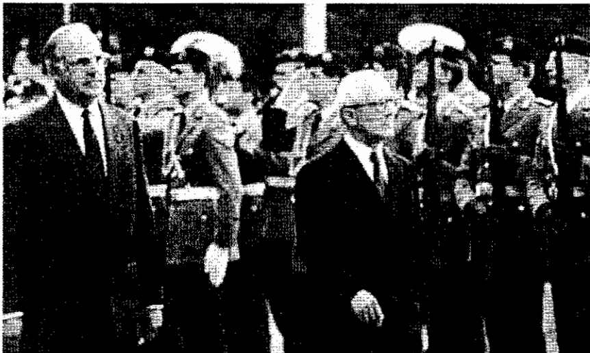
นายกรัฐมนตรีเฮลมุท โคห์ล แห่งเยอรมนีตะวันตก และเอริก โฮเนคเคอร์ แห่งเยอรมนีตะวันออก เมื่อเดือนกันยายน ค.ศ.๑๙๘๗

แม้ว่าจะมีความพยายามที่จะสร้างความสัมพันธ์ขั้นปกติกับเยอรมนีตะวันตก โดยการที่เอริก โฮเนคเคอร์ผู้นำเยอรมนีตะวันออกเดินทางไปเยือนเยอรมนีตะวันตกอย่างเป็นทางการในวันที่ ๗ กันยายน ค.ศ.๑๙๘๗ และทำให้ความตึงเครียดทางการเมืองระหว่างประเทศผ่อนคลาย แต่การบริหารภายในประเทศเยอรมนีตะวันออกก็เป็นที่ไปในแนวทางเดียวกับแนวทางเบรตเนฟในสหภาพโซเวียต ดังนั้น เมื่อมีคาอิล กอร์บาชอฟเริ่มทำการปฏิรูปโซเวียตตั้งแต่หลัง ค.ศ.๑๙๘๕ โฮเนคเคอร์ไม่เห็นด้วยแม้แต่น้อยและไม่ยอมให้มีการปฏิรูปใดๆในเยอรมนีตะวันออก แต่สถานการณ์ทางเศรษฐกิจของประเทศกำลังเข้าขั้นวิกฤต และหนี้สินต่างประเทศเพิ่มสูงขึ้นอย่างมาก จนรัฐบาลต้องลดเงินอุดหนุน ในโครงการสวัสดิการสังคม แม้ว่ารัฐบาลจะใช้วิธีการควบคุมข่าวสาร มิให้ประชาชนได้ทราบถึงเรื่องการเปลี่ยนแปลงในโซเวียต แต่ในที่สุดการปฏิรูปนั้นก็เป็นที่รับทราบ และเรียกร้องให้เยอรมนีตะวันออกปฏิรูปในแนวทางเช่นนั้นบ้าง