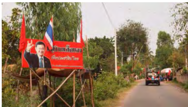
ภาพที่ 1 ทางเข้าหมู่บ้านกรณีศึกษาเมื่อปี พ.ศ. 2554

ผู้วิจัยเคยปรากฏตัวในหมู่บ้านนาใหญ่ครั้งแรกเมื่อเดือนมีนาคมปี พ.ศ. 2554 และเดินทางเข้า-ออกหมู่บ้านแห่งนี้ตลอดทั้งปีเพื่อพักแรม ณ บ้านของผู้นำชุมชนระหว่างการลงภาคสนามเก็บข้อมูลผู้ได้รับผลกระทบจากเหตุการณ์สลายการชุมนุมคนเสื้อแดงจังหวัดอุดรธานี ขณะนั้นหมู่บ้านนาใหญ่ได้กลายเป็นหมู่บ้านเสื้อแดงไปแล้ว มีป้ายหมู่บ้านเสื้อแดงเพื่อประชาธิปไตยตั้งเด่นตระหง่านอยู่หน้าหมู่บ้าน ธงสัญลักษณ์ของกลุ่มคนเสื้อแดงถูกปักหน้าบ้านของชาวบ้านแทบทุกหลัง รวดตากผ้าที่บ้านผู้นำชุมชนแทบจะไม่มีเสื้อสีอื่นๆ แขนงอยู่นอกจากเสื้อสีแดง ภาพบรรยากาศเหล่านั้นได้สร้างความตื่นตาตื่นใจให้กับผู้วิจัยเป็นอย่างมาก แต่ช่วงเวลานั้นผู้วิจัยไม่มีโอกาสได้พูดคุยกับชาวบ้านทั่วไปเลยนอกจากผู้ได้รับผลกระทบจากเหตุการณ์สลายการชุมนุมคนเสื้อแดงและผู้นำชุมชน ผู้วิจัยจึงมีจินตนาการเกี่ยวกับความสัมพันธ์ของผู้คน ความเข้มข้นทางของเมืองของชาวบ้านจากคำบอกเล่าถึงประสบการณ์ทางการเมืองของผู้นำชุมชนและจากภาพบรรยากาศของหมู่บ้านที่ผู้วิจัยได้พบเห็น