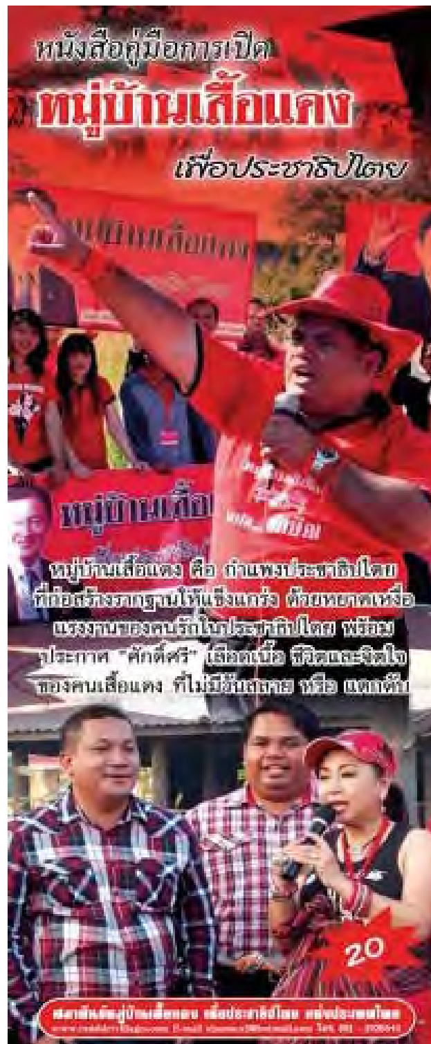
ภาพที่ 8 หนังสือคู่มือเปิดหมู่บ้านเสื้อแดง