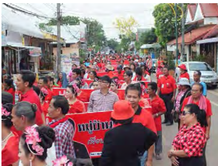
ภาพที่ 9 พิธีเปิดอำเภอเสื้อแดง จังหวัดสกลนคร มีหมู่บ้านเข้าร่วมพิธีทั้งหมด 102 แห่ง 13

ยุทธวิธีเปิดหมู่บ้านพร้อมกันหลายๆ หมู่บ้าน และนัดรวมพลหมู่บ้านที่จะเปิดเป็นหมู่บ้านเสื้อแดง มาทำพิธีเปิดหมู่บ้านพร้อมกัน จัดขบวนแห่ป้ายหมู่บ้านเสื้อแดงร่วมกัน ดังที่ปรากฏในภาพถ่ายว่า มีป้ายหมู่บ้านเสื้อแดงจำนวนมากอยู่ในขบวนแห่ ซึ่งภาพบรรยากาศที่คึกคักเช่นนี้ มีอิทธิพลอย่างมากต่อการสร้างภาพลักษณ์ว่าแนวคิดหมู่บ้านเสื้อแดงกลายเป็นกิจกรรมการเมืองที่ได้รับการตอบรับเป็นอย่างดีจากชาวบ้าน และยุทธวิธีนี้ได้ถูกนำมาใช้ในพิธีเปิดหมู่บ้านเสื้อแดงหลายแห่งในประเทศไทย รวมทั้งพิธีเปิดหมู่บ้านเสื้อแดงห้าแห่งในพื้นที่ภาคกลางที่ผู้วิจัยได้ร่วมสังเกตการณ์ด้วย