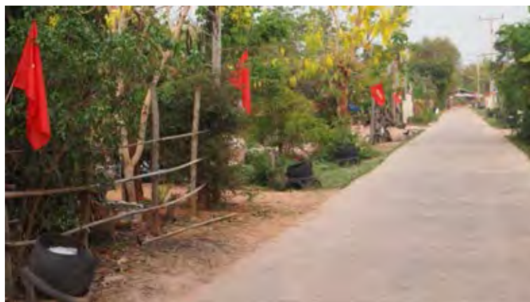
ภาพที่ 2 บรรยากาศภายในหมู่บ้านเมื่อปี พ.ศ. 2554