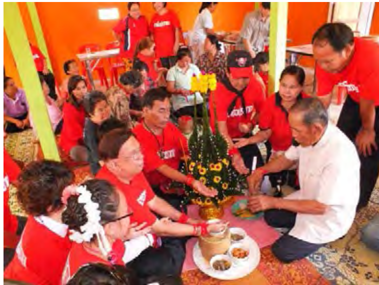
ภาพที่ 6 พิธีบายศรีสู่ขวัญหรือพิธีผูกเสี่ยวในภาษาอีสาน 7