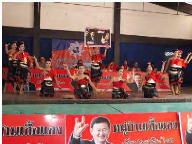
ภาพที่ 7 พิธีเปิดหมู่บ้านเสือแดง 8