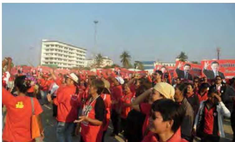
ภาพที่ 5 การแห่ป้ายหมู่บ้านเสื้อแดง 6

ท่ามกลางการเฝ้าระวังของรัฐ แนวคิดหมู่บ้านเสื้อแดงที่ถูกเผยแพร่โดยสื่อมวลชนกระแสหลักและสื่อมวลชนท้องถิ่นได้ทำให้กิจกรรมเปิดหมู่บ้านเสื้อแดงได้รับการตอบรับเป็นอย่างดีจากคนเสื้อแดงจังหวัดอุดรธานีที่กำลังอยู่ในภาวะอึดอัดทางการเมือง และในเดือนมกราคม พ.ศ. 2554 หมู่บ้านเสื้อแดงแห่งที่สอง ได้ถูกเปิดขึ้น ณ หมู่บ้านโคกสว่าง ต.นาเหล่า อ.เพ็ญ จ.อุดรธานี หลังจากนั้นได้มีการเปิดหมู่บ้านเสื้อแดงอีกหลายแห่งอย่างต่อเนื่อง มีมวลชนเข้าพิธีเปิดเพิ่มมากขึ้นเรื่อยๆ การเปิดหมู่บ้านเสื้อแดงบางแห่งมีมวลชนเข้าร่วมนับพันคน ด้านพิธีการเปิดหมู่บ้านเสื้อแดงที่เคยจัดขึ้นอย่างเรียบง่าย ต่อมาได้ถูกผสมผสานเข้ากับประเพณีวัฒนธรรมท้องถิ่นเพื่อความศักดิ์สิทธิ์และสร้างความครื้นเครงให้กับการเปิดหมู่บ้านเสื้อแดง อาทิ พิธีบายศรีสู่ขวัญหรือผูกเสี่ยว การแห่ป้ายหมู่บ้านเสื้อแดงด้วยขบวนกลองยาว ฯลฯ