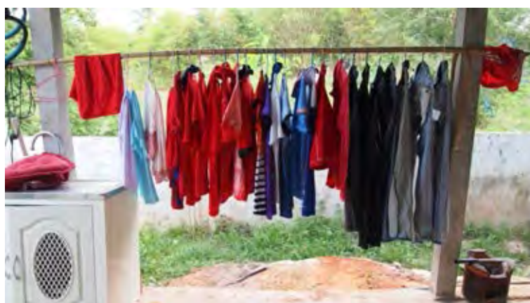
ภาพที่ 3 ราวตากผ้าบ้านแกนนำคนเสื้อแดง

จนกระทั่งเมื่อวันที่ 10 ตุลาคม พ.ศ. 2555 ผู้วิจัยได้กลับเข้ามาในหมู่บ้านนาใหญ่อีกครั้ง ในฐานะนิสิตปริญญาโทที่กำลังศึกษาหมู่บ้านในฐานะที่เป็นหมู่บ้านเสื้อแดงแห่งแรกๆ ของประเทศไทย จากการประเมินผลการสัมภาษณ์สองวันแรกของผู้วิจัยพบว่า ผู้ให้ข้อมูลหลักบางคน มีลักษณะการตอบคำถามที่เกี่ยวกับการเมืองแบบเบ่งรับเบ่งสู้ เช่น การออกตัวว่าไม่ค่อยมีเวลา ติดตามเรื่องการเมืองมากนักจะไปถามจากชาวบ้านคนอื่นน่าจะได้อีกมากกว่า ขณะที่ชาวบ้านคนหนึ่งจำหน่ายผู้วิจัยได้และได้ถามคำถามว่า รอบนี้ผู้วิจัยจะมาเก็บข้อมูลไปทำอะไรอีก? หรือบางคนถามว่า ผู้วิจัยรู้จักหมู่บ้านนี้ได้ยังไง? ใครพาเข้ามาในหมู่บ้าน? พักที่ไหน? เป็นต้น จากลักษณะการสนทนา น่าเสียง และท่าทางของผู้ให้ข้อมูลหลัก แสดงให้เห็นว่า ชาวบ้านได้ประเมินตัวตนของผู้วิจัยในฐานะคนนอกที่มีความสัมพันธ์ส่วนตัวกับผู้นำชุมชนมากกว่าการให้ความสำคัญกับตัวตนของผู้วิจัยในฐานะนักศึกษาปริญญาโทที่กำลังเก็บข้อมูลภาคสนามเพื่อประกอบการเขียนวิทยานิพนธ์ การถูกประเมินตัวตนในสถานะดังกล่าวน่าจะเกิดมาจากความบงการของผู้วิจัยที่