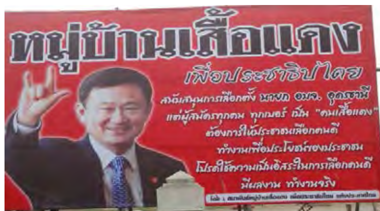
ภาพที่ 12 ป้ายประชาสัมพันธ์ไม่สนับสนุนกลุ่มใดกลุ่มหนึ่งในการเลือกตั้ง อบจ.