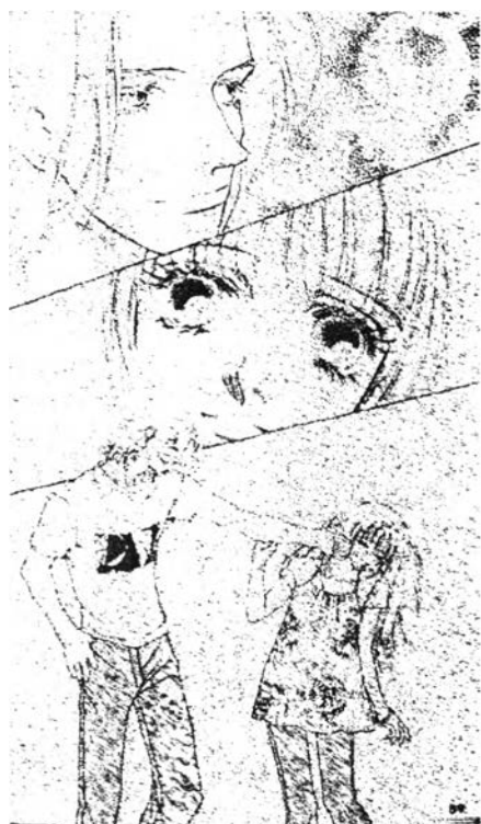
ภาพที่ 6.15 ความรักใคร่เสนหา 1 จากการ์ตูนเรื่อง "สิงห์นักบิณฑา นักโบก" (Mars) เล่มที่ 8 หน้า 89

ความรัก จะพบมากมายในการ์ตูนทุกเรื่องไม่ว่าจะเป็นการนั่งใกล้ๆ กัน เดินจูงมือกันหรือจับมือกัน สบตากัน มองกันอย่างดูดีมี ยิ้มให้กัน กอดกัน จนกระทั่งบอกรักกันด้วยวาจา ซึ่งแต่ละเรื่องจะมีระดับของการเกิดพฤติกรรมไม่พร้อมกัน กล่าวคือ การ์ตูนเรื่อง "สิงห์นักบิณฑา นักโบก" ฝ่ายชาย (คาซึโน เร) ทำที่เล่นที่จริงขอฝ่ายหญิงตั้งแต่วันแรกๆ ไปส่งฝ่ายหญิง (อะโซ คิระ) ที่บ้านวันแรก ซึ่งเป็นวันแรกๆ ของการรู้จักกันแต่ฝ่ายหญิงปฏิเสธ ต่อมาเป็นการกอดกันตอนไปเดท เนื่องจาก คิระและเรหลงกันในห้องสรรพสินค้าเมื่อทั้งคู่หาค้นเจอก็วิ่งเข้ามากอดกันตรงบริเวณบรรไดเลื่อนในห้องสรรพสินค้าที่มีคนเดินผ่านไปผ่านมา จากนั้นคิระขอจับมือเรไว้เพราะกลัวว่าจะหลงกันอีก และเมื่อกลับบ้านก็จับกันหน้าตึกอพาทเมนต์ซึ่งพฤติกรรมที่เกิดขึ้นนี้ทั้งสองยังเป็นเพียงเพื่อนกันอยู่ เมื่อทั้งคู่เป็นแฟนกันแล้วรูปแบบของความรักใคร่เสนหามีเพิ่มมากขึ้นมักจะสบตากัน มองกันอย่างดูดีมี ยิ้มให้กัน และกอดกัน