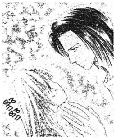
ภาพที่ 6.19 ความรักใคร่เสน่หา 5

ที่เป็นแฟนกับแฟนเก่ามีที่ทำว้ายรักกันอยู่จนหลับไป เป็นพฤติกรรมที่ไม่ควรทำเพราะฝ่ายหญิงยังไม่ได้อนุญาตอีกประการหนึ่งนานาโกะมีแฟนอยู่แล้วและไม่ได้เป็นแฟนกันจึงไม่ควรฉวยโอกาสแสดงความรักใคร่เสน่หาโดยที่ผู้ถูกกระทำไม่รู้ตัว ดังภาพรูปแบบพฤติกรรมของความรักใคร่เสน่หาต่างๆ ในเรื่องนี้