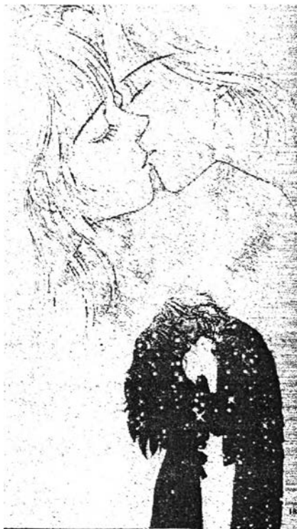
ภาพที่ 6.17 ความรักใคร่เสน่หา 3

ตีกอพาทเมนท์, ห้างสรรพสินค้า เป็นต้น ซึ่งในการแสดงความรักใคร่เสน่หาที่ปรากฏในการ์ตูนเรื่อง "สิงห์นักบิณฑาสาวนักโบก" ไม่ใช่สิ่งที่ผิด แต่บางครั้งบางพฤติกรรมเกิดขึ้นไม่เหมาะสมกับสถานที่และเวลา เช่น การกอด การจูบกันในที่สาธารณะในช่วงเวลาที่เพิ่งรู้จักกันไม่นาน ฝ่ายหญิงไม่ควรอนุญาตให้ฝ่ายชายแสดงความรักใคร่เสน่หาด้วยการกอดเนื้อต้องตัวกันขนาดนั้น แม้จะแสดงความดีใจก็ไม่จำเป็นที่จะต้องถึงขั้นที่เข้าไปกอดกัน เพราะผู้หญิงจะถูกมองไม่ดีเสียภาพพจน์ได้ โดยเฉพาะในกรณีที่ฝ่ายหญิงมีความรู้สึกรักใคร่ฝ่ายชายมากและต้องการแสดงออกมาก่อนทั้งที่ยังไม่มั่นใจว่าฝ่ายชายคิดอย่างไร หรือรู้สึกอย่างไร เพราะการแสดงออกไปอย่างโจ่งแจ้งอาจจะทำให้ดูไม่น่าสนใจเปิดเผยเกินไป และอีกประการหนึ่งฝ่ายชายบางคนในสังคมไทยยังไม่ยอมรับในจุดนี้ซึ่งเสี่ยงต่อการถูกมองว่าเป็นผู้หญิงไม่ดีเพราะเมื่อใช้วัฒนธรรมไทยเป็นตัวตัดสินพฤติกรรมจะเห็นว่าไม่เหมาะสมต่อความเป็นกุลสตรี แต่ในความเป็นจริงแล้วฝ่ายหญิงสามารถแสดงออกถึงความรู้สึกของตัวเองต่อผู้ชายได้แต่จำเป็นจะต้องมีลูกเล่นและสไตล์มากกว่าที่ในการ์ตูนเสนอมมา เพราะในการ์ตูนแสดงให้เห็นถึงการยินยอมอนุญาตให้ผู้ชายแสดงความรักใคร่เสน่หากับฝ่ายหญิงแบบง่ายๆ โดยฝ่ายหญิงไม่มีที่ท่าจะปฏิเสธหรือปกป้องตัวเองให้ดูมีคุณค่าเลยซึ่งจะทำให้ไม่น่าสนใจและไม่มีสไตล์