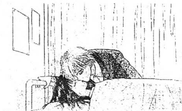
ภาพที่ 6.23 ความรักใคร่เสนาหา 9 จากการ์ตูนเรื่อง “มารมาเลตสุดที่รัก” (Mamalade Boy) ภาค 2 หน้า 146

ถัดมาการ์ตูนเรื่อง “อเล็กซานโดรท์” มีรูปแบบความรักใคร่เสนาหาอยู่มากเช่นกัน ได้แก่ นึ่งไถ่กัน สบตากัน ยิ้มให้กัน มองกันอย่างดูดีมี กอดกัน บอกกล่าวว่ารักกัน ซึ่งส่วนใหญ่ ฝ่ายชาย (อเล็กซ์ เรวิน) เป็นผู้แสดงความรักใคร่เสนาหาแก่ฝ่ายหญิง (แอมโบรเซียร์ ฮาร์ท) และมักจะกระทำต่อหน้าเพื่อนๆ ในสถานที่ต่างๆ เช่นในโรงอาหาร งานปาร์ตี้ ห้องพัก เป็นต้น ในการแสดงความรักใคร่ที่ปรากฏในการ์ตูนเรื่องนี้พบว่าฝ่ายชายชอบแสดงความออกต่อหน้าผู้คนมากมาย โดยเฉพาะเพื่อนๆ ไม่ว่าจะเป็นการจูบขอบคุณในความเป็นห่วงต่อหน้าเพื่อนๆ ในงานปาร์ตี้ การจูบนิ้วมือของแอมที่เซดลิปสติคจากแก้วน้ำบนโต๊ะกินข้าวต่อหน้าเพื่อนๆ ซึ่งการแสดงออกซึ่งความรักใคร่นี้ถ้ามองในบริบทวัฒนธรรมไทยพบว่าไม่ค่อยเหมาะสมที่จะแสดงออกอย่างโจ่งแจ้ง อีกทั้งอเล็กซ์และแอมยังมีได้เป็นคู่รักกันด้วยยังไม่เหมาะสม แต่ถ้ามองในบริบทของการ์ตูนเป็น