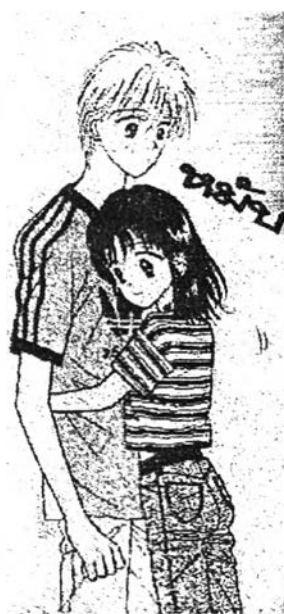
ภาพที่ 6.22 ความรักใคร่เสนาหา 8 จากการ์ตูนเรื่อง “มารมาเลตสุดที่รัก” (Mamalade Boy) ภาค 2 หน้า 146

กรรมที่ไม่เหมาะสม ถ้ามองในแง่ของหยอกเล่นของยูต้อมิก็ถือว่าไม่ควรทั้งๆ ที่รู้แต่ก็แกล้งซึ่งตัว มิเคก็ตกใจทำอะไรไม่ถูกนึ่งไปเพราะไม่คิดว่าจะถูกแกล้งแบบนี้ ส่วนของพฤติกรรมอื่นๆ ที่ปรากฏในการ์ตูนเรื่องนี้หลังจากที่ทั้งสองเป็นแฟนกันได้แก่ นึ่งไถ่กัน เดินจูงมือกัน จับมือกัน สบตากัน กอดกัน รวมไปถึงบอกรักกัน ซึ่งในการแสดงพฤติกรรมเหล่านี้มักจะทำกันในที่ลับตาคนเช่น ชายหาดที่ไม่มีคน ในบ้านที่พ่อแม่ไม่อยู่ ในห้องนอน หน้าห้องนอน ตู้เสื้อผ้าและสวนสาธารณะ ซึ่งเหมาะสมต่อการแสดงความรักใคร่เสนาหาซึ่งกันและกันของคู่รัก