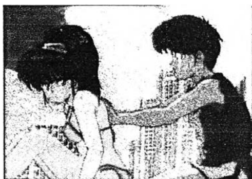
ภาพที่ 6.26 ความรักใคร่เสนาหา 12

จากเรื่อง "ถนนสายนี้เปรี้ยว" (Orange Road) ตอนพจญภัยในฮาวาย