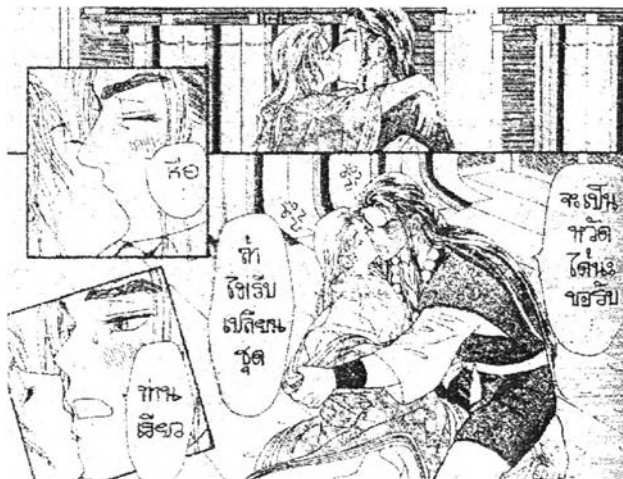
ภาพที่ 6.28 ความสัมพันธ์ทางเพศ 1 จากเรื่อง "เรียว" เล่มที่ 10 หน้า 47

ส่วนในการ์ตูนเรื่อง "เรียว" นั้นส่วนมากจะเป็นการเริ่มความต้องการมีความสัมพันธ์ทางเพศของทางฝ่ายหญิงก่อน (โทโฮยามะ เรียว) ซึ่งฝ่ายชาย (มุซาชิโอบิ เบนเค) คอยปฏิเสธที่จะมีความสัมพันธ์ทางเพศ ตั้งแต่เมื่อเรียวสารภาพรักกับเบนเคและพยายามรุกเร้าฝ่ายชาย แต่เบนเคมีสติพอที่จะยับยั้งการเรียกร้องของฝ่ายหญิงด้วยการจับตัวฝ่ายหญิงออกห่างจากตัวเองและพูดปฏิเสธอย่างชัดเจนแล้วเดินออกไปดังภาพ