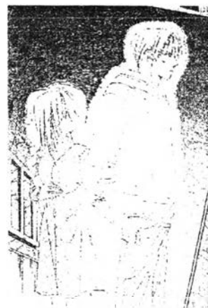
ภาพที่ 6.20 ความรักใคร่เสน่หา 6