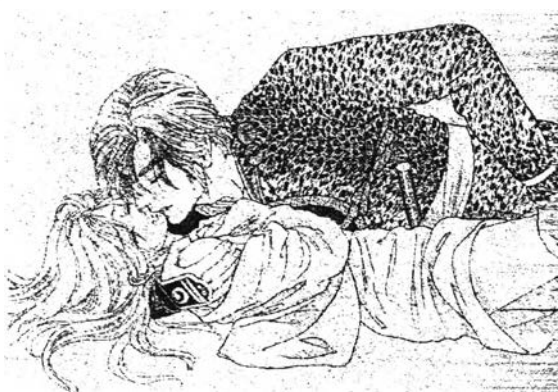
ภาพที่ 6.29 ความสัมพันธ์ทางเพศ 2 จากเรื่อง "เร็ว" เล่มที่ 12 หน้า 64

อย่างไรก็ตามเมื่อทั้งคู่ตกลงเป็นคู่อีกกันแล้วฝ่ายชายแสดงความต้องการมีความสัมพันธ์ทางเพศกันก่อนแต่งงานโดยอ้างเหตุผลว่าจะได้สามารถร้องขอไม่ให้ฝ่ายหญิงไปรบได้ซึ่งได้รับการปฏิเสธจากฝ่ายหญิง อีกทั้งการตัดสินใจเสนอประเด็นของรักษาความบริสุทธิ์ไว้เพื่อคนที่รัก กล่าวคือ ฝ่ายหญิงจะถูกบังคับให้แต่งงานแต่เร็วโดยไม่ต้องการอย่างนั้นจึงหนีทำให้เกิดการตามล่าตัวอยู่ตลอดเวลาซึ่งเร็วพยายามปกป้องตัวเองไว้ให้คนที่ตัวเองรักและจะแต่งงานด้วย และในตอนท้ายๆ ของเรื่องการ์ตูนยังนำเสนอรูปแบบความรักระหว่างพี่น้อง คือพี่ชายต่างแม่ของเร็วหลงรักเร็วแบบซู้สาวและต้องการได้ตัวเร็วโดยวางอุบายทำร้ายเบนเคและพยายามกักขังและข่มขืนเร็วซึ่งเร็วต่อสู้จนหนีรอดออกมาได้