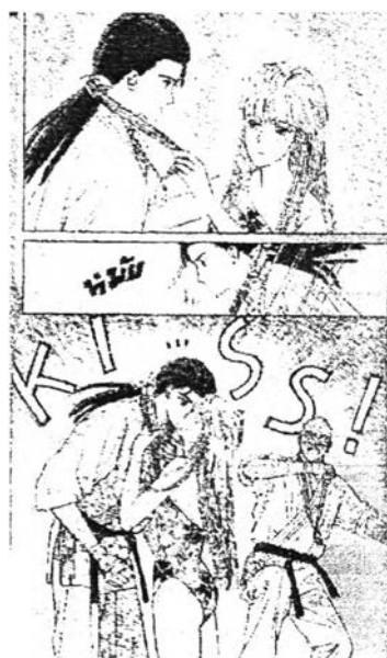
ภาพที่ 6.24 ความรักใคร่เสน่หา 10

สังคมมหาวิทยาลัยที่สหรัฐอเมริกาในวัฒนธรรมของตะวันตกไม่ถือว่าผิดอะไร อย่างไรก็ตามแอมก็มิได้ยินยอมให้อเล็กซ์แสดงความรักใคร่เสน่หาเพียงอย่างเดียว โดยแอมจะมีปฏิริยาตอบโต้ต่อพฤติกรรมของอเล็กซ์ เช่นบีบจมูกอเล็กซ์ ต่อว่าและอธิบายเมื่ออเล็กซ์เข้าใจความห่วงใยของแอมไปในทางซู้สาวและเข้ามาจูบ เป็นต้น ซึ่งปฏิริยาต่างๆ ของแอมแสดงให้เห็นถึงการแก้ไขสถานการณ์ให้เกิดความชัดเจนทั้งสองฝ่าย กล่าวพูดกล้าทำและกล้าปฏิเสธก่อให้เกิดความน่านับถือในตัวเอง เพราะไม่จำเป็นที่ฝ่ายหญิงจะต้องยอมรับการกระทำของฝ่ายชายทุกอย่างเช่นในการ์ตูนเรื่อง “สิงห์นักบิด สาวนักโบก” ที่ฝ่ายหญิง (อะโซ คิระ) ยอมให้ฝ่ายชาย (คาชิโน เร) แสดงความรักใคร่เสน่หาโดยไม่ได้แย้งอะไรเลย ในกรณีของการแสดงความรักใคร่เสน่หาของฝ่ายหญิงนั้นเมื่อแอมเริ่มมั่นใจว่าตนเองชอบอเล็กซ์แล้วก็จะอนุญาตให้อเล็กซ์แสดงความรักใคร่เสน่หาต่อตัวเองมากขึ้น เช่นยอมให้จูบ กอด และอุ้ม เป็นต้น และรวมไปถึงเป็นผู้แสดงออกซึ่งความรักใคร่เสน่หาเอง เช่นในตอนท้ายเรื่องที่แอมออกไปเชิญรางวัลและช่อดอกไม้ให้อเล็กซ์หลังการแข่งขันคาราเต้หลังจากให้ดอกไม้ก็ดึงอเล็กซ์ให้ก้มลงมาจูบต่อหน้าคนทั้งสนามแล้ววิ่งหนีไป เป็นการกระทำที่ผู้อาจเป็นการแสดงความกล้าหาญเพื่อบอกให้รู้ว่าตนเองก็ชอบอเล็กซ์แล้ว ซึ่งพฤติกรรมเช่นนี้ไม่ผิดที่จะกระทำแต่การแสดงพฤติกรรมเหล่านี้ในที่สาธารณะที่มีคนมากมายไม่ใช่เรื่องที่เหมาะสมที่จะกระทำซึ่งความกล้าแสดงออกเป็นสิ่งที่ดีแต่ควรให้เหมาะสมกับสถานที่และโอกาส