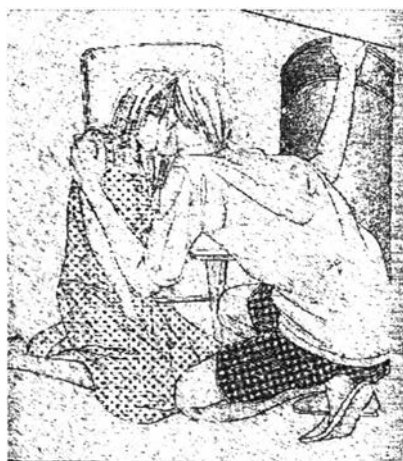
ภาพที่ 6.21 ความรักใคร่เสน่หา 7

จากการ์ตูนเรื่อง "พลัสวัน" (+1) เล่มที่ 3 หน้า 177