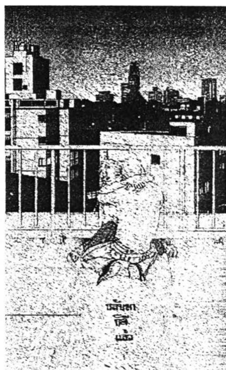
ภาพที่ 6.16 ความรักใคร่เสนหา 2 จากการ์ตูนเรื่อง "สิงห์นักบิณฑา นักโบก" (Mars) เล่มที่ 10 หน้า 48

การกอดกันสัมผัสตัวกันจะพบมากในการ์ตูนเรื่องนี้ตามสถานที่ต่างๆ แล้วแต่สถานที่การณ์ส่วนใหญ่จะกอดกันตอนที่ฝ่ายหนึ่งฝ่ายใดเสียใจ ตกใจ ดีใจ หรือซึ่งใจ ซึ่งในกรณีที่เสียใจจะเป็นการกอดเพื่อปลอบประโลมกัน อาจจะเป็นบริเวณริมถนน, ชายหาด, ในห้องพัก, หน้า