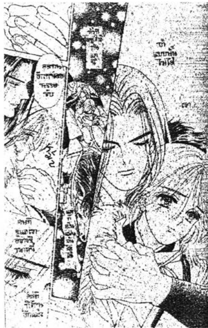
ภาพที่ 6.13 ความเอื้ออาทร 1 จากการ์ตูนเรื่อง “เรียว” (RYO) เล่มที่ 2 หน้า181

จากการวิเคราะห์การ์ตูนทั้ง 6 เรื่องจะเห็นว่าตัวละครทั้งฝ่ายชายและฝ่ายหญิง ต่างก็แสดงออกซึ่งความเอื้ออาทรซึ่งกันและกันตั้งแต่เริ่มมีการสนองตอบในทางบวก และยิ่งไปกว่านั้นเมื่อความสัมพันธ์ดำเนินลึกซึ้งยิ่งขึ้นความเอื้ออาทรต่างๆ ย่อมมีมากขึ้นตามมาเช่นกัน โดยเฉพาะอย่างยิ่งในยามที่มีปัญหาต่างๆ และความเอื้ออาทรนี้เองจะเป็นส่วนประกอบของความ สัมพันธ์ไปตลอด ดังตัวอย่างภาพด้านล่าง เป็นการแสดงความเอื้ออาทรระหว่างมุซาชิโอบ เบนเค และโทโอยามะ เรียว จากเรื่อง “เรียว” เมื่อต้องเดินทางไกลหนึ่การตามล่าหลังจากที่เรียวมั่นใจแล้วว่าชอบเบนเค เป็นการเดินทางข้ามเขตแดนด้วยม้าผ่านภูเขา ทุ่งหญ้าเป็นเวลานานจนเข้าฤดูหนาว เรียวเหน็ดเหนื่อยและหนาวจากการเดินทาง เบนเคจึงพยายามปลอบประโลมในระหว่างเส้นทาง