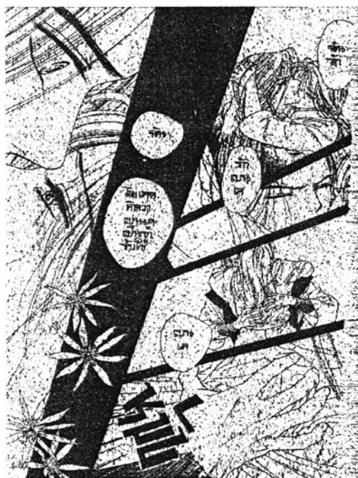
ภาพที่ 6.18 ภาพความรักใคร่เสน่หา 4

สำหรับการ์ตูนเรื่อง “เรียว” ก็เช่นเดียวกับการ์ตูนเรื่อง “สิงห์นักบิด สาวนักโบก” กล่าวคือเมื่อฝ่ายหญิง (โทโฮยามะ เรียว) เริ่มชอบฝ่ายชาย (มุซาชิโอบี เบนเค) และมั่นใจในความรู้สึกตนเองก็แสดงความรักใคร่เสน่หาอย่างชัดเจน เช่นการกอดกัน การนั่งใกล้ๆ กัน จับมือกัน เป็นต้น จนกระทั่งบอกกล่าวว่าจะชอบเบนเค ซึ่งในการ์ตูนเสนอให้เห็นถึงความรู้สึกเต็มเปี่ยมของความรักที่เรียวมีต่อเบนเคและต้องการจะบอกรักแม้ว่าตนและเบนเคจะอยู่ในฐานะนาย-บ่าวที่ไม่สามารถรักกันได้ก็ตามและรู้อยู่แล้วว่าเบนเคจะปฏิเสธเรียวก็ยังคงบอกรักเบนเค ในความเป็นจริงแล้วการแสดงความรู้สึกออกมาไม่ใช่สิ่งที่ผิดแต่รูปแบบของการแสดงออกมาในการ์ตูนแสดงให้เห็นถึงฝ่ายหญิงเรียวร้อง ร้องขอความเห็นใจจากฝ่ายชาย อีกทั้งยังรุกเร้าใกล้ชิดฝ่ายชายอีกและถูกฝ่ายชายปฏิเสธออกมาซึ่งทำให้มองภาพพจน์ของเรียวไม่ดีดังภาพตัวอย่างด้านล่าง