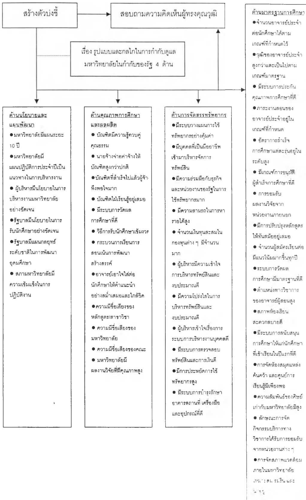
แผนภูมิที่ 17 แสดงรูปแบบการสร้างตัวบ่งชี้เพื่อการกำกับดูแลมหาวิทยาลัยในกำกับของรัฐ