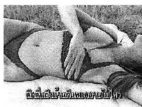
รูปที่ 4.10 ภาพการแสดงออกทางท่าทางในลักษณะยั่ววนในสื่อ VCD Karaoke

ภาพของผู้หญิงที่มีการแสดงออกทางท่าทางในลักษณะทำท่าย โดยคิดเป็นร้อยละ 86 ของภาพผู้หญิงจากกลุ่มตัวอย่างในสื่อคอมพิวเตอร์ที่เป็นภาพเคลื่อนไหวประกอบดนตรีฝึกหัดร้องเพลงหรือ VCD Karaoke โดยการแสดงออกทางท่าทางในลักษณะยั่ววนได้แก่ การเสยผมของตนเองไปมา การจับ เตะหรือบีบหน้าอก การทำท่าทางที่ไม่เปิดเผยให้เห็นอวัยวะเพศอย่างโจ่งแจ้ง ปิดบังด้วยมือหรือสิ่งอื่นๆ มีลักษณะยั่ววนสายตา ก่อให้เกิดความรู้สึกอยาก رؤ้อยากเห็น ลีกลับน่าค้นหา