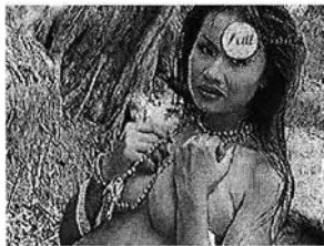
รูปที่ 4.7 ภาพการแสดงออกทางใบหน้าในลักษณะเชื้อเชิญ ในสื่อ VCD Karaoke

จากสื่อสิ่งพิมพ์ที่เป็นกลุ่มตัวอย่างในการวิจัยพบว่า ภาพของผู้หญิงที่มีการแสดงออกทางใบหน้าในลักษณะเชื้อเชิญมีมากเป็นอันดับที่สอง โดยคิดเป็นร้อยละ 20 ของภาพผู้หญิงที่เป็นกลุ่มตัวอย่างในสื่อคอมพิวเตอร์ที่เป็น VCD Karaoke การแสดงออกทางใบหน้าในลักษณะเชื้อเชิญนี้เป็นภาพของผู้หญิงที่มีการมองแบบประสานสายตากับกล้องในลักษณะจ้องมองหรือทึ่งสายตา และเผยอริมฝีปากออกจากกัน