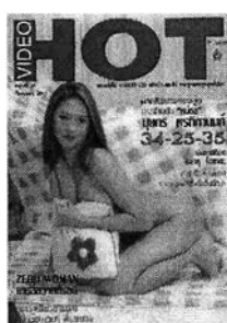
รูปที่ 4.6 ภาพการแสดงออกทางท่าทางในลักษณะยั่วยวน ในสื่อสิ่งพิมพ์

ภาพของผู้หญิงที่มีการแสดงออกทางท่าทางในลักษณะยั่วยวน โดยคิดเป็นร้อยละ 29 ของภาพผู้หญิงจากกลุ่มตัวอย่างในสื่อที่นำเสนอเรื่องราวทางเพศประเภทสื่อสิ่งพิมพ์ การแสดงออกทางท่าทางในลักษณะยั่วยวนได้แก่ การทำท่าทางที่ไม่เปิดเผยให้เห็นอวัยวะเพศอย่างโจ่งแจ้ง ปิดบังด้วยมือหรือสิ่งอื่นๆ มีลักษณะยั่วยวนสายตา ก่อให้เกิดความรู้สึกอยาก رؤ้อยากเห็น ลีกลีบนำค้นหา