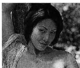
รูปที่ 4.1 ภาพการแสดงออกทางใบหน้าในลักษณะเชื้อเชิญ ในสื่อสิ่งพิมพ์

จากสื่อสิ่งพิมพ์ที่เป็นกลุ่มตัวอย่างในการวิจัยพบว่า ภาพของผู้หญิงไทยที่มีการแสดงออกทางใบหน้าในลักษณะเชื้อเชิญมีมากที่สุด คิดเป็นร้อยละ 56 ของภาพผู้หญิงไทยจากกลุ่มตัวอย่างในสื่อที่นำเสนอเรื่องราวทางเพศประเภทสื่อสิ่งพิมพ์ โดยภาพการแสดงออกทางใบหน้าในลักษณะเชื้อเชิญนี้เป็นภาพของผู้หญิงไทยที่มีการมองแบบประสานสายตากับกล้องในลักษณะจ้องมองหรือทิ้งสายตาและเผยริมฝีปากออกจากกัน