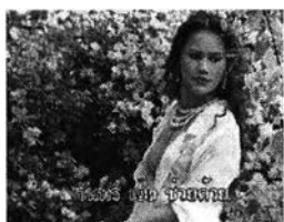
รูปที่ 4.14 การสวมใส่เสื้อผ้าที่โปร่งบาง พลิ้วไหว หรือฟูฟอง ในสื่อ VCD Karaoke

การสวมใส่เสื้อผ้าที่มีลักษณะที่โปร่งบาง พลิ้วไหว หรือฟูฟอง หมายถึงการสวมใส่เสื้อผ้าที่มีเนื้อผ้าโปร่งบางเบา หรือผ้าซาตินที่มีลักษณะเป็นมันลื่นและแนบตัว เช่น ชุดนอนประเภทชุดกระโปรงชั้นเดียวติดกัน หรือชุดเสื้อกับกางเกงขาสั้น โดยคิดเป็นร้อยละ 18 ของภาพผู้หญิงจากกลุ่มตัวอย่างในสื่อคอมพิวเตอร์ที่เป็น VCD Karaoke