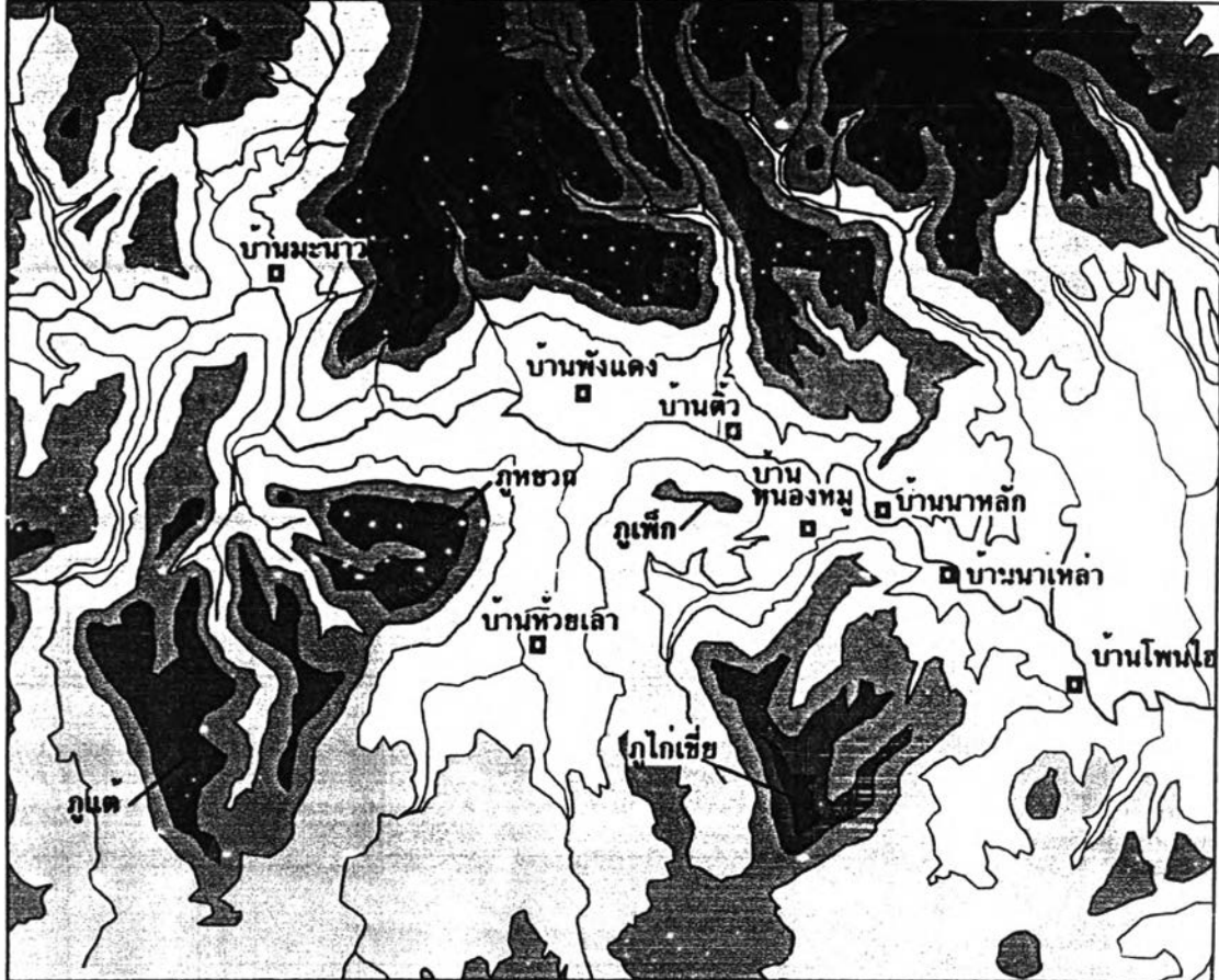
ภาพ 5.4 แผนที่แสดงที่ตั้งของหมู่บ้านในเขตงานสระบุรี

ผลกระทบด้านการทหารของกองป่าคือ รัศมีของปืน ค. มีขนาด 8 กิโลเมตร ทำให้การเคลื่อนไหวของกองป่าถูกจำกัดต้องเคลื่อนไหวเวลาดกลางคืน เพื่อใช้ความมืดอำพรางตัวและการสู้รบในรัศมี 8 กิโลเมตรเป็นไปอย่างยากลำบาก และรัฐบาลใช้ฐานเป็นจุดส่งกำลังย่อยๆ ออกเคลื่อนไหวให้สะดวกโดยมีปืน ค. ยิงคุ้มกันและสามารถควบคุมหมู่บ้านได้ถึง 3 หมู่บ้าน 56