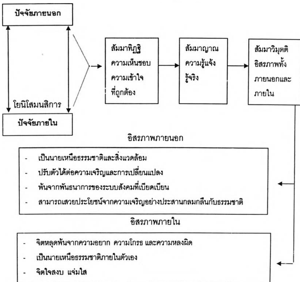
ภาพที่ 1 แผนภูมิแสดงระบบการสอนตามแนวพุทธวิธี (สุนทร อมรวิวัฒน์, 2526: 4)

เมื่อพัฒนาปัญญาถึงขั้นนี้ แม้ว่าศรัทธาจะยังคงเป็นตัวนำและหนุนให้ ใฝ่รู้ ใฝ่เรียนอยู่ แต่วิธีการพัฒนาปัญญาขั้นนี้จะเริ่มละศรัทธาความเชื่อ ความเลื่อมใสในคำสอนและตัวบุคคล โดยเริ่มการศึกษาหาความรู้ด้วยการปฏิบัติฝึกอบรม และคิดค้นโดยแยกกายด้วยตนเอง ทำให้เกิดความรู้ประเภทภาวนามยปัญญา เป็นความรู้ที่กระจ่างชัดลึกซึ้งบริสุทธิ์ ผุดผอง สว่างแจ้งขึ้น เรียกว่า "ความหยั่งรู้" หรือ "สัมมาญาณ" ปัญญาที่เกิดขึ้นในญาณนี้ ไม่ขึ้นกับความเห็นและเหตุผลอีกต่อไป เป็นปัญญาที่มองเห็นตามสภาวะที่เป็นจริงของชีวิตโดยแท้