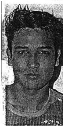
บัณฑิต สาวแก้ว

หนังสือพิมพ์ข่าวสด วันจันทร์ที่ 1 มีนาคม พ.ศ. 2542