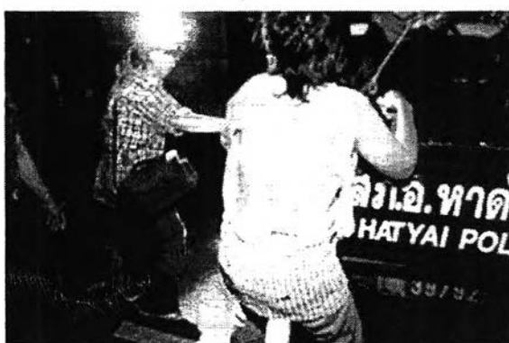
ภาพที่ 8: ภาพแสดงผู้หญิงที่ตกเป็นเหยื่อของความรุนแรง

จากภาพเป็นภาพที่แสดงให้เห็นถึงการกระทำที่ไม่ชอบธรรมของรัฐในการจัดการความขัดแย้ง โดยเฉพาะอย่างยิ่งการกระทำของเจ้าหน้าที่รัฐที่มีกำลังอำนาจต่อผู้หญิงที่ปราศจากอาวุธ ทำให้สะท้อนความรุนแรงที่เกิดขึ้นในเหตุการณ์ครั้งนั้นได้ และ ยังเป็นสามารถโน้มน้าวจิตใจผู้ที่ได้เห็นภาพได้เป็นอย่างดีถึงความรุนแรงที่เกิดขึ้น โดยเฉพาะการทำให้เสื้อผ้าที่ปกป้องร่างกายของผู้หญิงขาดวิน