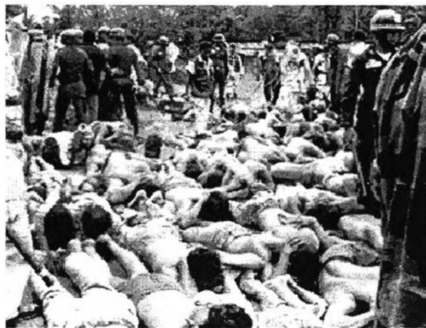
ภาพที่7: ภาพแสดงการจัดการความความขัดแย้ง

ในการนำเสนอเกี่ยวกับการจัดการความขัดแย้งโดยเฉพาะความขัดแย้งที่เกิดขึ้นจากโครงการพัฒนาของรัฐ เว็บไซต์ไทยเอ็นจีโอได้มีการนำเสนอปัญหาของการจัดการความขัดแย้งในประเทศไทยปัจจุบันที่รัฐมีการใช้อำนาจในการจัดการความขัดแย้ง โดยมีลักษณะของการใช้ความรุนแรงต่อประชาชนผู้เข้าคัดค้านโครงการของรัฐในโครงการก่อสร้างท่าอากาศยานนานาชาติและ ความขัดแย้งในกรณีชายแดนภาคใต้ โดยนำเสนอเมื่อวันที่ 5 พฤษภาคม พ.ศ. 2549 บทความนี้มีข้อเสนอถึงการลดการใช้ความรุนแรงในการแก้ปัญหาโดยการหันหน้าเข้าปรึกษาและหาหนทางในการแก้ปัญหาร่วมกันของผู้ที่เกี่ยวข้องแทนการใช้กำลังในการปะทะกันระหว่างฝ่ายตรงข้ามอย่างที่เคยเกิดในเหตุการณ์สลายการชุมนุมของผู้คัดค้านท่าอากาศยานนานาชาติ