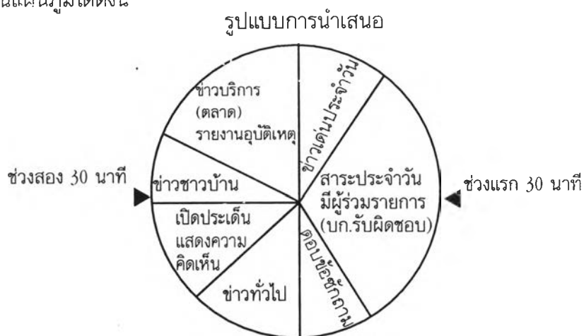
ภาพที่ 4 แผนภูมิรูปแบบการจัดรายการวิทยุชุมชนของคนโคราช

การจัดรูปแบบของเนื้อหาที่ออกอากาศในรายการวิทยุชุมชนของคนโคราช สามารถแสดงเป็นแผนภูมิได้ดังนี้