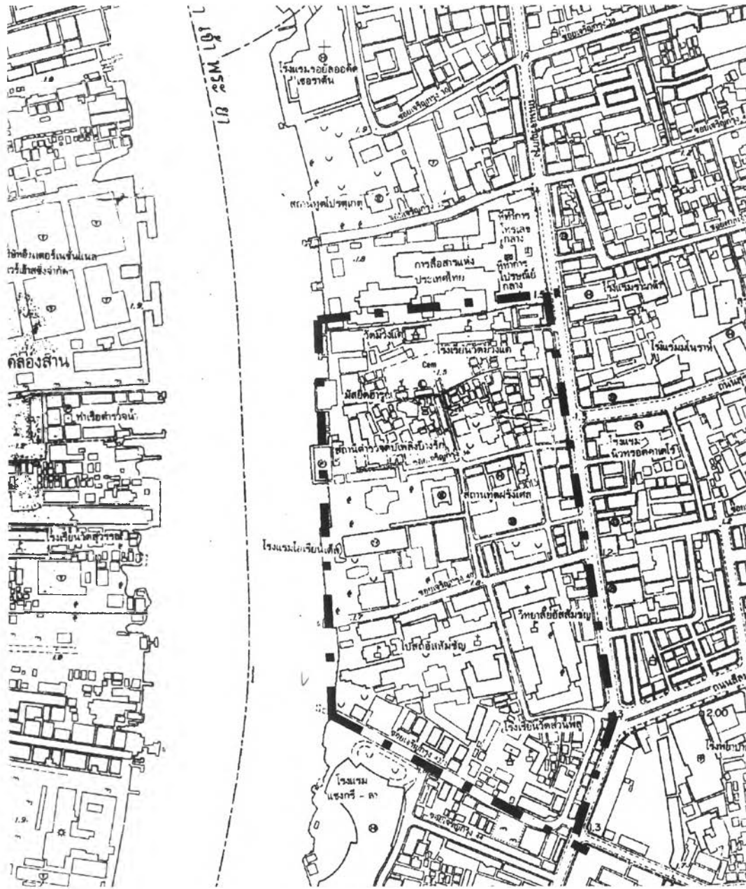
แผนที่ 1.1 ขอบเขตพื้นที่ศึกษา