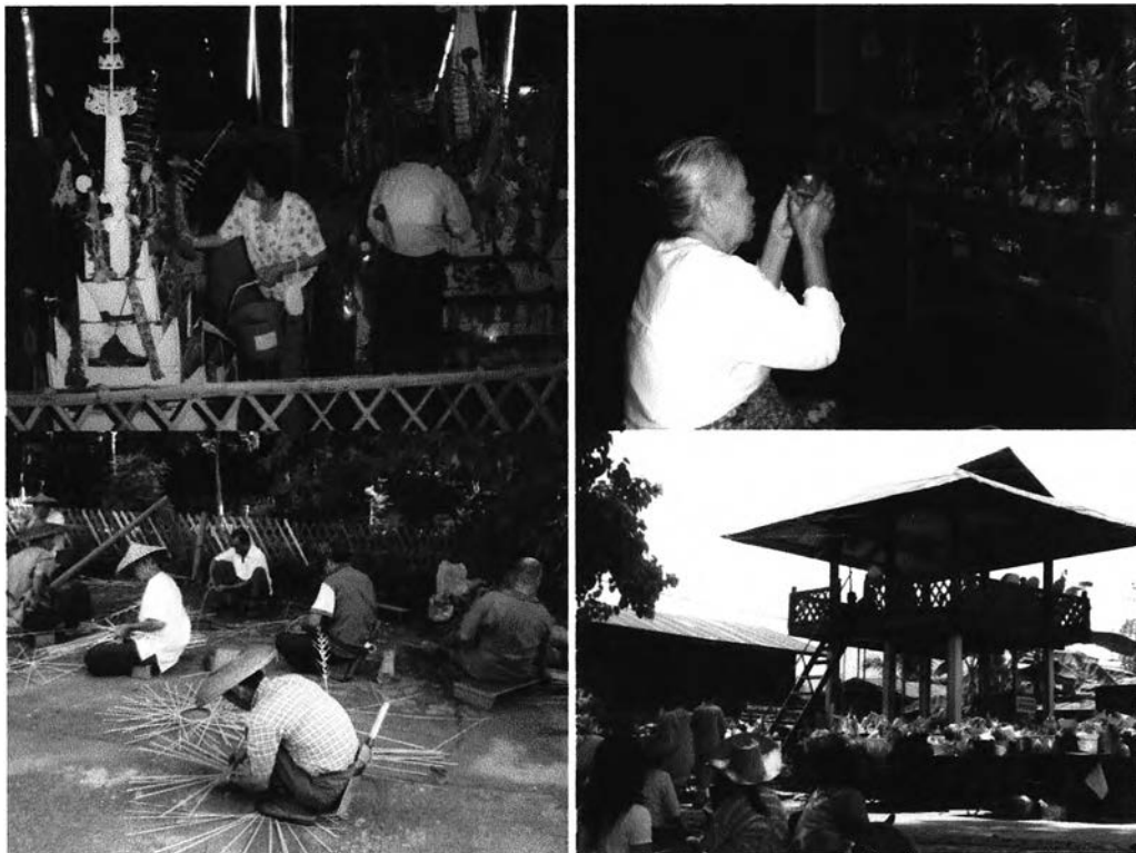
รูปที่ 3.2 แสดงการทำกิจกรรมร่วมกันของผู้คนภายในพื้นที่ชุมชน

3) วิเคราะห์บทบาทขององค์กรชุมชนทั้งที่เป็นทางการและไม่เป็นทางการในการช่วยกันรักษาและสืบต่อมรดกทางวัฒนธรรมเอาไว้ โดยวิเคราะห์กระบวนการทางสังคมและวัฒนธรรมของผู้คนในพื้นที่ชุมชน ในการจัดการมรดกทางวัฒนธรรมให้คงอยู่ การประกอบกิจกรรมของผู้คนในชุมชนและการใช้พื้นที่ รวมทั้งการเปลี่ยนแปลง อันจะเกิดขึ้นกับมรดกทางวัฒนธรรม โดยสรุปวิเคราะห์ในรูปแบบของแผนที่ ตารางและการบรรยายประกอบ