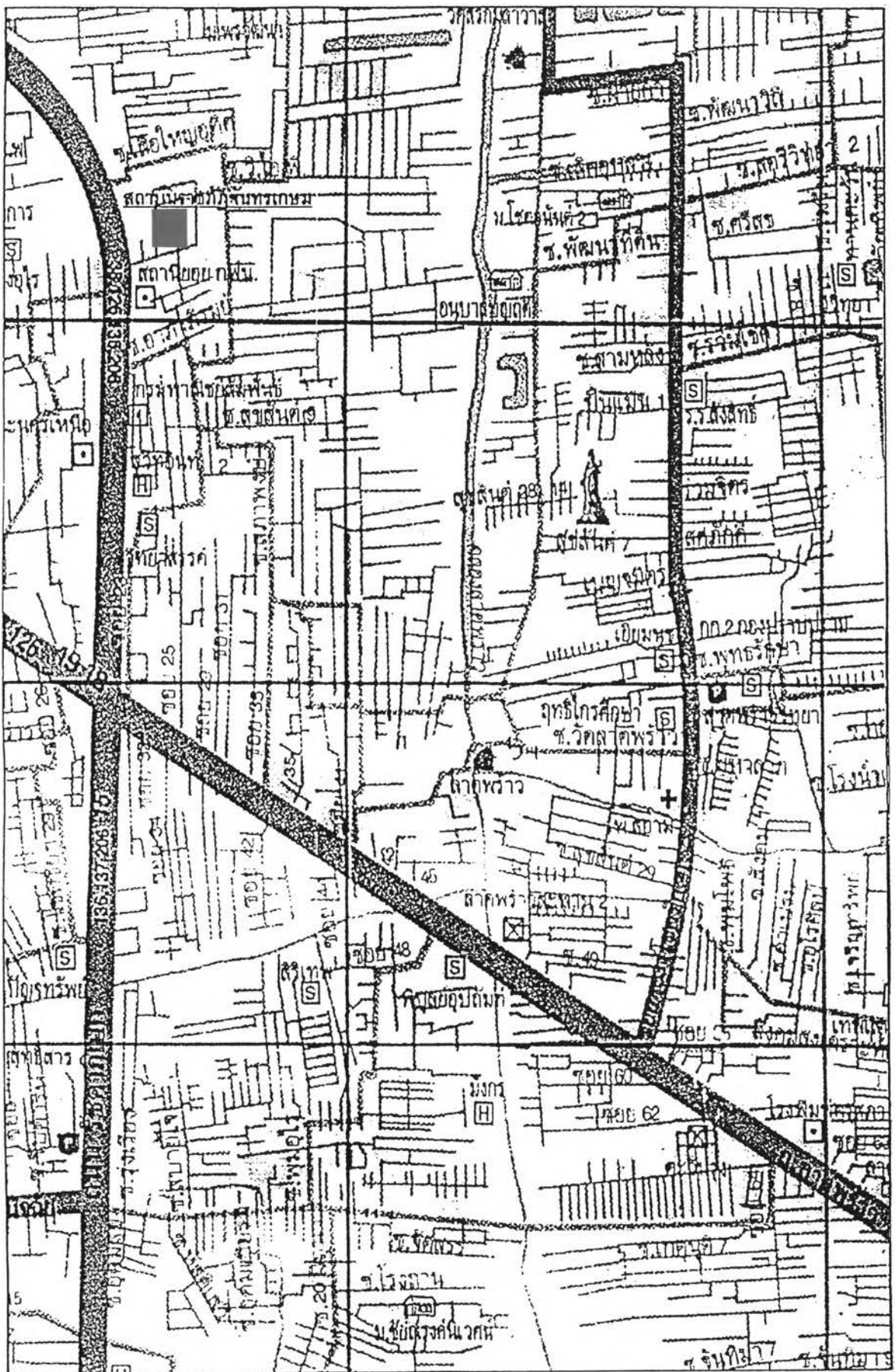
แผนภูมิที่ 3.2 แสดงแผนที่ตั้งสถาบันราชภัฏจันทรเกษม