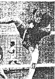
ชนบทกำลังมีบทบาทสำคัญในการพัฒนาประเทศไทยในยุคนี้