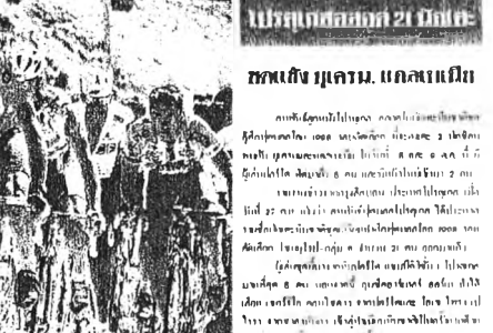
ชื่อคุณ นามสกุล

ข่าวด่วนเกี่ยวกับกีฬาทีมชาติไทย 20 ปีที่ผ่านมา