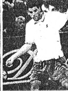
ชื่อคุณ นามสกุล

ข่าวข่าวด่วนเกี่ยวกับฟุตบอลทีมชาติไทย 20 ปีที่ผ่านมา