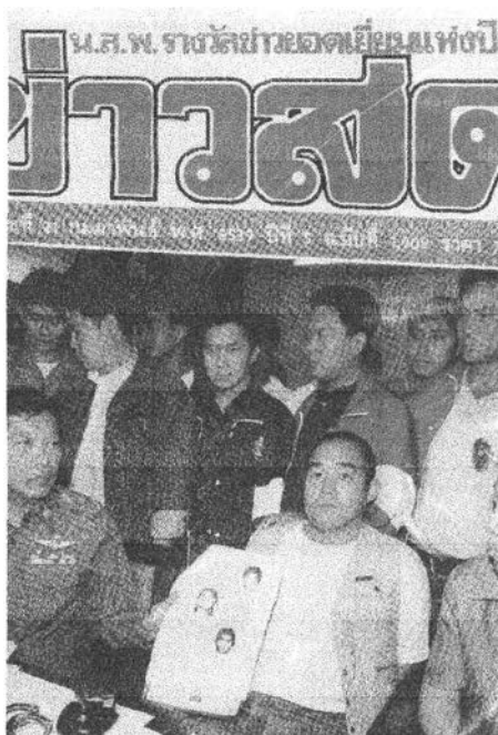
ภาพแถลงข่าวผลการจับกุมสมาชิกลัทธิ โอมชินริเกียว นักก่อการร้าย

( ก่อนตอบคำถามขอให้ดูภาพตัวอย่างจากหนังสือพิมพ์รายวันฉบับต่างๆ เป็นภาพกรณีเจ้าหน้าที่ตำรวจได้ทำการจับกุมผู้ต้องหา พร้อมของกลาง ในคดีความผิดต่างๆ และนำมาตั้งหรืออยู่ในสถานที่ที่จัดไว้เพื่อทำการแถลงข่าวผลการจับกุมต่อสื่อมวลชนเพื่อเผยแพร่ออกไป ดังตัวอย่างภาพต่อไปนี้ )