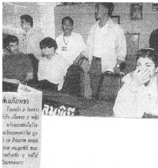
ภาพแถลงข่าวผลการจับกุมชาวปากีสถานซึ่ง ร่วมกันโจรกรรมแหวนเพชรมูลค่า 18 ล้านบาท