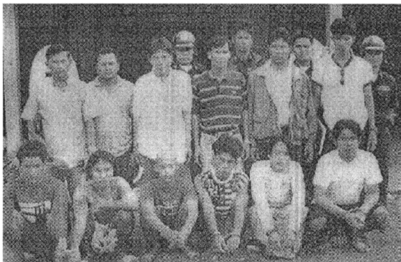
ภาพแสดงข่าวการจับกุมกลุ่มคนร้ายซึ่งร่วมกันฆ่าผู้อื่น