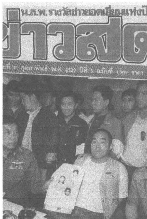
ภาพแดงข่าวการจับกุมผู้ก่อการร้ายสมาชิกโอมชินริตกียว