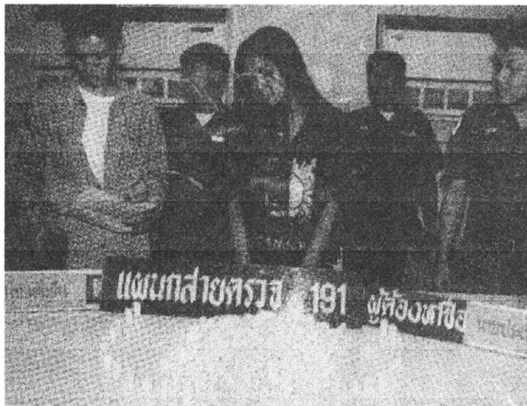
ภาพแถลงข่าวผลการจับกุมผู้ต้องหาพร้อมเฮโรอีนของกลาง