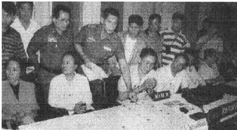
ภาพแถลงข่าวการจับกุมแก๊งคนร้าย 5 คนที่ร่วมกันฉ้อโกงทรัพย์ ธนาคารนครธน ด้วยเช็ค 10 ใบ จำนวน 500 ล้านบาท