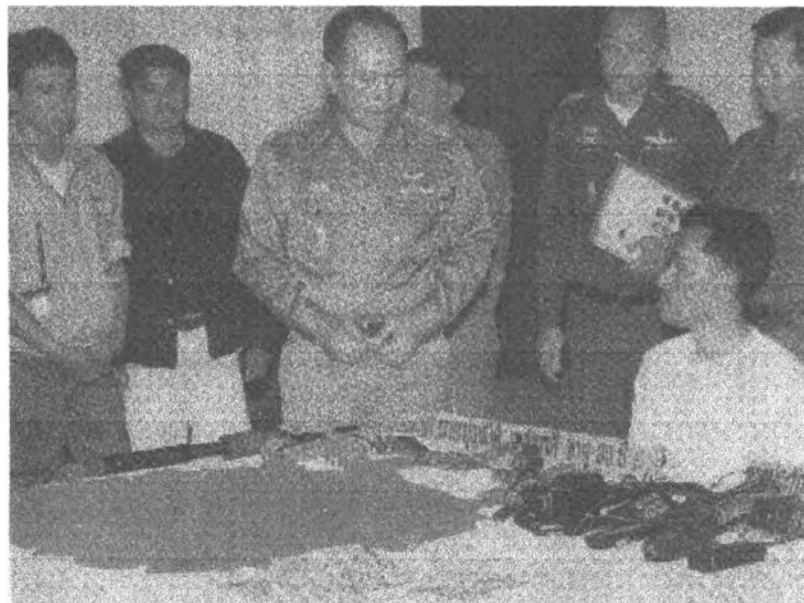
ภาพแสดงข่าวการจับกุมผู้ต้องหาพร้อมของกลางยาบ้านจำนวนมากซึ่งมีไว้จำหน่าย