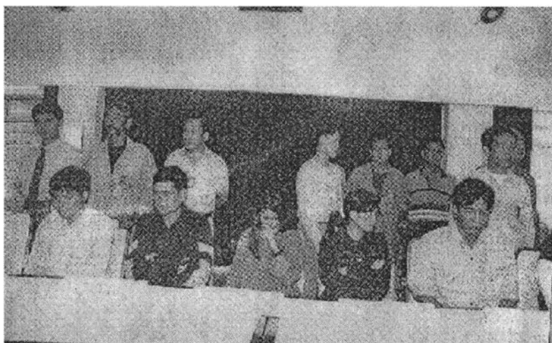
ภาพแสดงข่าวการจับกุมแก๊งคนร้ายหลอกดวงหญิงลาวมาขายตัว