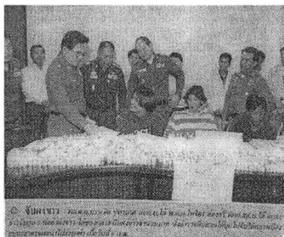
ภาพแสดงข่าวจับกุมผู้ต้องหาพร้อมของกลางเฮโรอีนจำนวนมาก