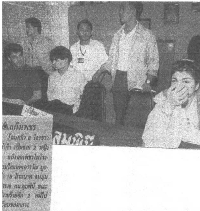
ภาพแสดงข่าวการจับกุมคนร้ายชาวปากีสถานที่เข้ามาลักทรัพย์เพชรในโรงแรมมูลค่า 18 ล้านบาท