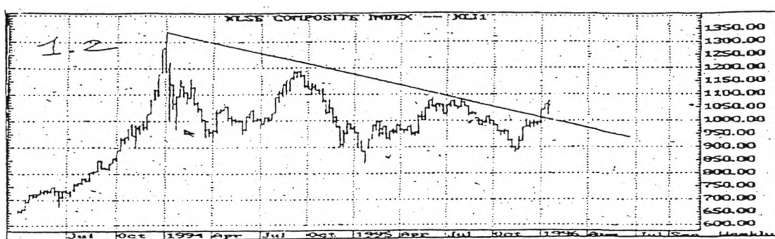
แผนภูมิที่ 1 ดัชนีตลาดหลักทรัพย์ของประเทศมาเลเซีย

ในรายงานหน้าที่ใช้เป็นข้อมูลในงานวิจัยนี้จะพบว่า มีปริจเฉททุกประเภทปรากฏ อยู่ในรายงานทุกชิ้น และนอกจากปริจเฉทประเภทต่างๆ ดังที่ได้กล่าวไปแล้ว ผู้วิจัยยังพบว่า ลักษณะที่พิเศษของอนุภาษานี้ อีกประการคือการใช้แผนภูมิ (graph) เข้ามาช่วยแสดงประกอบการ รายงานการวิเคราะห์หุ้น ซึ่งการใช้แผนภูมิในการช่วยแสดงนี้จะช่วยให้ผู้อ่านหรือนักลงทุน สามารถที่จะเห็นภาพพจน์และเข้าใจได้ดีกว่าการอธิบายอย่างธรรมดา ทำให้ผู้อ่านหรือนักลงทุน พิจารณาด้วยตัวเองได้ ดังจะขอยกตัวอย่างการใช้แผนภูมิเพื่อประกอบการรายงาน ดังตัวอย่าง ต่อไปนี้