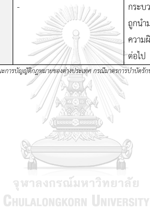
ตารางที่ 5 ตารางแสดงลักษณะการบัญญัติกฎหมายของต่างประเทศ กรณีมาตรการบำบัดรักษา