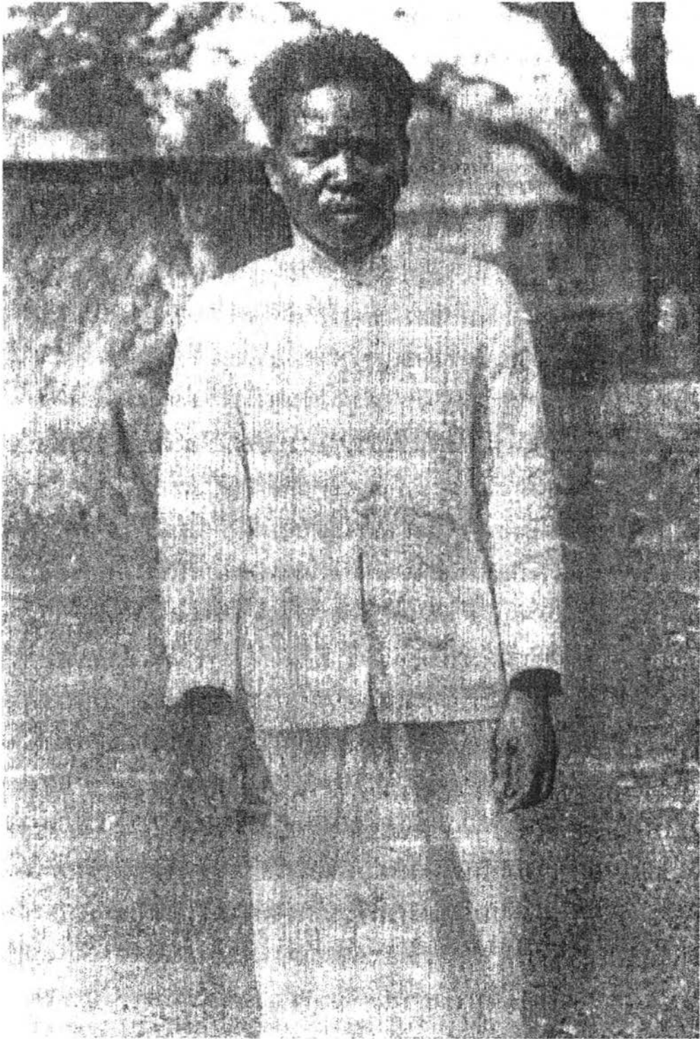
ภาพ 39. องค์แก้ว ผู้นำกบฏต่อต้านฝรั่งเศส