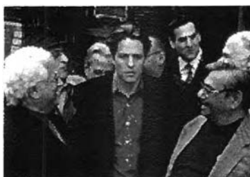
รูปภาพ 31 ภาพระหว่างการทำจาก Web Site ภาพยนตร์เรื่อง Mickey Blue Eyes