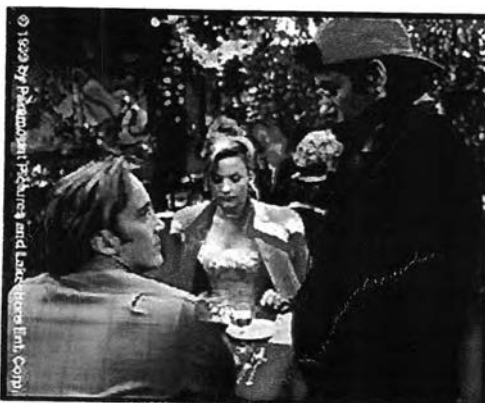
รูปภาพ 30 ภาพจากไนบาร์จาก Web Site ภาพยนตร์เรื่อง 200cigarettes