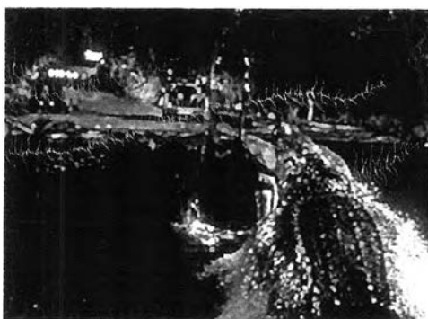
รูปภาพ 23 ภาพกระเช้าจาก Web Site ภาพยนตร์เรื่อง Lake Placid