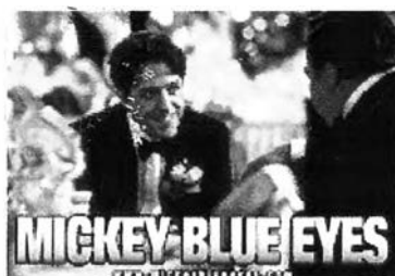
รูปภาพ 32 ภาพโปรชณียบัตรอิเล็กทรอนิกส์จาก Web Site ภาพยนตร์เรื่อง Mickey Blue Eyes