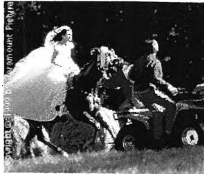
รูปภาพ 26 ภาพการถ่ายทำภาพยนตร์จาก Web Site ภาพยนตร์เรื่อง Runaway Bride