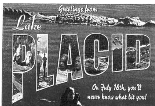
รูปภาพ 24 ภาพโปสเตอร์ยิปซีอิเล็กทรอนิกส์จาก Web Site ภาพยนตร์เรื่อง Lake Placid