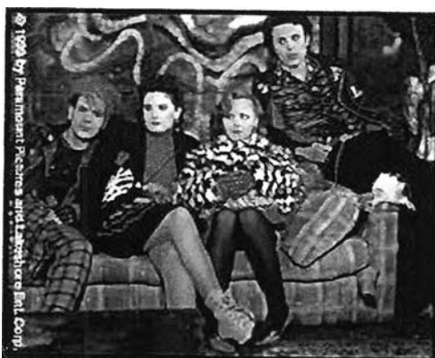
รูปภาพ 29 ภาพกลุ่มหนุ่มสาวจาก Web Site ภาพยนตร์เรื่อง 200cigarettes