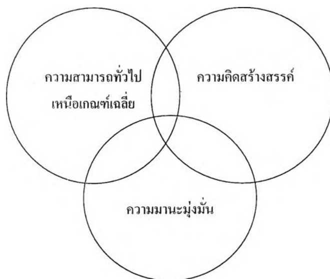
แผนภาพที่ 1 คุณลักษณะที่เกี่ยวข้องกัน 3 ด้านของความเป็น Giftedness

โดยผู้ที่มีความสามารถพิเศษจะต้องมีคุณลักษณะทั้งสามด้านประกอบกัน จะมีเพียงด้านใดด้านหนึ่งไม่ได้ ดังแผนภาพที่ 1