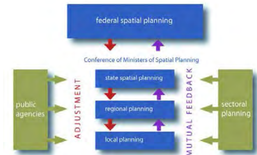
รูปภาพที่ 1 แสดงการวางแผนระดับล่าง การวางแผนเซกเตอร์และมาตรการสาธารณะ

ตามกฎหมายผังเมืองระดับสหพันธ์ การวางแผนผังเมืองเป็นภารกิจของรัฐบาลกลางคือ การมุ่งเน้นการวางแผนภาคและการลงทุนภาครัฐจากมุมมองของนโยบายโครงสร้างระดับภูมิภาคและระดับชาติ โดยการกำหนดแนวทางที่สำคัญและหลักการชี้แนะซึ่งให้แบบจำลองที่ครอบคลุมและเหนือกว่าสำหรับในระดับขึ้นจากระดับรัฐ ไปยังระดับภูมิภาค และระดับท้องถิ่นโยมีการปรับปรุงจากหน่วยงานภาครัฐและการตอบสนองจากผู้มีส่วนได้เสีย ตามรูปที่ 1 ดังจะเห็นได้ว่าการวางแผนระดับล่าง การวางแผนเซกเตอร์และมาตรการสาธารณะ (Pahl-Weber) 77 ที่มีผลต่อการพัฒนาเชิงพื้นที่ เป้าหมายของการกำกับดูแลโครงสร้างเชิงพื้นที่ของดินแดนแห่งชาติคือการสร้างสภาพความเป็นอยู่ที่เหมาะสมกันในทุกส่วนของประเทศ