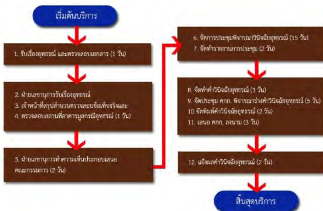
รูปภาพที่ 2 แสดงขั้นตอนการพิจารณาวินิจฉัยอุทธรณ์ตามพระราชบัญญัติการผังเมือง พ.ศ. 2518

การใด ๆ อันเป็นกรณีแห่งการอุทธรณ์ ("พระราชบัญญัติจัดตั้งศาลปกครองและวิธีพิจารณาคดีปกครอง พ.ศ. 2542," 2542f) 122 ทั้งนี้สามารถกำหนดแผนผังขั้นตอนการอุทธรณ์คำสั่งหรือการกระทำของเจ้าพนักงานตามพระราชบัญญัติการผังเมือง พ.ศ. 2518 ได้ดังนี้