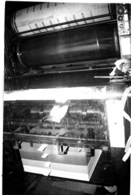
ภาพที่ 3.10 ภาพเครื่องพิมพ์ HEIDELBERGOFFSET OFFSET-LETTERSET

สำหรับกระดาษที่ใช้พิมพ์นั้น ขึ้นอยู่กับความต้องการของเจ้าของภาพยนตร์ อาทิ หากเป็นภาพยนตร์ที่ไม่เน้นการใช้โปสเตอร์เท่าใดนัก มักนิยมใช้กระดาษปริ้นธรรมดาหากเป็น ภาพยนตร์ฟอร์มใหญ่ อาทิ ของเชิด ทรงศรี มักนิยมใช้กระดาษอาร์ตมัน เป็นต้น