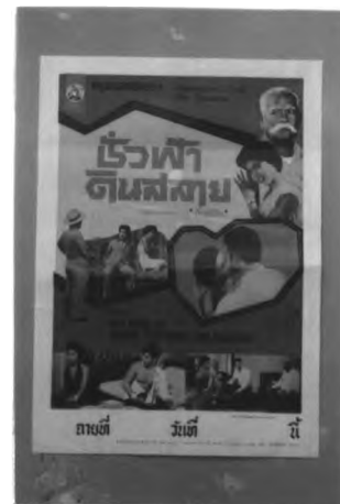
ภาพที่ 3.1 ตัวอย่างสีทั้งสองแบบที่ใช้ในโปสเตอร์ภาพยนตร์ไทย

โปสเตอร์ภาพยนตร์รูปแบบการนำเสนอแบบรูปตัดปะจากภาพถ่าย ไม่ค่อยได้รับความ สนใจจากบุคคลทั่วไปนักบทความที่เขียนถึงโปสเตอร์ในช่วงนี้ก็มักจะเขียนแบบคร่าวๆ และไม่ ปรากฏชื่อบุคคลหรือบริษัทผู้จัดทำ ทำให้ข้อมูลส่วนนี้ขาดหายไปอย่างน่าเสียดาย จากการ สัมภาษณ์คุณชวนะ บุญชู (3 มีนาคม 2537)กล่าวว่ารู้จักเพียง 2 คน คือ ชูวิทย์ โพธิ์เพิ่มเหม กับ นิพนธ์ ส่วนคนอื่นๆ นั้นไม่ทราบ โปสเตอร์ภาพยนตร์ไทยรูปแบบนี้ถูกผลิตต่อเนื่องมาเป็น เวลาหลายสิบปีจนกระทั่งปีพ.ศ. 2509 จึงหยุดผลิต