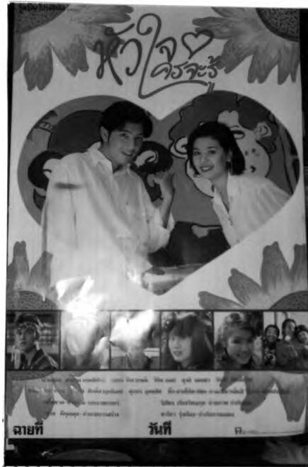
ภาพที่ 3.9 ตัวอย่างภาพที่พิมพ์จากแม่พิมพ์ทั้ง 4 สี

(3) ขั้นตอนการพิมพ์ เครื่องพิมพ์ที่นิยมใช้กันในปัจจุบันส่วนมากเป็นของ HEIDELBERG OFFSET-LETTERSET 61X82 CM.-24X32 1/2 " ขั้นตอนนี้สิ่งที่สำคัญที่สุดคือ การผสมสี เพื่อให้สวยงามดังต้นฉบับ สีที่ใช้เป็นสีที่สำหรับการพิมพ์โดยเฉพาะมี 4 สีเหมือนแม่พิมพ์ หากว่าต้องการสีที่ผิดแปลกไปจากสีที่มีอยู่ข้างจะต้องเป็นผู้ผสมใหม่และใช้การพิมพ์ทับช่วย ในการพิมพ์ด้วยแม่พิมพ์นี้จะพิมพ์ทีละสีจนครบ โดยพิมพ์แบบ"เปียกบนเปียก" เป็นการพิมพ์แบบต่อเนื่องโดยไม่ต้องรอให้สีแรกแห้งก่อนแล้วจึงพิมพ์สีต่อไป ฉะนั้นจะต้องพิมพ์ถึง 4 ครั้งจึงจะเสร็จ เป็นโปสเตอร์ดังที่เห็นทั่วไป