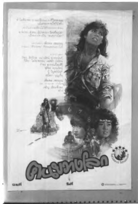
ภาพที่ 3.5 ตัวอย่างภาพที่ลงสีเสร็จแล้วแต่ยังไม่ได้ใส่ตัวอักษร