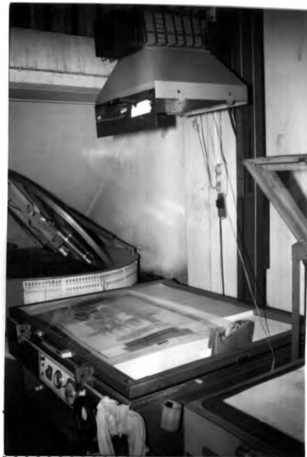
ภาพที่ 3.6 ภาพกล้องถ่ายฟิล์ม