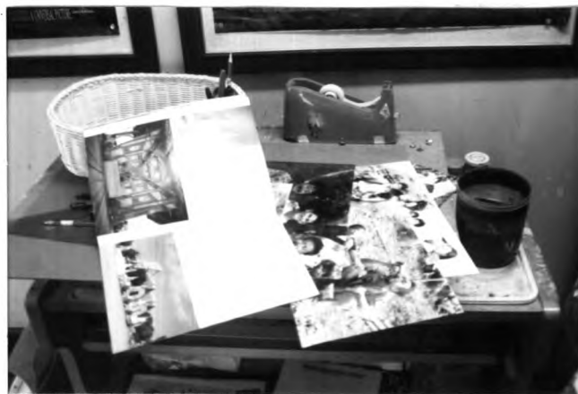
ภาพที่ 3.2 ตัวอย่างรูปถ่ายที่ได้รับการขยายแล้ว