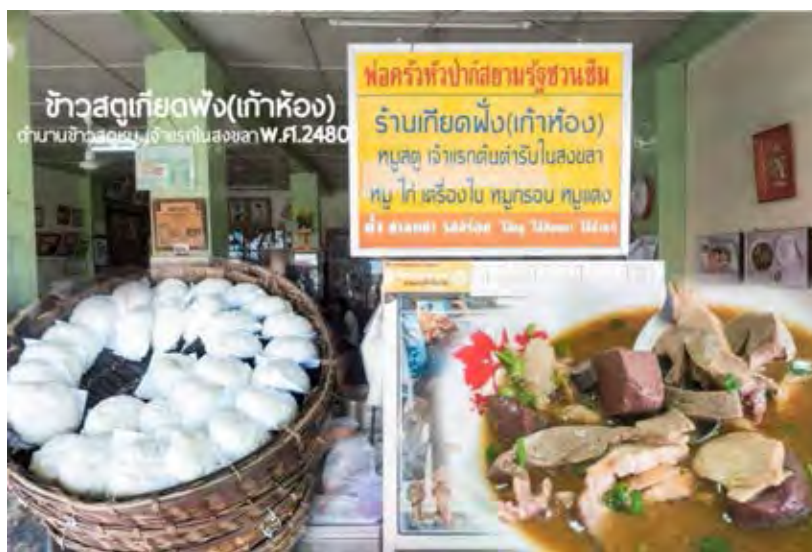
ภาพที่ 2. 4สตูเกียดฟิ่ง