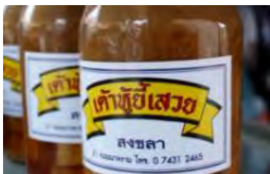
ภาพที่ 2. 3 เต้าหู้ยี้เสวย

เต้าหู้ยี้เสวย เป็นที่รู้จักกันดี เก้าแก่ทำขายมานานกว่า 100 ปี ตั้งแต่สมัยรัชกาลที่ 5 เป็นของฝากที่ระลึกที่ขึ้นชื่อของสงขลา เนื่องจากมีหนึ่งเดียว