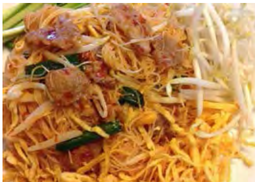
ภาพที่ 2. 14 หมีผัดโบราณ

หมีผัดโบราณ หมีฮุ้นผัดเปียก ผัดไส้ยคล่อง จะมีขายช่วงเย็นถึงค่ำ ทำขายมานาน ใช้เส้นหมีฮุ้นผัดใส่ เต้าหู้หมู โดยผัดในกระทะใหญ่ครั้งละ จำนวนมากจนตามจำนวนคนสั่ง เวลาตักแบ่งใส่จานใครคล่องหรือเฮง(โชคดี) ก็ได้ส่วนแบ่ง หมู เต้าหู้มาก ใครไส้ยหรือชวย(โชคไม่ดี) ก็ได้หมู เต้าหู้เพียงไม่กี่ชิ้น หรือไม่ได้เลย