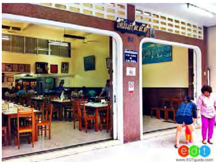
ภาพที่ 2. 6ร้านแต้

ร้านแต้ เป็นร้านอาหารจีนเก่าแก่ มีชื่อเสียงมี เพียงคูหาเดียวแชกต้องจองควลวงหน้า