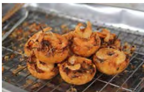
ภาพที่ 2. 9 ขนมหวั๊ก

ขนมหวั๊ก เป็นขนมพื้นเมืองภาคใต้โบราณ จะใช้วิธีการทอดแป้งที่ผสมด้วยข้าวสอย ถังเขียว บดลงในจวัก โรยด้วยถั่วอก กุยช่าย วางกุ้งสด นำทอดในกระทะจนกรอบ ให้กินกับน้ำจิ้ม ที่รสชาติออกหวานนำเผ็ด และเปรี้ยว