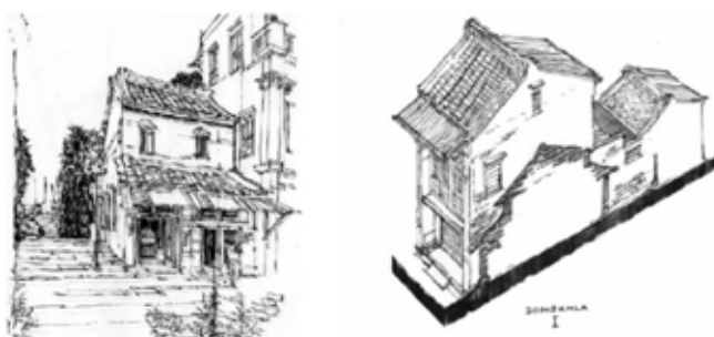
ภาพที่ 2. 17 ตึกแถวแบบจีนสมัยใหม่

ได้รับอิทธิพลจากตะวันตก อาคารอยู่ในช่วงอายุตั้งแต่ 40 ปีขึ้นไป มีแผงปกปิดหลังคา และจะมีอักษรแสดงปีพ.ศ.ปรากฏบนแผงดังกล่าว บางหลังมีหลังคาจั่ว หรือปั้นหยาซ้อนอยู่ บางหลังเป็นหลังคา คสล. ส่วนใหญ่มักมีตั้งแต่ 2-4 ชั้น อาคารลักษณะดังกล่าวยังคงปรากฏอยู่อย่างมากในปัจจุบัน และยังคงใช้พื้นที่ใช้สอยภายในเพื่อการค้าขายเป็นส่วนใหญ่