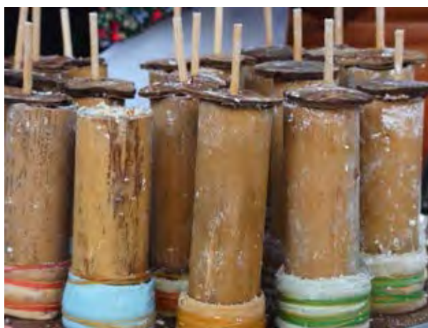
ภาพที่ 2. 5ขนมบอกร

ขนมบอกร เป็นขนมพื้นบ้านที่นบวันหากินได้ยาก มีเหลือให้เห็นไม่เกิน 2 เจ้า ทำด้วยแป้งข้าวเหนียวนึ่งในกระบอกไม้ไผ่ หรือ อกระบอกโลหะผ่านความร้อนด้วยไอน้ำจนสุก คลุกมะพร้าวขูด และ ถั่วเขียวผ่าซีกคั่ว