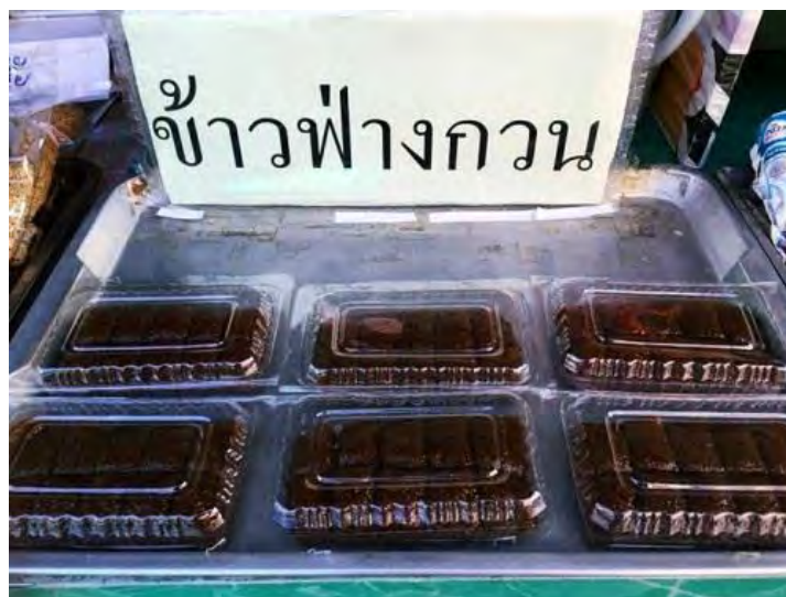
ภาพที่ 2. 8 ข้าวฟ่างกวน

ข้าวฟ่างกวน ก็เป็นขนมที่หากินยาก ต้องรอส่งกินขนมอร่อยต้องทำใจ มีอยู่เจ้าเดียว ยังไม่มีการสืบทอด