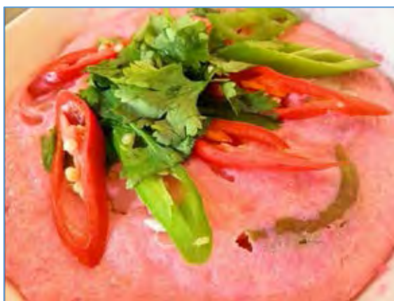
ภาพที่ 2. 2 แป้งแดง