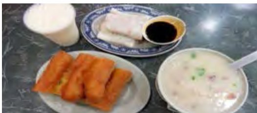
ภาพที่ 2. 13 โจ๊กร้านเกาะไทย