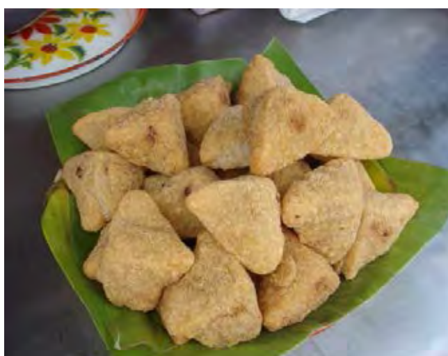
ภาพที่ 2. 7ขนมค้ำควา

ขนมค้ำควา เป็นขนมไทยโบราณที่สืบทอดกันมาจากรุ่นปู่ รุ่นย่า นานกว่า 100 ปี มีเฉพาะในสงขลาเท่านั้น ปัจจุบันหาकिनยากไม่ค่อยทำขาย ต้องสั่งทำ (ของป้าสว่างศรี พรหมศาสตร์) เนื่องจากขั้นตอนการทำยุ่งยาก ต้องใช้ความประณีตและความชำนาญ ทายาทรุ่นลูกรุ่นหลานไม่ยอมสืบทอดเป็นขนมที่มีรูปร่างคล้ายค้ำควา ใส้ทำจากกุ้งสดลวก หุ้มด้วยแป้งข้าวเหนียวนวดด้วยกะทิ นำไปทอดจนเหลืองแบบกรอบนอกอ่อนใน