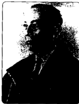
ศาสตราจารย์ ดร.แนบ นิละนี