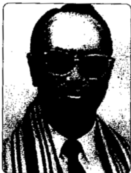
ศาสตราจารย์ อรุณ สรเทศน์