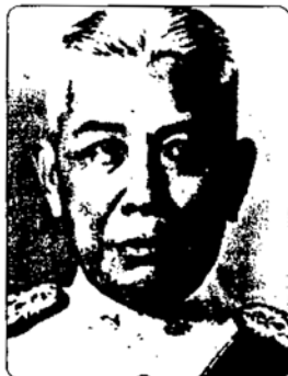
พลอากาศโท อนุมัติ มหาสังคมนตรี เวชยันตรังสฤษดิ์