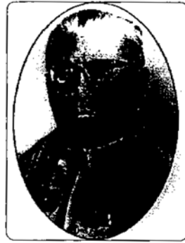
มหาอำมาตย์ตรี พระยาภะรตราชา (ม.ล.ทศทิศ อิศรเสนา)