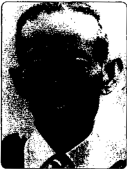
หม่อมเจ้ารัชฎาภิเชก โสณกุล