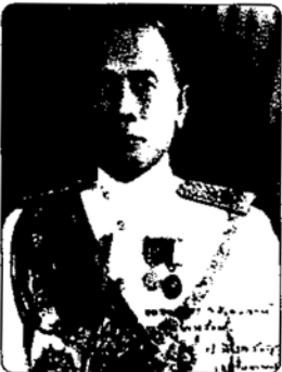
พันเอก หลวงพิบูลสงคราม (จอมพลแปลก พิบูลสงคราม)