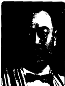
พลเอก ประภาส จารุเสถียร