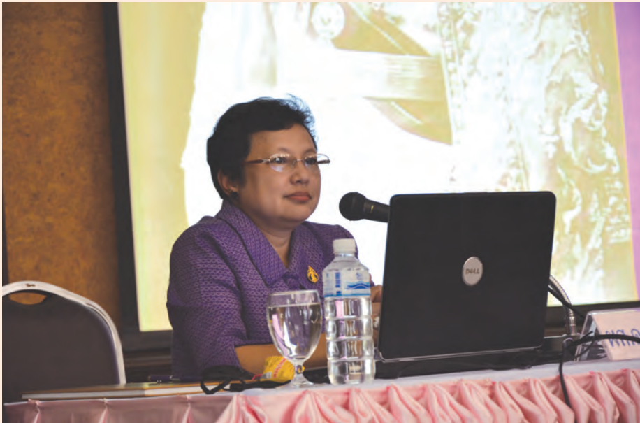
ปาฐกถาครั้งที่ ๘ วันศุกร์ที่ ๑๓ ก.ค. ๒๕๕๕ เรื่อง “สมเด็จพระกรมพระยาดำรงราชานุภาพ กับงานโบราณคดี”