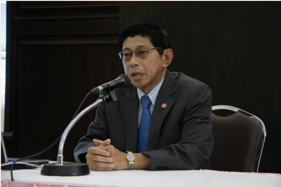
ปาฐกถาครั้งที่ ๗ วันศุกร์ที่ ๑๕ มิ.ย. ๒๕๕๕ เรื่อง “สมเด็จพระกรมพระยาดำรงราชานุภาพ กับการปกครอง”