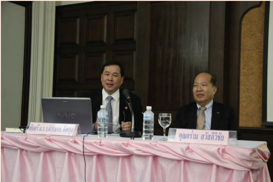
ปาฐกถาครั้งที่ ๔ วันศุกร์ที่ ๔ พ.ค. ๒๕๕๕ เรื่อง “เรื่องน่ารู้เกี่ยวกับสมเด็จพระยา ดำรงราชานุภาพ”