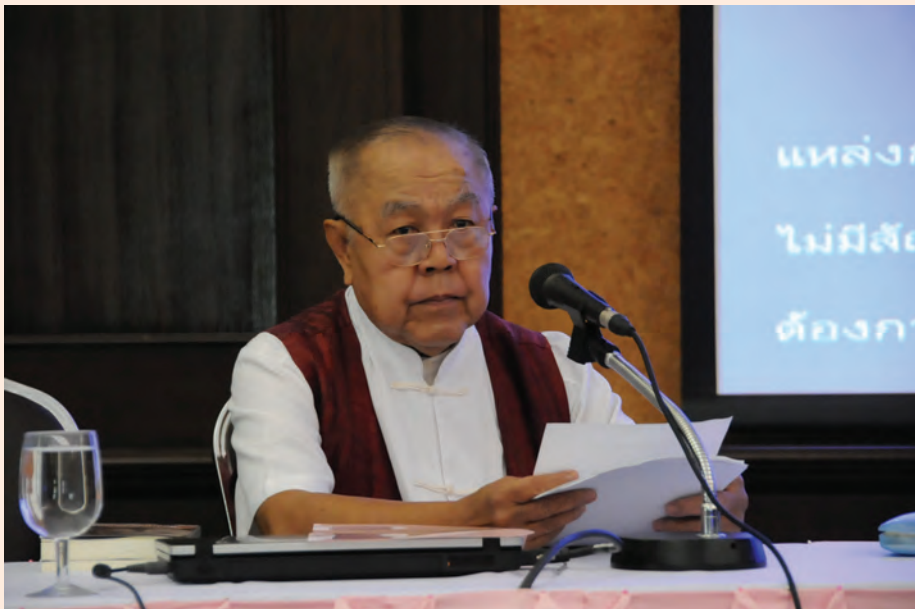
ปาฐกถาครั้งที่ ๕ วันศุกร์ที่ ๑๘ พ.ค. ๒๕๕๕ เรื่อง “สมเด็จพระยาดำรงราชานุภาพ กับคนร่วมสมัย”