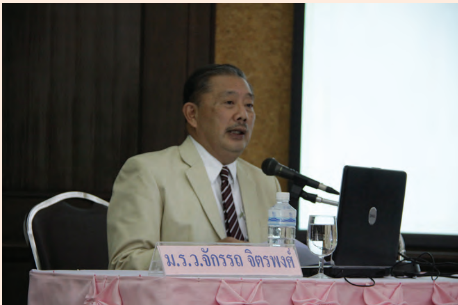
ปาฐกถาครั้งที่ ๖ วันศุกร์ที่ ๑ มิ.ย. ๒๕๕๕ เรื่อง “วีรกรรมของสมเด็จพระเจ้าบรมวงศ์เธอ กรมพระยาดำรงราชานุภาพ”