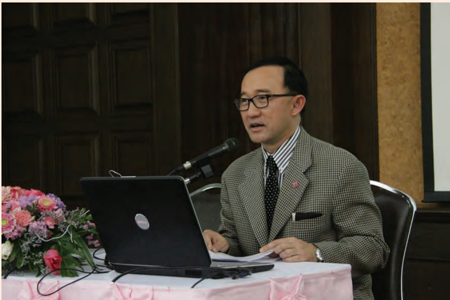
ปาฐกถาครั้งที่ ๑ วันศุกร์ที่ ๖ มกราคม ๒๕๕๕ เรื่อง “๑๕๐ ปีสมเด็จพระเจ้าบรมวงศ์เธอ กรมพระยาดำรงราชานุภาพ”