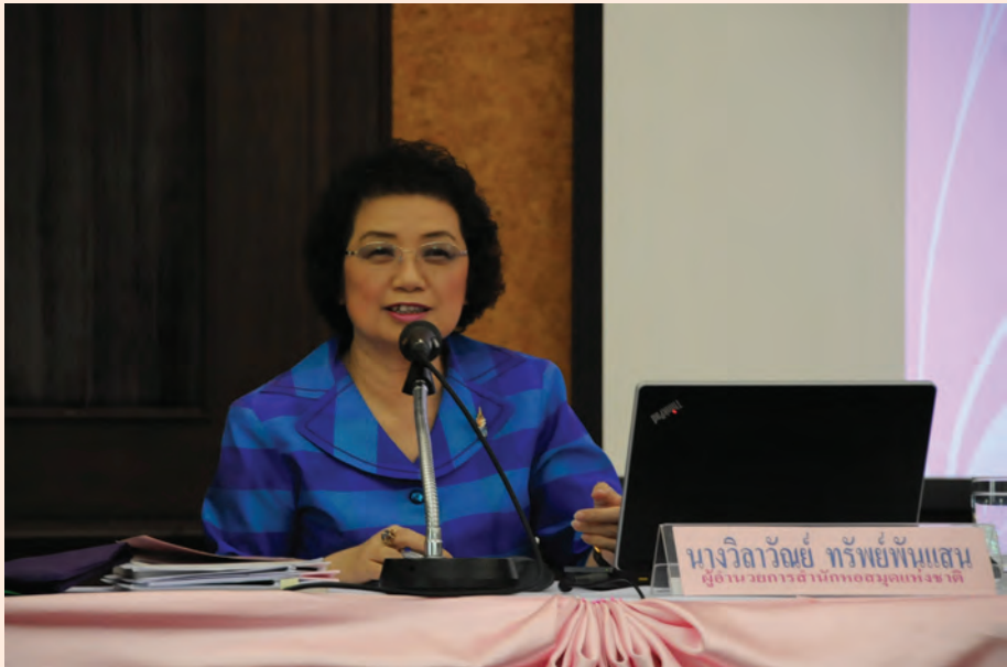
ปาฐกถาครั้งที่ ๓ วันศุกร์ที่ ๓๐ มี.ค. ๒๕๕๕ เรื่อง “สมเด็จพระยาตำราจราชานุภาพ กับตำนานหอสมุดแห่งชาติ”