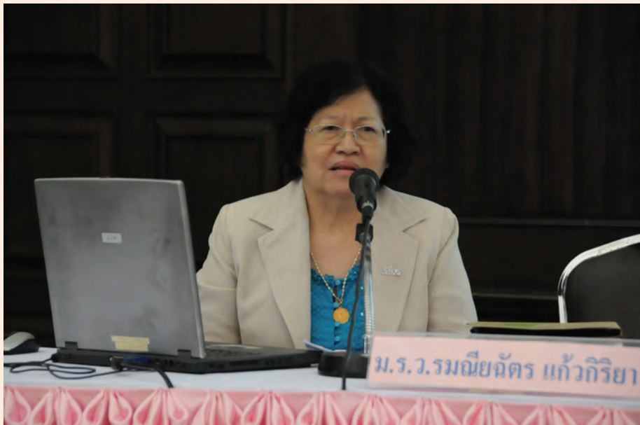
ปาฐกถาครั้งที่ ๙ วันศุกร์ที่ ๒๔ ส.ค. ๒๕๕๕ เรื่อง “ปู่ของฉันชื่อดำรงราชานุภาพ”