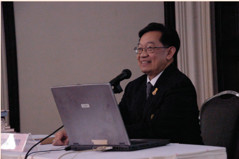
ปาฐกถาครั้งที่ ๒ วันศุกร์ที่ ๑๐ ก.พ. ๒๕๕๕ เรื่อง “สาส์นสมเด็จพระเจ้า”