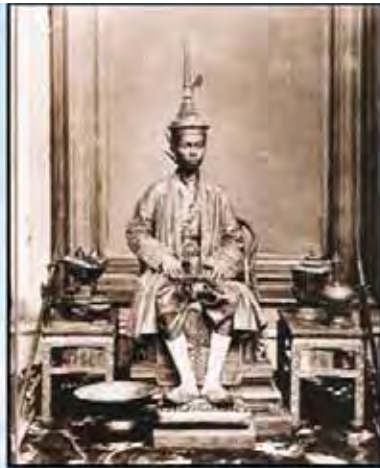
“อเนกนิกรสโมสรสมมติ”

พระสงฆ์ พระราชวงศ์ ขุนนาง และประชาชน เห็นต้องให้เสด็จขึ้นครองราชย์