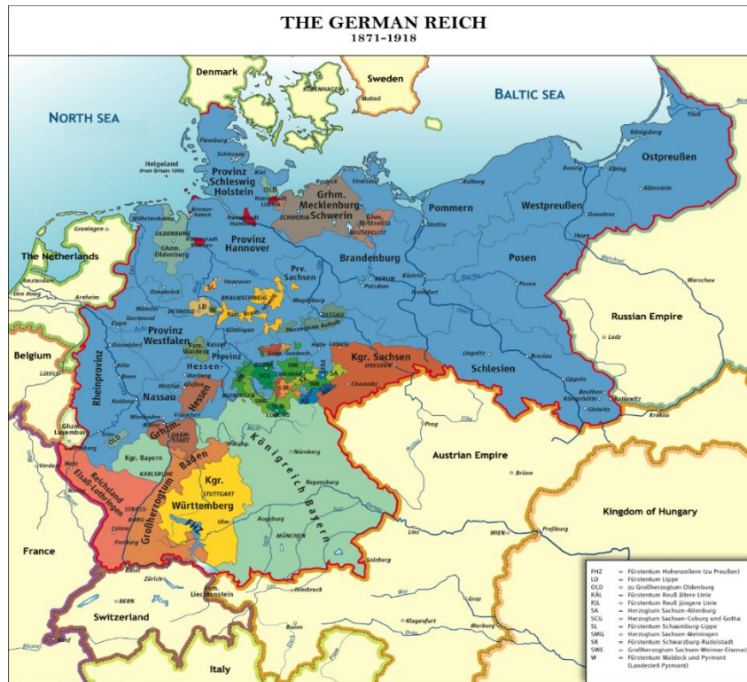
ภาพที่ 5 แผนที่แสดงจักรวรรดิเยอรมัน ค.ศ.1871-1918 และที่ตั้งของเคอนิกส์เบิร์ก

จึงกลายมาเป็นส่วนหนึ่งของจักรวรรดิ โดยเป็นจังหวัดทางตะวันออกสุด มีพรมแดนด้านทิศเหนือ ทิศตะวันออก และทิศใต้ติดต่อกับจักรวรรดิรัสเซีย และยังคงเป็นศูนย์กลางทางเศรษฐกิจและวัฒนธรรม ที่สำคัญทางชายฝั่งทะเลบอลติกสืบมา