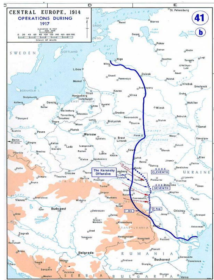
ภาพที่ 6 แผนที่แสดงแนวรบด้านตะวันออกใน ค.ศ. 1917