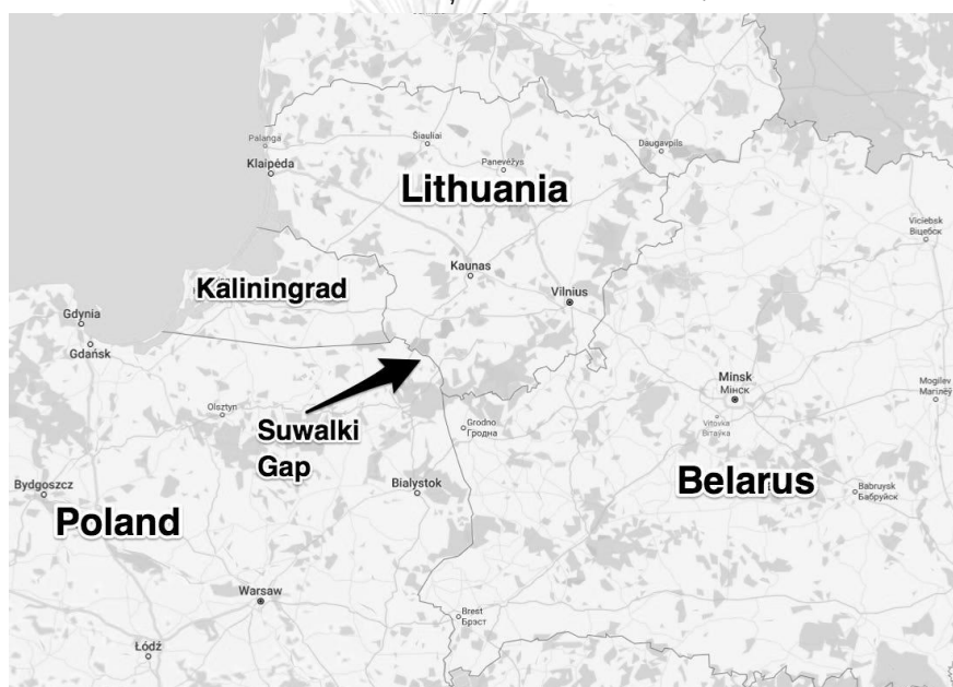
ภาพที่ 10 ฉนวนสุวอลกี (Suwalki Gap)

ที่มา: Logan Nye, "Here's why a 60-mile chunk of border could become ground zero in a war between Russia and NATO," Business Insider (Online) Available from: https://www.businessinsider.com/why-suwalki-gap-could-become-focus-of-war-between-russia-and-nato-2018-12 (15 July 2021)