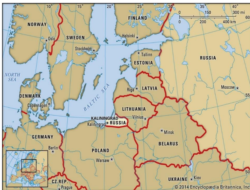
ภาพที่ 1 แผนที่แสดงที่ตั้งของรัฐและเมืองคาลินินกราด (Encyclopedia Britannica, 2014)

แนวโน้มเกี่ยวกับประเด็นความมั่นคงและการเผชิญหน้าระหว่างมหาอำนาจทั้งสองฝ่ายข้างต้น ถือเป็นกรณีศึกษาสำคัญในการพิจารณาพลังในการอธิบายของทฤษฎีความสัมพันธ์ระหว่างประเทศ สำนักสังคมนิยมใหม่ (Neorealism) โดยนักคิดคนสำคัญคือ จอห์น เมียร์ไซเมอร์ (John Mearsheimer) ที่เรียกว่า สังคมนิยมเชิงรุก (Offensive Realism) โดยมีสมมุติฐานสำคัญเกี่ยวกับความมั่นคงของมหาอำนาจ คือ การที่มหาอำนาจจะสามารถรับประกันความอยู่รอดของตน (ซึ่งก็คือเป้าหมายสูงสุดของรัฐในการเมืองระหว่างประเทศ) มหาอำนาจจะต้องเพิ่มอำนาจของตน (Maximizes Power) รวมถึงการครอบครองความเป็นเจ้าเหนือรัฐอื่น (Hegemony) 3 ด้วยเหตุข้างต้น การเปลี่ยนแปลงแนวนโยบายของนาโตและรัสเซียในประเด็นเกี่ยวกับความมั่นคงและกิจกรรมทางการทหารในภูมิรัฐศาสตร์ของคาลินินกราด จึงนำไปสู่การเปลี่ยนแปลงสถานะของความมั่นคงในอนุภูมิภาคบอลติก 2 กรณี กล่าวคือ