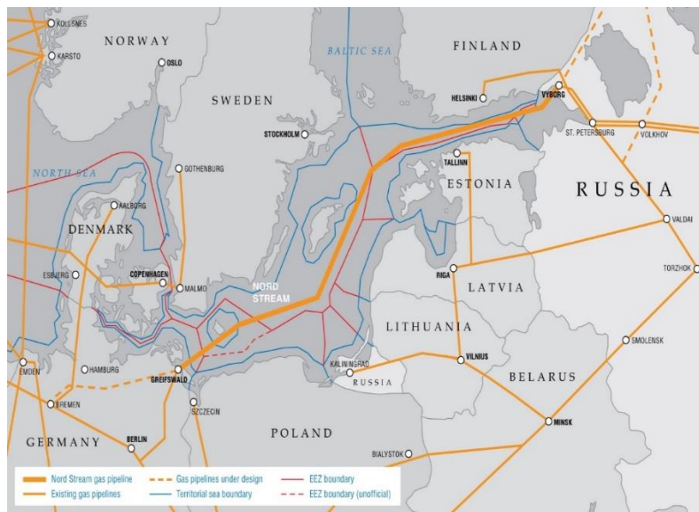
ภาพที่ 4 แผนที่แสดงอาณาเขตทางทะเลและโครงข่ายท่อก๊าซบริเวณทะเลบอลติก