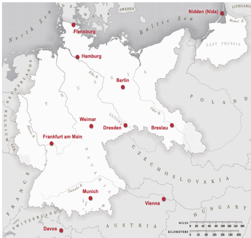
ภาพที่ 7 แผนที่แสดงอาณาเขตและเมืองสำคัญของสาธารณรัฐไวมาร์ (MoMA)