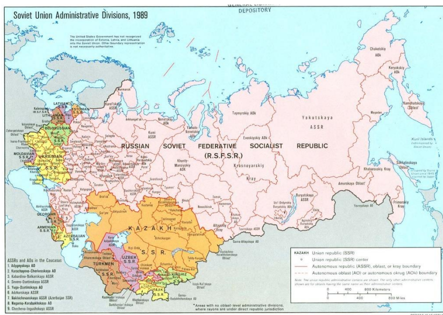
ภาพที่ 9 แผนที่แสดงเขตการปกครองของสหภาพโซเวียต รวมถึงคาลินินกราด ค.ศ. 1989

ของจักรวรรดิรัสเซียใน ค.ศ. 1914 45 ช่วงระหว่างสงครามโลกครั้งที่ 1 ซึ่งกองทัพจักรวรรดิ (Imperial Army) พยายามจะยึดครองดินแดนดังกล่าวจากเยอรมนี