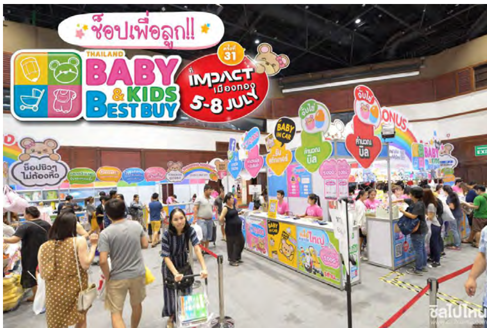
รูปที่ 6 งาน Thailand Baby & Kids best buy ครั้งที่ 31

3.1.5.2 ป้ายจัดแสดงชั่วคราว 25 โดยความตามพระราชบัญญัติภาษีป้าย พ.ศ.2510 มาตรา 8(3) บัญญัติว่า ป้ายที่แสดงไว้ในบริเวณงานที่จัดขึ้นเป็นครั้งคราว โดยคำว่าเป็นครั้งคราว ไม่ได้กำหนดระยะเวลาของการติดตั้งป้ายแล้วได้รับยกเว้นภาษีไว้ จึงทำให้ผู้มีหน้าที่เสียภาษีหลายท่านเข้าใจผิด โดยป้ายชั่วคราว ผู้เขียนเข้าใจว่า เป็นการติดตั้งไว้เพียงระยะเวลาไม่เกินหนึ่งเดือน หรือมีระยะเวลาที่กำหนดอย่างแน่นอน แต่หากเป็นป้ายจัดงานโชว์สินค้าหนึ่งเดือนขึ้นไป หรือ จัดงานเป็นประจำทุกปี ปีละ 15 วัน ในลักษณะนี้ควรได้รับยกเว้นภาษีเนื่องจากเข้าลักษณะของคำว่าชั่วคราว หรือ เป็นเข้าลักษณะของคำว่า ประจำ ยกตัวอย่างเช่น งานขายสินค้าแม่และเด็ก ที่จัดงานทุก 4 เดือน และ หนึ่งปีจัดงาน 3 ครั้งและมีการจัดทุกปีอย่างต่อเนื่อง ผู้เขียนเห็นว่าแบบนี้ควรมีการจัดเก็บภาษีป้ายสำหรับการจัดงานดังกล่าว เพราะถือเป็นป้ายที่ติดตั้งอย่างต่อเนื่อง