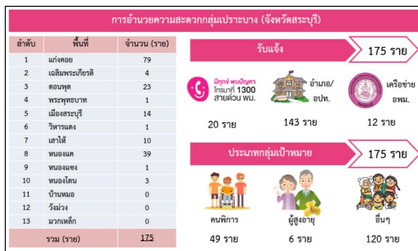
รูปภาพที่ 3 การอำนวยความสะดวกกลุ่มเปราะบาง (จังหวัดสระบุรี)

- การพากลุ่มเปราะบางเข้าถึงวัคซีนโควิด 19 ของกรมพัฒนาสังคมและสวัสดิการในจังหวัดสระบุรี ได้ดำเนินการช่วยเหลือกลุ่มเปราะบางลงทะเบียนฉีดวัคซีนผ่านทาง Application หมอพร้อม และช่วยเหลือกลุ่มเปราะบาง ประเภท ผู้พิการ ให้ได้รับการเข้าถึงการฉีดวัคซีน จำนวน 265 ราย