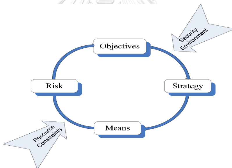
รูปที่ 1 Bartlett Model 34

สภาวะสุดท้าย หรือภาพรวมของทั้งหมดเพื่อบรรลุวัตถุประสงค์ก็ได้ ขึ้นอยู่กับบริบทว่า ยุทธศาสตร์นั้นอยู่ในระดับใด ซึ่งสรุปได้ว่า “ยุทธศาสตร์คือแนวทางที่จะนำไปสู่การบรรลุวัตถุประสงค์ (Ends) ซึ่งวัตถุประสงค์อันนี้ก็มีความมั่นคงนั่นเอง จึงสามารถกล่าวได้ว่ายุทธศาสตร์ เป็นแนวทางเพื่อที่จะให้ได้มาซึ่งความมั่นคง ในอีกกรณีหนึ่ง หากคำว่าความมั่นคงหมายถึงภาพรวมทั้งหมดของปัจจัยทั้งหมดที่เกี่ยวกับความมั่นคงนั้น ก็จะมี ความหมายคล้ายกับคำว่ายุทธศาสตร์นั่นเอง” ซึ่งท้ายที่สุดแล้วยุทธศาสตร์ทางเรือ ก็คือแนวทางที่จะนำไปสู่การบรรลุวัตถุประสงค์ทางเรือ นั่นก็คือการรักษาผลประโยชน์แห่งชาติทางทะเล ซึ่งผลประโยชน์ของชาติทางทะเลที่ระบุไว้ตามแผนความมั่นคงแห่งชาติทางทะเล พ.ศ.๒๕๕๘ – ๒๕๖๔ นั้น มีความหมายที่กว้างขวาง ครอบคลุมไปถึงอำนาจอธิปไตย บูรณภาพแห่งดินแดน สิทธิอธิปไตย และเขตอำนาจของชาติทางทะเล ความมั่นคง ความสงบเรียบร้อย ความปลอดภัย และการมีสภาวะแวดล้อมที่เอื้อต่อการใช้ประโยชน์ และการดำเนินกิจกรรมทางทะเล ความเจริญรุ่งเรือง ความสมบูรณ์มั่งคั่งที่ยั่งยืนของชาติ และความอยู่ดีมีสุขของประชาชนอันเนื่องมาจากกิจกรรมทางทะเลในทุกมิติ สามารถแบ่งออกเป็น ๒ ส่วน คือ ส่วนที่วัดเป็นมูลค่าทางเศรษฐกิจ และส่วนที่ไม่สามารถวัดเป็นมูลค่าทางเศรษฐกิจได้ 33