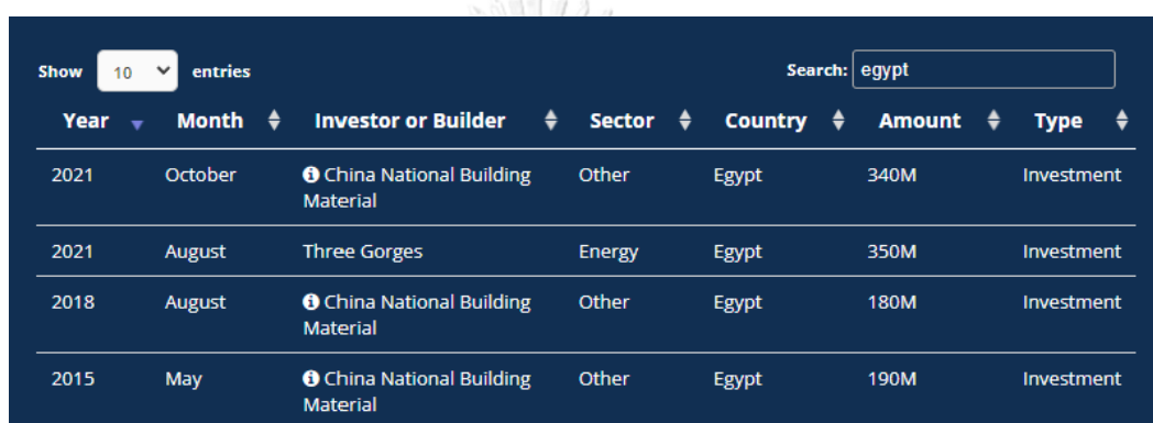
รูปประกอบที่ 3 การลงทุนของจีนในอียิปต์ภายใต้โครงการ BRI

โดยดำเนินการใกล้แล้วเสร็จ และมุ่งหวังว่าตึกดังกล่าวเป็นศูนย์กลางทางธุรกิจของเมืองหลวงแห่งใหม่ 84 รวมถึงดึงดูดการลงทุนในอุตสาหกรรมทางเทคโนโลยี และสร้างนวัตกรรมเพื่อสิ่งแวดล้อม เพราะอียิปต์ตั้งวัตถุประสงค์ให้เมืองหลวงแห่งใหม่ใช้พลังงานสะอาดในการอุปโภคบริโภค ซึ่งจะส่งผลให้อียิปต์สามารถบรรลุการพัฒนาที่ยั่งยืนขององค์การสหประชาชาติได้ 85 แต่ตลอดระยะเวลาการดำเนินโครงการ BRI จีนได้ลงทุนภายใต้โครงการ BRI อย่างเป็นทางการในอียิปต์เพียง 4 โครงการ จากสถิติรายงานของหน่วยงานติดตามการลงทุนทั่วโลกของจีน (China Global Investment Tracker) 86 ดังรูปประกอบที่ 3