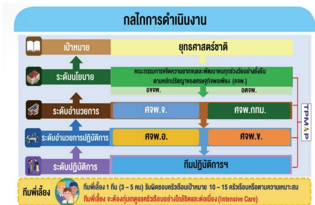
รูปภาพที่ 2 กลไกการดำเนินงานของศจพ.

ครัวเรือน โดยมีทีมปฏิบัติการหรือทีมพี่เลี้ยง เพื่อรับฟังปัญหา และสะท้อนปัญหาความต้องการของประชาชน กลับไปสู่การประเมิน และปรับปรุงเพื่อกำหนดนโยบาย โดย ศจพ. อำเภอ มีปัจจัยที่มีผลต่อการดำเนินการ 5 ปัจจัยตามตัวแบบการจัดการ (Management Model) คือ โครงสร้างองค์การตามคำสั่งโครงสร้างศจพ.อำเภอ มีบุคลากรจากหลายหน่วยงานร่วมกันบูรณาการความร่วมมือ มีการใช้งบประมาณเพื่อดำเนินการขับเคลื่อนกิจกรรมภายใต้ศจพ.อำเภอ สถานที่ในการนำนโยบายลงสู่การปฏิบัติ รวมถึงมีการใช้อุปกรณ์และเครื่องมือสำหรับการขับเคลื่อนนโยบาย